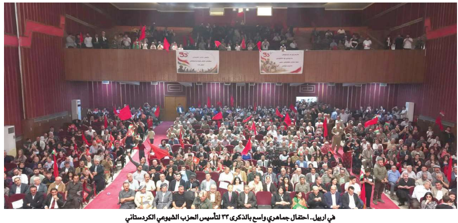
في أربيل- احتفال جماهيري واسع بالذكرى ٣٣ لتأسيس الحزب الشيوعي الكرستاني

الأمد وبفوائد منخفضة لا تتجاوز في بعض الحالات ٢٪. وقال الشيعلي "لطريق الشعب"، أن الاقتراض الخارجي يُعد ممارسة اقتصادية طبيعية عندما يُوظف في تمويل مشاريع تنمية تحقق عائداً يفوق كلفة الاقتراض، مبيّناً أن العديد من دول العالم، بما فيها الولايات المتحدة واليابان، تعتمد على الاقتراض ضمن سياساتها المالية، لذلك فإن وجود الدين بحد ذاته لا يمثل مشكلة، وإنما تكمن المشكلة في حجم الدين مقارنة بالإيرادات وقدرة الدولة على السداد. وأشار إلى أن المعايير الدولية، ومنها معايير صندوق النقد الدولي، تعتبر أن تتجاوز الدين نسبة ٤٠ في المائة، من إجمالي الإيرادات العامة يمثل مؤشراً على دخول الاقتصاد في منطقة الخطر، لافتاً إلى أن نسبة الدين في العراق ما زالت بحدود ٣٢ في المائة، من الإيرادات، أي أنها ما تزال ضمن المستويات الآمنة. وبين أن انخفاض الإيرادات خلال الأشهر الماضية، نتيجة تراجع تدفقات النفط والظروف التي أثرت في حركة الصادرات، أدى إلى ارتفاع نسبة الدين قياساً بالإيرادات، إلا أن ذلك لا يثير القلق في الوقت الراهن، ولا سيما مع امتلاك العراق احتياطيات مالية جيدة تعزز الاستقرار المالي.