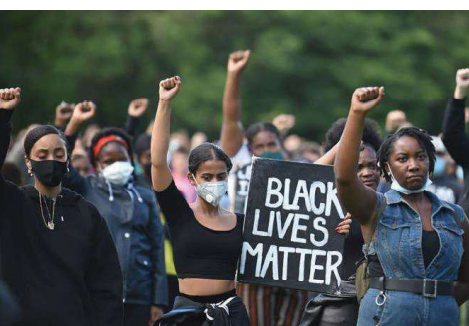
حياة السود مهمة

المُنظرة فائسا تومسون تذكّرنا، في سياق التقليد النظري الراديكالي الأسود، بأن الفاشية ليست قطعياً مع الديمقراطية، بل هي مندسة فيها. إنها تتجلى تحديداً حيث تُضَيَّب الذاكرة، حيث يحى التاريخ، حيث يُقرَّر بصورة سلطوية ما يمكن كتيه وما لا يمكن. وهو ما يجعل رد الفعل الراهن ضد التاريخ الأسود هُوَ ذاتها للفاشية لا مجرد سياسة ثقافية محافظة. هذا الرُّى لا يعمل عبر الإجراءات المؤسسية وحدها، بل عبر تعبئة ما وصفه عالم الاجتماع أرجون أباداري بـ«الفضاءات العاطفية العامة»؛ فضاءات لا تتغفل بالهجو بل بالمشاعر والانتماءات والصور والرموز تُرشح الولاء وتقمي اللتباس. وقد كانت لورين هيل، أومها «The Miseducation of Laurn Hill» عام ١٩٩٨، قد استعارت مفهوم ودوسون ونقلته إلى مكان آخر: التعليم الفاسد ليس مسألة تجريدية تخص المناهج والمعرفة، بل إنه حالة وجودية تسم العلاقات وعلاقة الإنسان بذاته، وتنتج النواظ لم يعد إنتاج الفكرة.