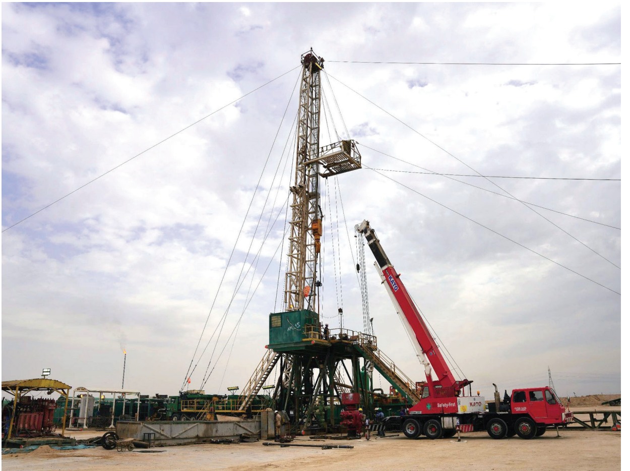
جانب من استصلاح البئر النفطي في حقل الزبير من قبل شركة الحفر العراقية

المكتب السياسي للحزب الشيوعي العراقي 13 كانون الثاني 2026