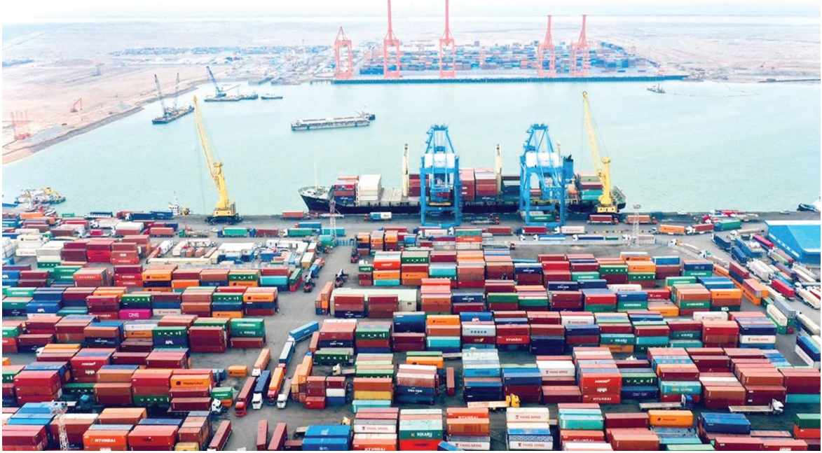
استيرادات العراق خلال الأشهر التسعة من العام الماضي بلغت أكثر من 63 مليار دولار

- قرار مجلس الوزراء رقم (١٣) لسنة ٢٠١٩: نص صراحة على توحيد التعرفة الكمركية والإجراءات في جميع المنافذ العراقية دون استثناء، وبشكل المرجع الأساسي للتطبيق العملي للوحدة الكمركية. 2. الواقع العملي والمشكلات الحالية: على الرغم من النصوص الدستورية والقوانين النافذة، لا تزال المشكلة الأساسية في العراق هي التطبيق العملي للسياسات الكمركية، وعدم توحيد الإجراءات بين المنافذ، ما أدى إلى: - تداول بضائع غير مستوفاة الرسوم في بعض المحافظات، خصوصاً من منافذ إقليم كردستان إلى باقي المحافظات. - استمرار ازدواجية التعرفة الكمركية