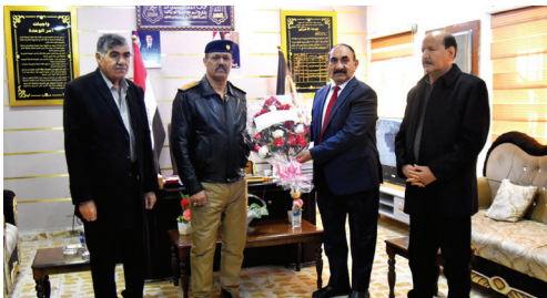
شيوعيو الديوانية يقدمون باقة ورد إلى قيادة الفرقة الثامنة