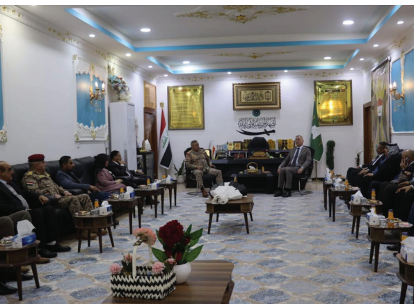
شيوعيو ديالى يزورون مقر قيادة عمليات المحافظة