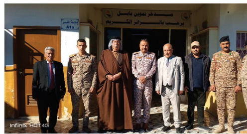
شيوعيو المحاويل يزورون القطعات العسكرية في المدينة