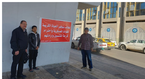
شيوعيو الكرخ يرهمنون لافتات في المناسبة