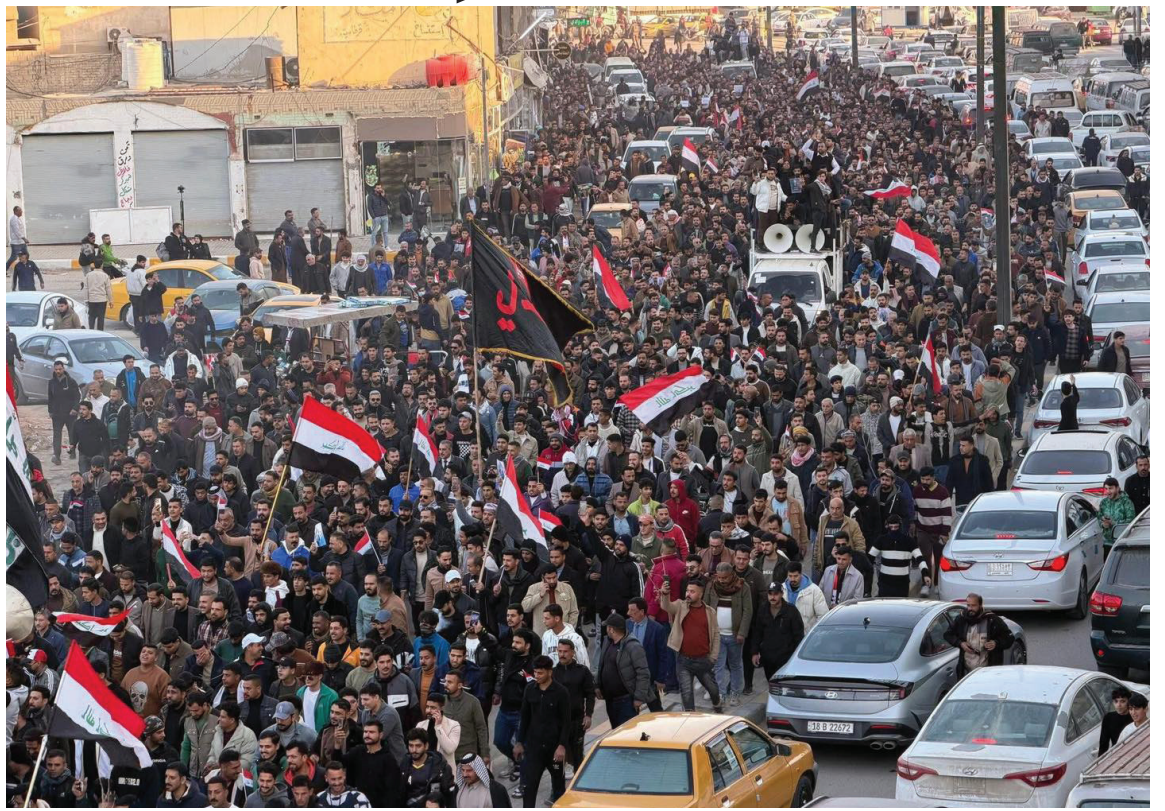
حشود من المتظاهرين في بابل تطالب باختيار محافظ كفو ونزيه

لقد دفع العراقيون ثمننا باهظا لنظام المحاصصة الذي أضعف مؤسسات الدولة، وفتح المجال أمام تفكك القرار السيادي، وسمح بانتشار السلاح خارج إطار المؤسسات الدستورية،