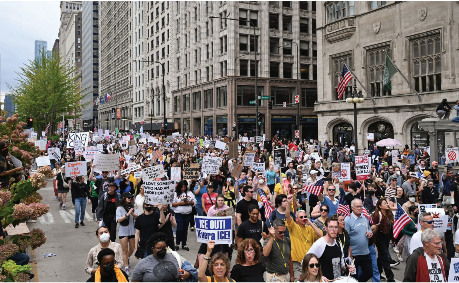
ساع الاحتجاجات في الولايات المتحدة ضد سياسات ترامب العدوانية

ركزت استراتيجية الأمن القومي، بصورة خاصة، على الأمريكيتين، أو ما يُسمى بـ "الصف الكرة الغربي" والتهديدات القريبة من الأراضي الأمريكية، مستعيدة "مبدأ مونرو"، المبدأ الذي بلوره الرئيس الأمريكي جيمس مونرو في رسالة وجهها إلى الكونغرس في الثاني من كانون الأول/ديسمبر ١٨٢٣، ونظر فيها إلى دول أميركا الجنوبية باعتبارها "الفناء الخلفي" للولايات المتحدة، التي لن تسمح لأي قوة خارجية بأن يكون لها وجود فاعل فيها. وبرز تطبيق هذا المبدأ في حملة النفط الشديدة التي تشنها إدارة دونالد ترامب منذ أسابيع على فنزويلا، التي تملك واحداً من بين أكبر احتياطات النفط الخام في العالم وتقيم علاقات وثيقة مع روسيا والصين؛ هذه الحملة التي بدأت بفرض حظر شامل على جميع ناقلات النفط التي تدخل إلى فنزويلا، وتخرج منها، وبشرى آلاف الجنود في المنطقة، فضلاً عن عشرات الطائرات المقاتلة، وقاذفات القنابل، والسفن الحربية وأكبر حاملات طائرات في العالم، وشهدت قيام الطائرات الأمريكية، فجر الثالث من هذا الشهر، بقصف مواقع في مدينة كاركاس واعتقال الرئيس نيكولاس مادورو وزوجته ونقلهما بالقوة إلى الولايات المتحدة، لنظر بصورة قاطعة أن الحديث عن مكافحة نفط المخابرات إلى الولايات المتحدة ما هو إلا ذريعة، وأن الهدف الحقيقي للحملة