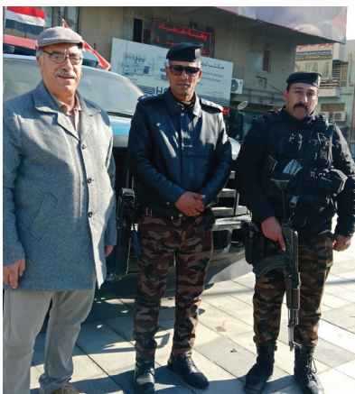
المحلية المالية تهنئ الضباط والمتنسين في شوارع بغداد

بغداد والمحافظات نشاطات ميدانية متنوعة، تضمنت زيارات إلى مقر أمنية ونقاط تفتيش، لتقديم التهاني وتوزيع الورود على الضباط والمتنسين، فضلاً