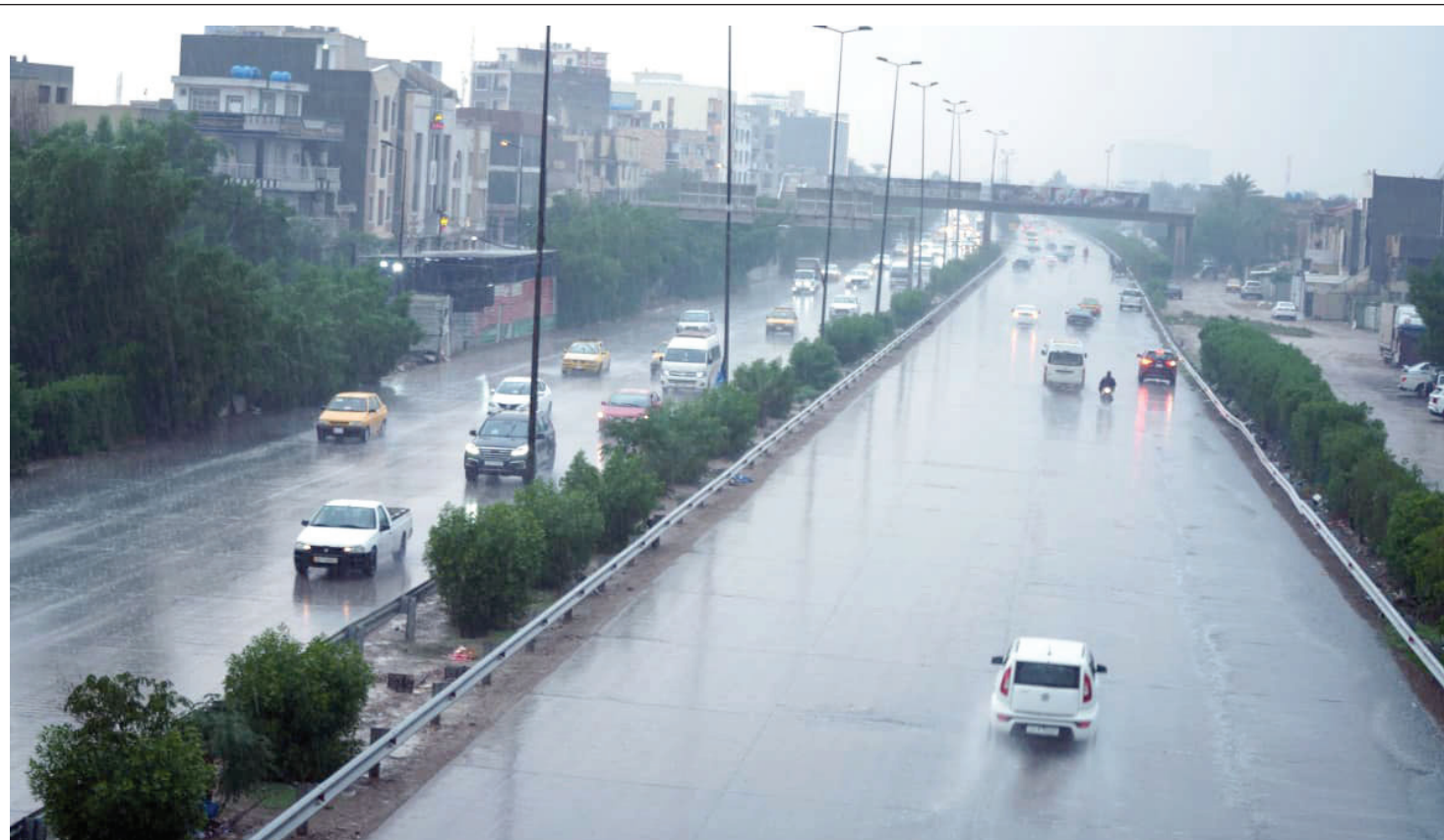
الأنواء الجوية تؤكد استمرار تقلبات الطقس في عموم البلاد الأسبوع الحالي وتشكل الضباب يصعب الرؤية صباحاً

وتناول اللقاء سبل تطوير أدوات التأثير السياسي والاجتماعي، وتفعيل آليات العمل المشترك، بما يعزز قدرة الطرفين