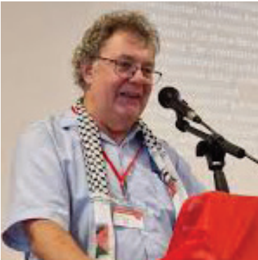
رئيس الحزب الشيوعي الالماني كويلر

على مدى أكثر من ستة عقود، تفرض الولايات المتحدة حصاراً اقتصادياً وتجارياً ومالياً على كوبا لإضعاف اقتصادها والتسبب في "الجوع واليأس للإطاحة بالحكومة". فور أدائه اليمين الدستورية لولايته الثانية، أعاد دونالد ترامب إدراج كوبا على قائمة