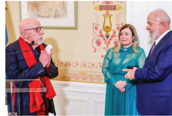
الرئيس البرازيلي (إلى اليمين) يتحدث إلى الروائي باولو كويلو

وفي منشور له عبر صفحته الرسمية على «انستغرام»، قال سيلفا أن «الخيماي» هي الرواية البرازيلية الأكثر مبيعا على الإطلاق. وصدرت الطبعة الأولى للرواية عام ١٩٨٨. فيما صدرت بترجمتها العربية عام ٢٠٠١ عن شركة المطبوعات للتوزيع والنشر في لبنان. ثم توالى طبعاتها العربية حتى وصلت إلى ٤٥ طبعة، لتحصّل لقب الرواية الأكثر مبيعا على امتداد العالم العربي.