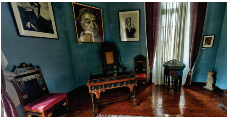
متحف كفافيس في مدينة الاسكندرية

كل قاعة من قاعات المنزل جزءاً من المقتنيات، حسب تصريحات مديرته استافرولا اسبانودي لـ«الشرق الأوسط». وقد راعى العرض أن توضع البورتريئات والصور الخاصة بالشاعر اليوناني الأشهر في التاريخ المعاصر إلى جانب مخطوطات القاصد التي تم حفظها ووضعها في فائريبات خاصة تم إعدادها خصيصاً لهذا الغرض.