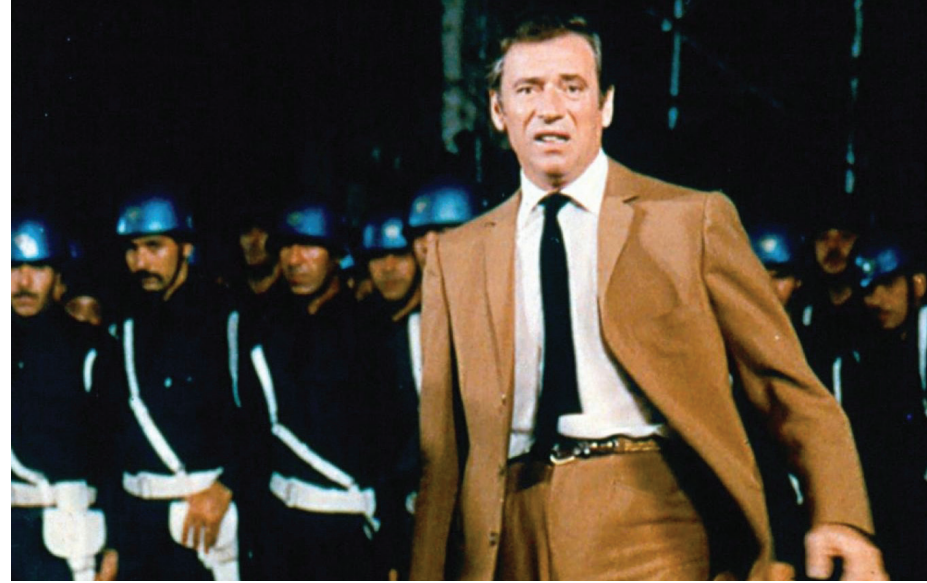
إيف مونتان في مشهد من فيلم "زد" لكوستا غافراس

ففي ذلك الحين، أي منذ ربيع عام 1968، كانت الانتفاضات الشبابية والطلابية تعيم مدينة باريس بل مدناً عدة ومتفرقة في العالم أجمع وفي معظم قارات ذلك العالم، وبشكل لم يسبق له مثيل حتى في "الكومونة الباريسية" وثورات 1848 في شتى أنحاء أوروبا. وكان كثر من كبار مثقفي فرنسا وغيرها قد أعلنوا مساندتهم ذلك الحراك وبخاصة في أوساط السينمائيين. ومن هنا انتقلت العدوى الثورية إلى مهرجان كان تحت رعاية أقطاب الموجة الجديدة