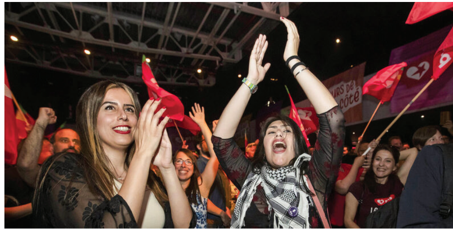
انصار حزب العمل البلجيكي يحتفلون بنجاحهم

وفي وقت تعيش فيه قوى اليسار الجذري في أوروبا حالة تراجع ومصاعب جمّة، ويصعب على أكثرها الوصول إلى إجابات ناجعة على الأسئلة المطروحة، يواصل حزب العمل البلجيكي نجاحاته الجماهيرية والانتخابية. وتقف وراء هذا النجاح جهود متميزة ووضوح فكري، وعملية تجديد متواصلة في بني الحزب وآلياته وأدواته، مكنته من التحول من حزب ماركسي صغير لم تتجاوز عضويته 800 في عام 2003، إلى حزب يضم أكثر من 25 ألف رفيقة ورفيق. وتعود جذور حزب العمل البلجيكي إلى الحركة