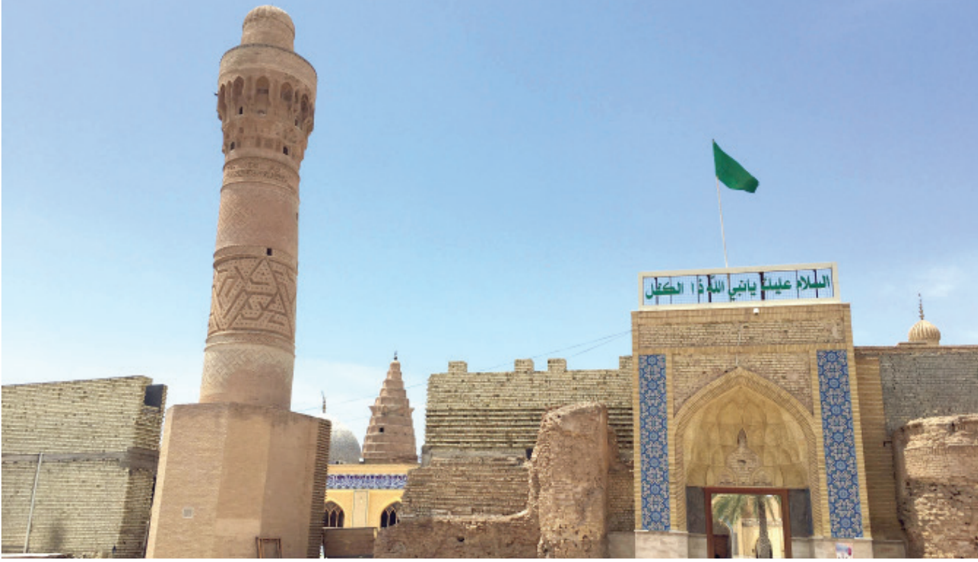
مقام النبي ذي الكفل في محافظة بابل

«العراق بلدنا، نحن عراقيون وهذا منبثنا، لقد تعرضت طائفنا للهجوم باستمرار ولم يتم توفير الحماية لنا، الجماعات الدينية المتطرفة تعتبرنا زنادقة، لقد اضطّر العديد منا إلى الإختفاء عن الساحة ومعظمنا غادر البلاد، وعائلانا الآن مشتتة في بلدان مختلفة، إذ يُنظر إلينا من خلال معتقدنا وليس كمواطنين عراقيين». لقد أدّت عملية محو التراث الثقافي في شكلها المتطرف إلى تسوية مواقع أثرية ودينية وثقافية بأكملها بالأرض، فضلاً عن ارتكاب جرائم بحق الأيزيديين والتركمان الشيعية وكذلك بحق السكان العرب الشيعة والسنة. ومن المفارقات انه على الرغم من السياسة الإقصائية ثقافياً التي مارسها تنظيم داعش، فإنه استغل الآثار العراقية كمصدر للدخل. ولا يزال جزء كبير من التراث