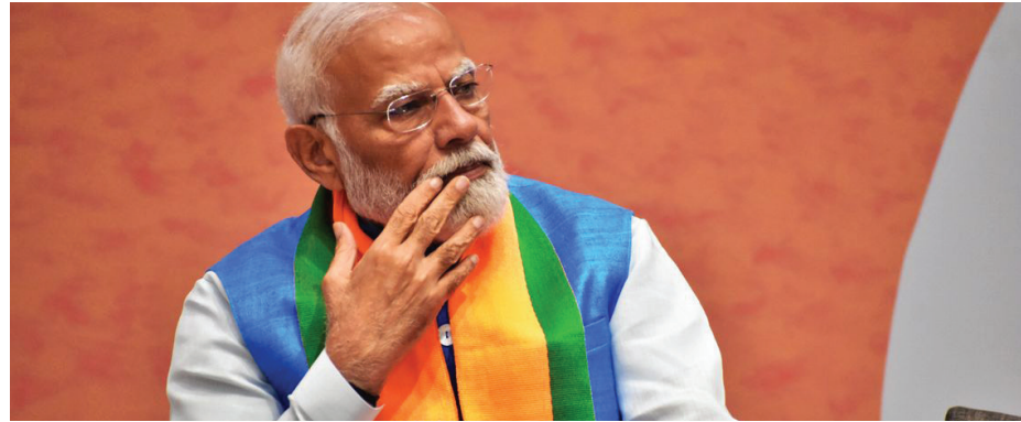
هل سينجح مودي في تجاوز تراجمه الكبير؟

أعلى بست مرات من المعدل العام البالغ ٧,٥ في المائة. ويعمل قرابة ٥٠ في المائة من الشباب بأعمال غير مستقرة او يعانون البطالة، هذا يعني إن أكثر من نصف الأسر تعاني من هذا الواقع. ووفقاً لدراسة استقصائية أجرتها وكالة «السياسة العامة» ومركز دراسة المجتمعات النامية في منتصف نيسان الفائت، أكد ثلثا المشاركين في الاستطلاع أن أهم المشاكل مرتبطة بسياسة التشغيل وارتفاع التضخم. ومرشحو حزب بهاراتيا جاناتا الذين ركزوا على ملفات التعصب الديني إما خسروا أو فازوا بهامش أصغر. ولكن على الرغم من أولوية القضايا الاقتصادية والاجتماعية، فإن مكاسب المعارضة بقيت محدودة.