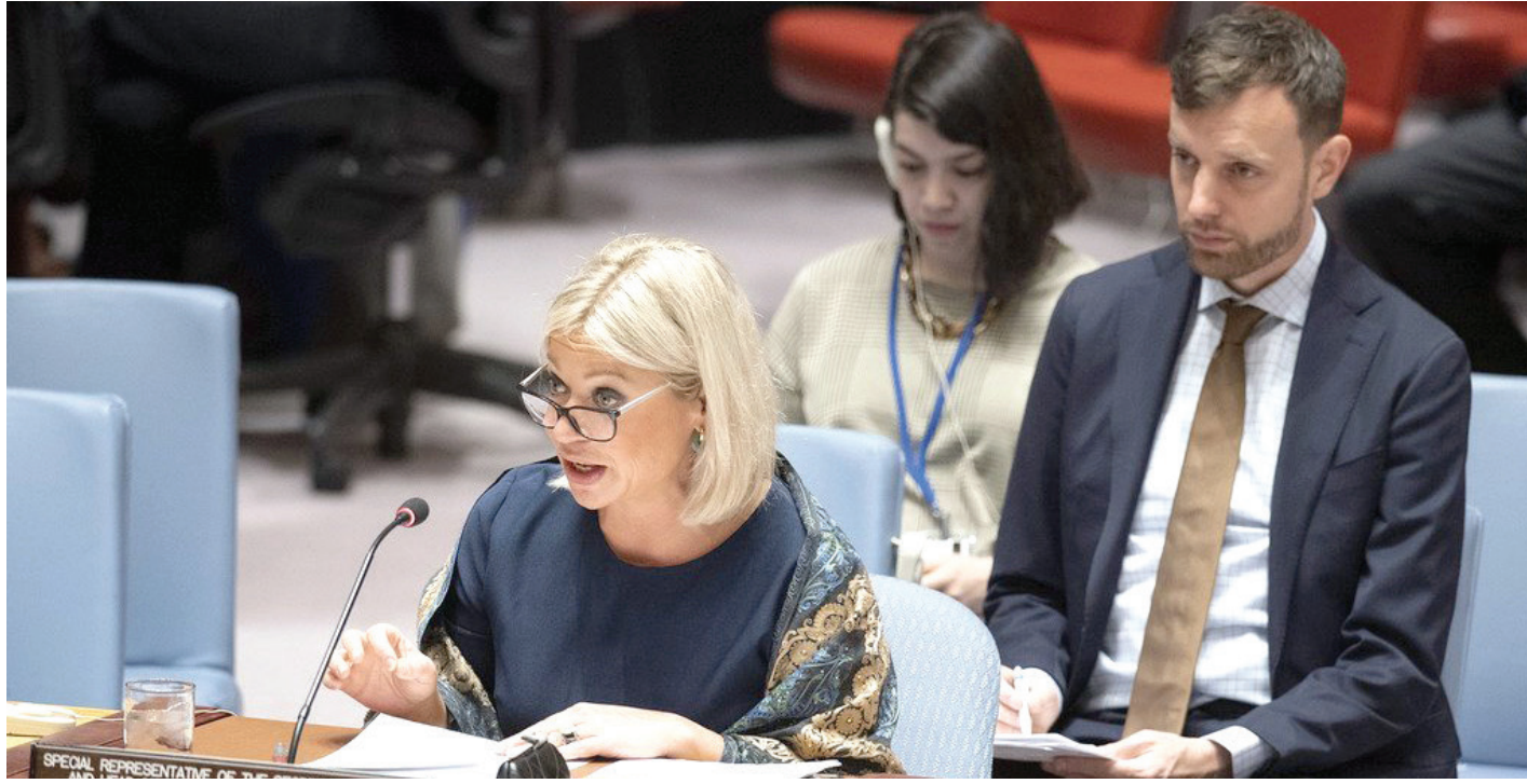
المبعوثة الاممية للعراق جنين بلاسغارت

وقال الكفائي انه «ابتداءً من القرار ١٥٠٠ لعام ٢٠٠٣ وثم عدل ذلك القرار واصدر مجلس الامن قرارا اخر هو ١٧٧٠ لعام ٢٠٠٦ في حكومة رئيس الوزراء الاسبق نوري