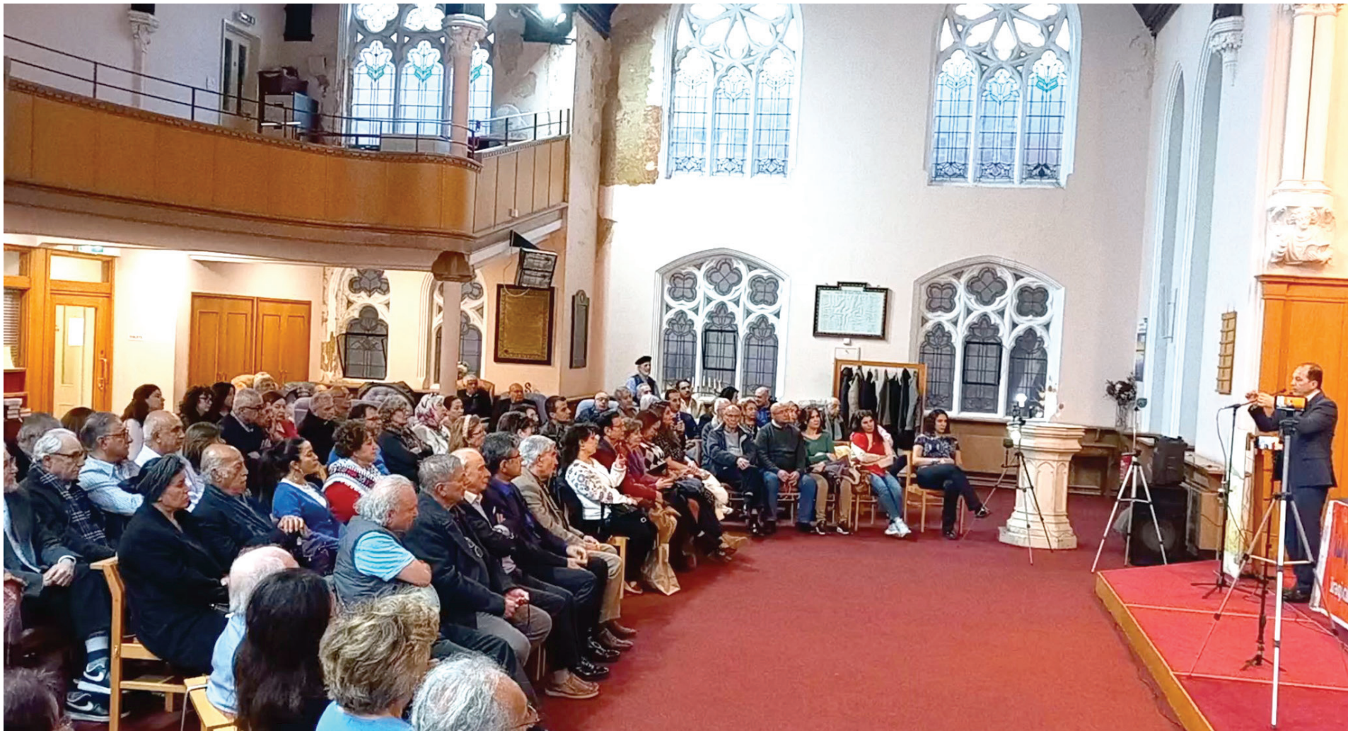
القاعة ازدحمت برواد المقهى

يا حبيبي كل شيء بقضاء.. ما بأيدينا خلقتنا عتساء رما تجمعنا أقدارنا.. ذات يوم بعد ما عز اللقاء فإذا أنكر خل خله.. وتلاقينا لقاء الغرباء ومضى كل الى غايته.. لا تقل شئنا فإن الحظ شاء