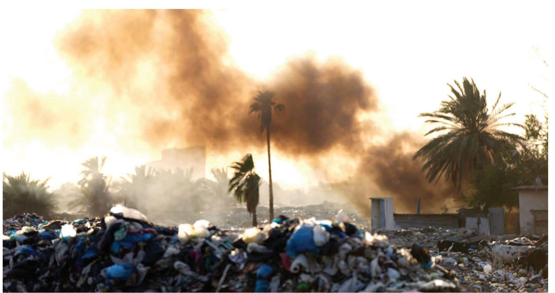
دخان النفايات المحترقة يلوث الهواء والاجواء ويخنق المواطنين في بغداد

ورغم كل هذا لم تتخذ الحكومة موقفا جديا، وأثار القلق انسياقها وراء رغبات اردوغان، وعملها على توسيع التعاون الاقتصادي والتنموي مع حكومته. فلماذا هذا الصمت غير المفهوم إزاء الانتهاكات التركية المستمرة والسافرة للسيادة العراقية؟ أم ان للانتهاكات التركية طعما مميذا لا ندركه نحن بسطاء العراقيين؟