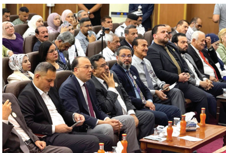
جانب من حضور حفل الافتتاح

تحت اسم الشاعر الراحل خالد الداحي، اختتمت أمس السبت في مدينة بعقوبة، فعاليات «مهرجان تامراً» الشعري السنوي الرابع، الذي أقامه اتحاد الأدباء والكتاب في ديالى.