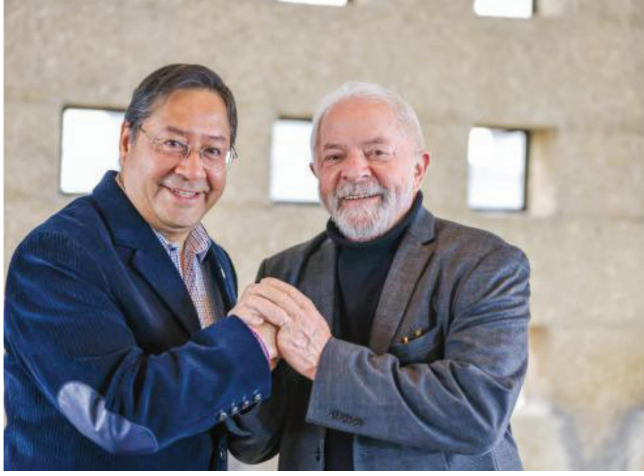
ارسي و لولا موقف مشرف من القضية الفلسطينية

وتعليقاً على القرار الأخير الذي اتخذته محكمة العدل الدولية بدعوة إسرائيل إلى وقف هجومها في رفح قال الرئيس الكولومبي: «ليس فقط مكتب المدعي العام للمحكمة الجنائية الدولية، الذي أمر باعتقال نتنياهو، ولكن أيضاً محكمة العدل الدولية دعت إلى إيقاف الإبادة الجماعية من قبل حكومة نتنياهو، وإن ذلك «بين طابع الهجبة التي تم إطلاق العنان لها ضد فلسطين».