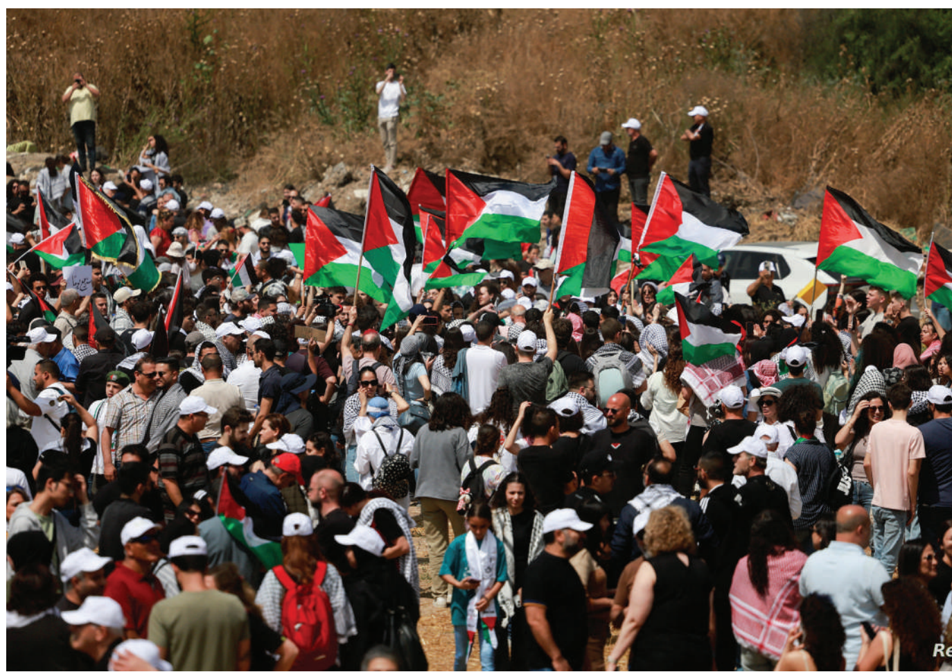
فلسطينيون يحيون ذكرى النكبة يوم أمس في مدينة حيفا

وتمثل هذه المقابر تذكيراً مؤلماً بالعديد من الضحايا الأبرياء الذين فقدوا حياتهم جراء الاعتقال التعسفي، التعذيب، القتل الجماعي، وتحمل أسراراً تنتظر من يكشفها، إذا انه لا يزال هناك الكثير منها لم يتم العثور عليها بعد، بانتظار الصدفة التي تقيط اللثام عنها، لتحقيق العدالة لضحايا هذه الجرائم البشعة ولذويهم. بعثة الأمم المتحدة لمساعدة العراق (يونامي) ومكتب حقوق الإنسان في الأمم المتحدة وثقوا وجود أكثر من ٢٠٢ موقع للمقابر الجماعية في محافظات نينوى وكروك وصلاح الدين والأنبار في الأجزاء الشمالية والغربية من البلاد. كذلك مقبرة الخسفة او كما يطلق عليها (حفرة الموت) التي لم تفتح بعد، والتي يتوقع أنها تضم نحو ٤ آلاف رفات، قتلهم تنظيم داعش الإرهابي. وتشير تقارير رسمية، إلى أن العدد الأكبر من تلك المقابر هو من حصص محافظة نينوى (٩٥ مقبرة)، تليها محافظات كركوك (٣٧ مقبرة)، وصلاح الدين (٣٦ مقبرة)، والأنبار (٢٤ مقبرة).