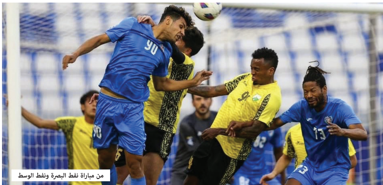
من مباراة نفط البصرة ونفط الوسط