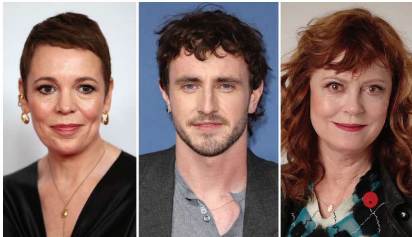
سوزان ساراندون، بول ميسكال، وأوليفيا كولمان من بين الفنانين المتبرعين

ممثلين وفنانين معروفين، وتذكر خاصة لحضور عروض كوميدية مرتجلة، وفرصاً لالتقاط صور شخصية بكاميرا صحافي سينمائي محترف، أو قضاء يوم في مواقع التصوير السينمائي، وغيرها. وقد تدفقت هذه التبرعات من مجموعة واسعة من المواهب السينمائية من المملكة المتحدة وخارجها، من بينهم تيلدا سوينتون، ورامي يوسف، وبيتر كابدالي، وبول ميسكال، وأوليفيا كولمان، وسوزان ساراندون، وإيميلدا ستونتن، وبريان كوكس، وجوزيف كوين،