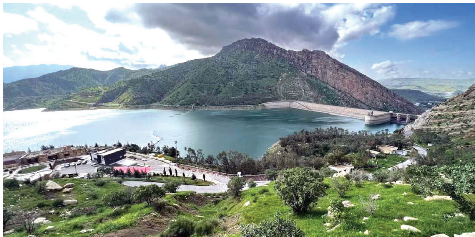
بعد ثماني سنوات.. سد دربندخان يفيض مرة أخرى. هل نحسن استغلال مياهنا؟

تعد جرائم الفساد الإداري والمالي من المعضلات المعقدة التي تواجه العراقيين الذين ذاقوا الأمرين من النظام الدكتاتوري السابق والحكومات العراقية المتعاقبة منذ العام ٢٠٠٣ بسبب تفشي ظواهر استغلال المنصب الوظيفي وسرقة ثروات الشعب، وتهربها الى الخارج كأرصدة وعقارات، فيما يتفنن الفاسدون في إخفاء جرائمهم عبر تسجيل الأموال في أرصدة بنكية بأسماء ذويهم أو غيرها، مستغلين تعدد جنسياتهم وعلاقاتهم مع بعض الجهات الخارجية. وفي الاثناء بدأت محاولات استرداد الأموال عبر تأسيس صندوق لها.