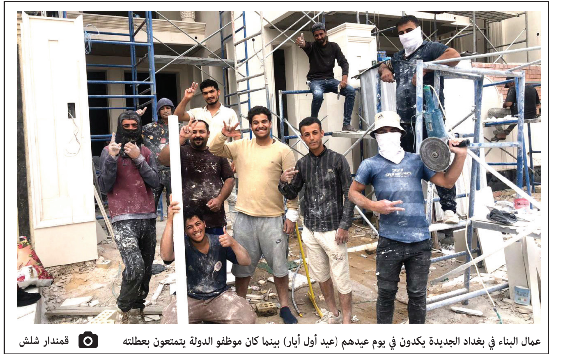
عمال البناء في بغداد الجديدة يكدون في يوم عيدهم (عيد أول أيار) بينما كان موظفو الدولة يتمتعون بعطلته قمندار شلش

واحتوت بيانات الاتحاد الدولي أيضاً قوائم تدرج بها أعداد الدول التي ينتهك بها