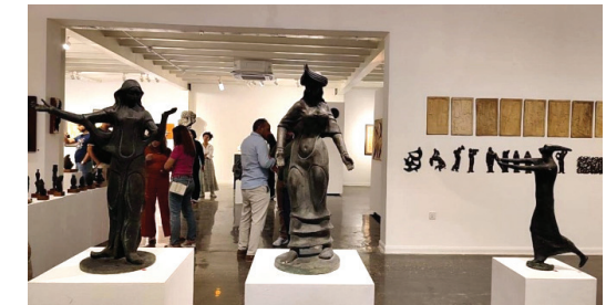
متابعة - طريق الشعب

افتتح الأسبوع الماضي على قاعة "ذا غاليري" في الكرادة، معرض استعادي شامل لأعمال النحات الراحل محمد غني حكمت، حمل عنوان "ها أنا نحات عراقي.. سليل حضارة وادي الرافدين". ضم المعرض الذي أقامته "ذا غاليري" بالتعاون مع أولاد حكمت، نحو 200 عمل، بينها منحوتات ومصغرات لأعمال التقيد المنجزة في شوارع بغداد وعدد من الدول العربية، إضافة إلى تخطيطات وصور شخصية، ومقتنيات من نظارات طبية وقفازات وعدد أدوات كان يستخدمها في مشغله الفني. وترك محمد غني حكمت، الملقب بشيخ النحاتين العراقيين، أعمالاً بارزة تعد من شواخص بغداد ومعالجها، مثل نصب شهريار وشهرزاد وكهرمانة وإنقاذ الثقافة العراقية وغيرها.