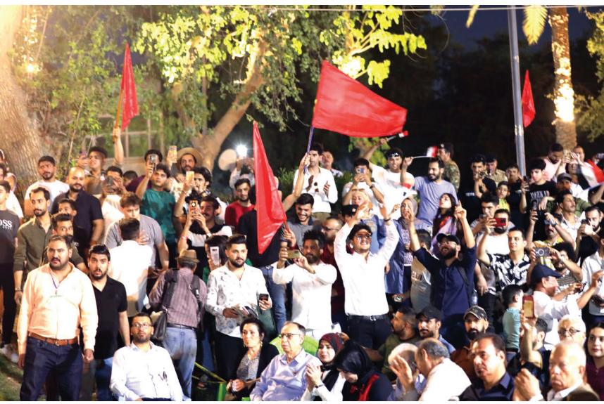
هكذا بدا التفاعل مع منصة المهرجان