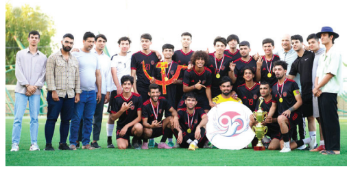
المشاركة في الحفل الختامي لهذه الفعاليات، والذي سيقام يوم الجمعة الموافق ٢٦ نيسان، في تمام الساعة الرابعة مساءً، في قاعة اتحاد الشباب والرياضة.

في إطار الاحتفالات بالذكرى التسعين لتأسيس الحزب الشيوعي العراقي، نظمت منظمة الصورة للحزب يوم الخميس الماضي مهرجاناً كروياً مميّزاً على أرضية ملعب الاتحاد بالصورة.