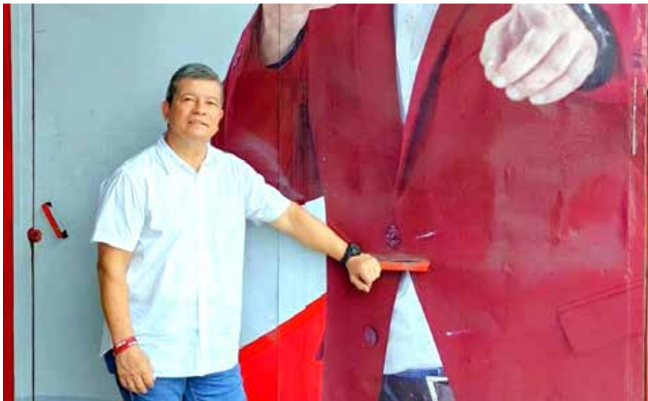
مانويل إتشينو فلوريس يسعى لقيادة الحزب

وكانت الجبهة قد نجحت في عام ٢٠٠٩ مع مرشحها موريسيو فونيس بإنهاء ٢٠ عاماً من حكم اليمين المتطرف. وتعيش السلفادور حالياً حالة من الاستبداد تزداد سوءاً. عندما ترشح الرئيس اليميني الحالي لأول مرة عام ٢٠١٩ طرح برنامجاً لتغيير سياسي جذري، وتحالف مع منظمات حقوق الإنسان والحركات الاجتماعية التقدمية، بما في ذلك منظمات الحركة النسوية. وفي سياق الممارسة، اتضح ان