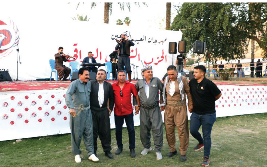
الدبكة الكردية كانت حاضرة أيضاً

الدجيلي، ودموع الحيايب التي ودعها ناظم السماوي هناك ومضى إلى حريته، ومن سجن الكوت.. من تلك المواجهة الدموية الخالدة، التي دارت بين السجناء العزل، والحراس القتل.. وبأبي القطار بعرباته العديدة من موقع ( الموقف العام ) حيث قلعة فاضل العزاوي الخامسة، وحيث هبة حمزة سلمان (أبو سلام)، الى شياط سلام عادل - وما ادراك ما سلام عادل - وبقيّة العقد الماسي من تلك الأسماء البطولية الصامدة..