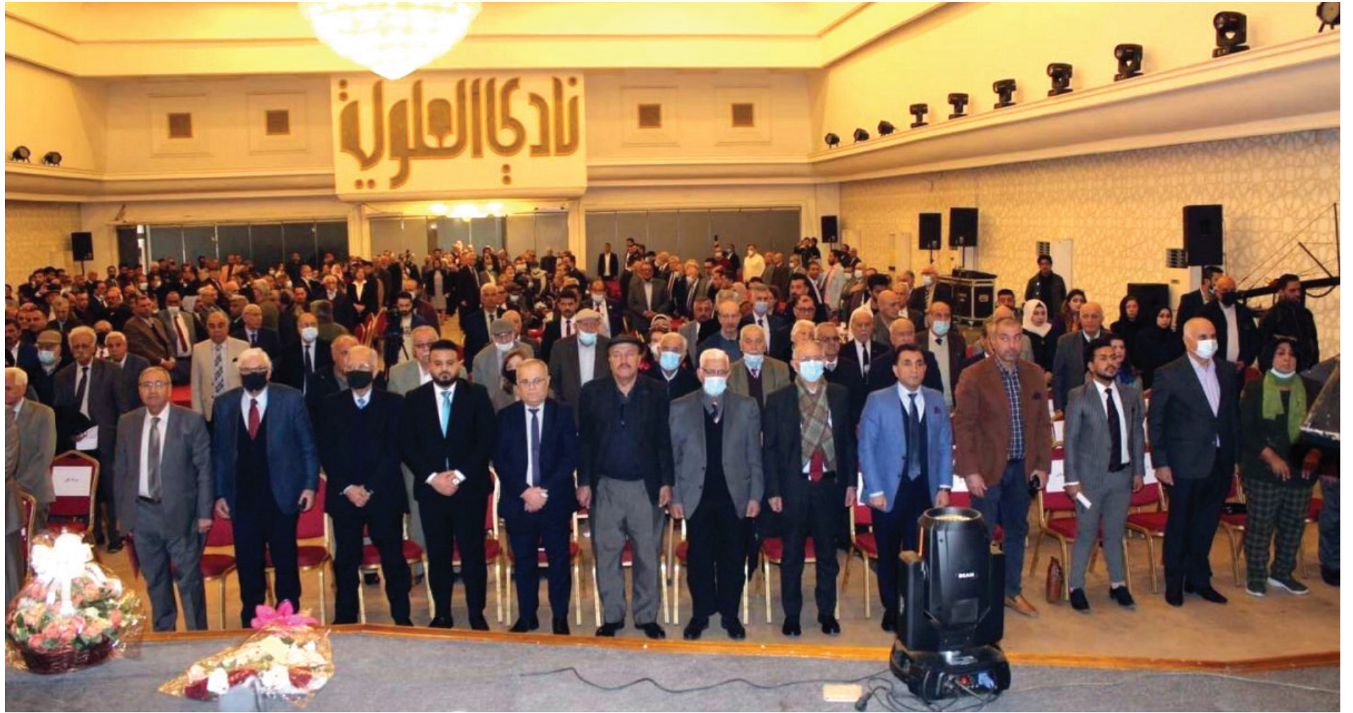
المؤتمر الثالث للتيار الديمقراطي العراقي انعقد اواخر كانون الثاني ٢٠٢٢