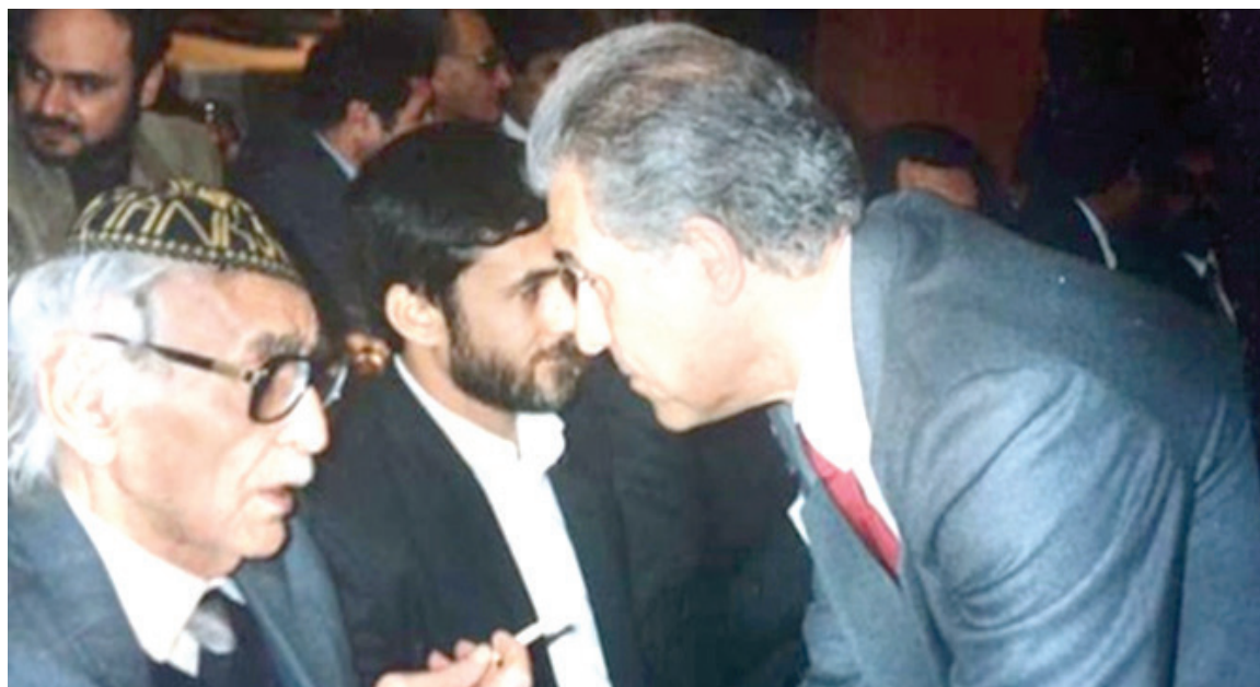
الجواهري و عبد الرزاق الصافي في بيروت 1991

٧/ النشاط الريادي للجواهري في مجالات العمل النقابي والمدني، الوطني والعربي والعالمي، منذ اواسط الاربعينات، ومن أبرزها: مساهمته، ممثلاً وحيداً عن البلاد، في المؤتمر التأسيسي لحركة السلام العالمية في بولندا... ثم تبوؤه مهمة نقيب صحفيي العراق الاول، ورئيس اتحاد الادباء