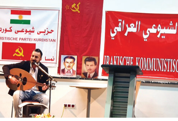
فيينا - طريق الشعب

أقامت منظمة الحزب الشيوعي العراقي والحزب الشيوعي الكردستاني في النمسا، يوم الأحد 14 نيسان الجاري، احتفالاً خطابياً وفنياً في مناسبة الذكرى الـ 90 لتأسيس الحزب الشيوعي العراقي.