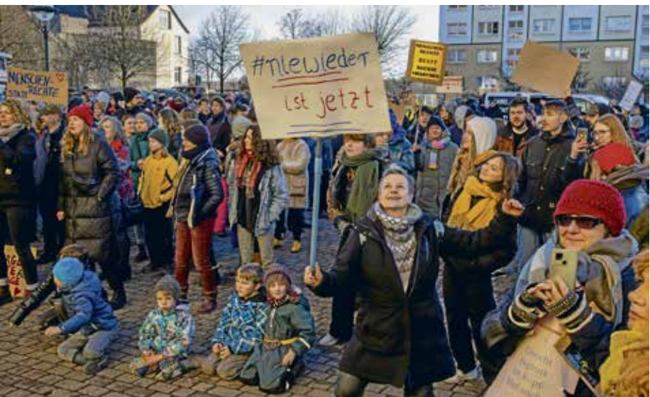
جانب من الاحتجاجات المضادة للنازيين الجدد

يشعر الكثير من الناس أن الأمور لا يمكن أن تستمر على هذا النحو. وبالتالي فإن التحدي يكمن في مناقشة الرؤى والمفاهيم الفعالة مع بعضها البعض، ومواصلة دفع عملية التحول الديمقراطي في المجتمع. ومستقبلاً ستزداد الأمور سوءاً. وللعلم نغزرات البديل، من الضروري تطوير أفكار أكثر تقدمية وديمقراطية في سياق مناقشة آفاق المستقبل. وبالتالي فالاحتجاجات الديمقراطية لا تحافظ على الوضع الراهن فقط، بل تمثل فرصة لتجاوزه.