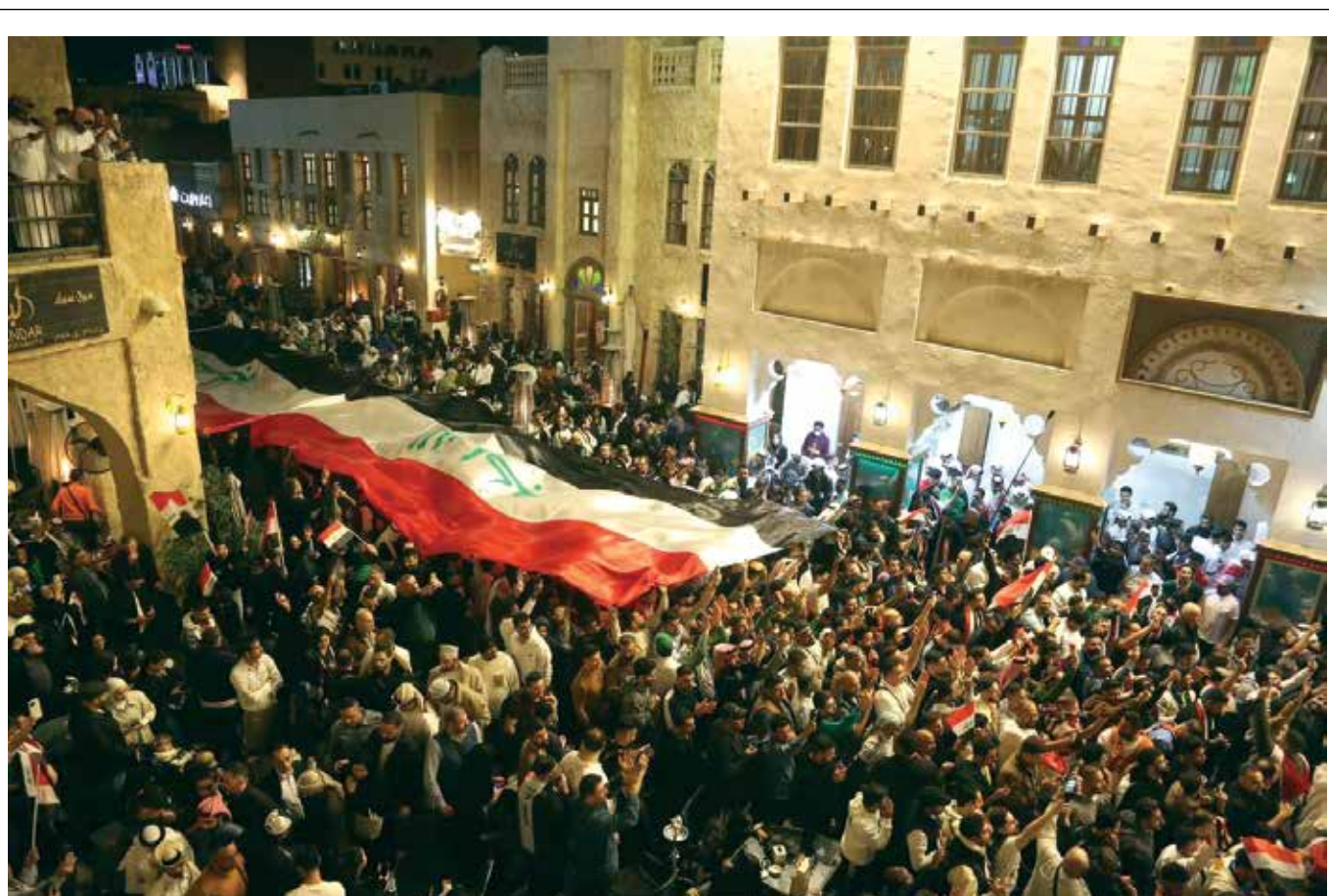
خسارة منتخبنا يوم أمس.. مراقبون: كأس آسيا خسر الجمهور الأفضل في البطولة

وأضاف أن «الفصائل أعلنت أنها غير معنية بمفاوضات الحكومة رغم إعلان مساعي الحكومة لكي يكون هناك شكل من أشكال الهدنة بعد أن أعلنت وجود جدول زمني لإجلاء القوات الأجنبية من العراق»، مبيّناً أن «ملف العلاقة بين أمريكا والفصائل المسلحة يكاد أن يكون معزول عن الحكومة العراقية».