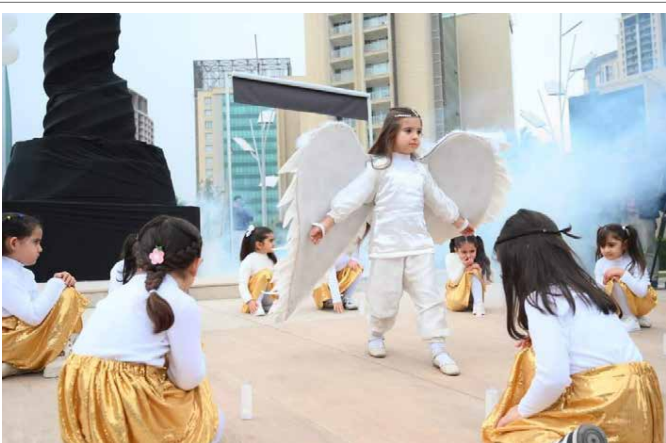
مراسم عزاء في مجمع امباير السكني في اربيل.. بعد الهجوم الصاروخي اليراني الذي اودى بحياة عدد من المواطنين

للتحالف الدولي، وجهتهم بالتصدي لأي اعتداء يحصل على هذه القواعد، كونها قواعد عراقية وفيها ضيوف متواجدين بواقفة الحكومة».