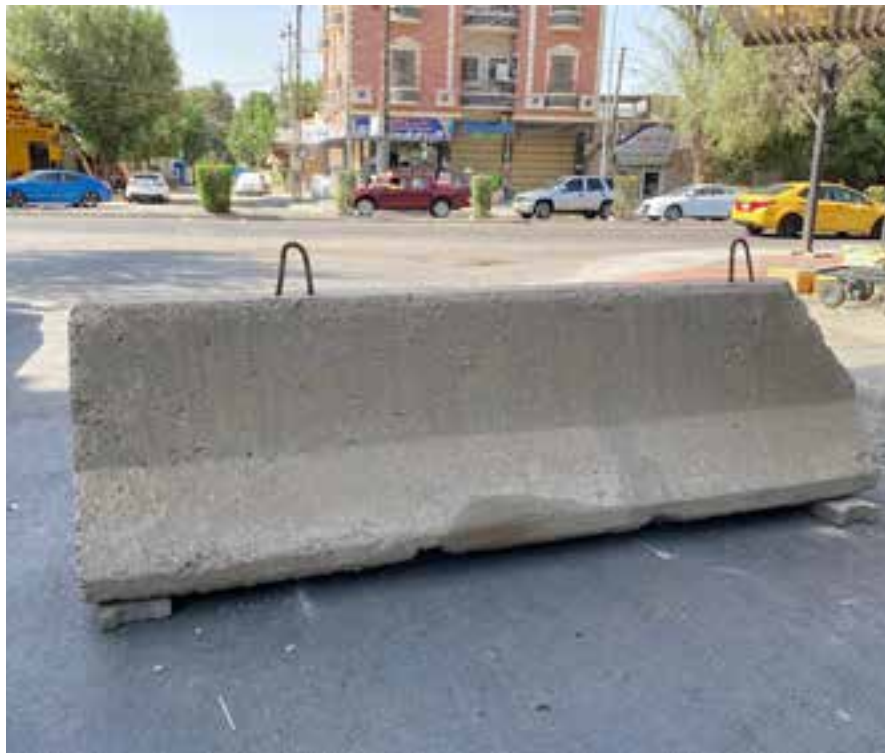
بذرائع أمنية يعتمد البعض على إغلاق الرزاق الذي يقع فيه مكتبه!

وتنقل وكالة أنباء "العربي الجديد" عن مسؤول أمني في وزارة الداخلية، قوله أن "عشرات الشكاوى ترد