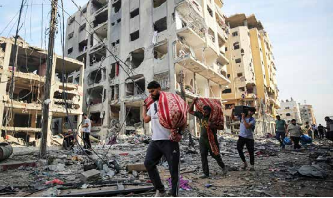
صمود وبطولة للشعب الفلسطيني أمام آلة الموت والدمار الصهيونية

التي تسعى إلى قمع الانتقادات. وخرج عشرات الآلاف، يوم الأحد الماضي، في تظاهرات مبدن أوروبية وعربية تنديدا بتواصل العدوان الإسرائيلي. وشارك نحو 9 آلاف مظاهرة في بروكسل تأييدا للفلسطينيين، وتأتي المسيرة عشية اجتماعات مرتقبة بين وزراء خارجية دول الاتحاد الأوروبي ونظرائهم الإسرائيلي والفلسطيني والمصري والسعودي والأردني للبحث في الحرب. وكانت تظاهرة أخرى خرجت، السبت الفائت، من العاصمة الفرنسية باريس في مسيرة لدعم فلسطين باتجاه العاصمة البلجيكية بروكسل للمطالبة برفض "عقوبات ضد إسرائيل بسبب انتهاكاتهما في غزة". وفي إسبانيا، أعلن رئيس الوزراء الإسباني بيدرو سانشيز دعمه لعشرات الآلاف من الأشخاص الذين تظاهروا، تأييدا للفلسطينيين في مدن إسبانية عدة. وقال سانشيز خلال مؤتمر للحزب الاشتراكي: "نحن أيضا معهم جميعاً". ونظمت مظاهرات دعت إليها منصة "شبكة" للتبديد باحتلال فلسطين تحت شعار "فلنوقف الإبادة في فلسطين" في مدن إسبانية كبرى بينها مدريد التي شهدت أكبر تظاهرة شارك فيها، بحسب الحكومة، 25 ألف شخص. وفي مدينة البندق شمال المغرب، شاركت عشرات الحقوقيات بالمغرب في وقفة احتجاجية ونددت بعجز المجتمع الدولي عن وقف الحرب.