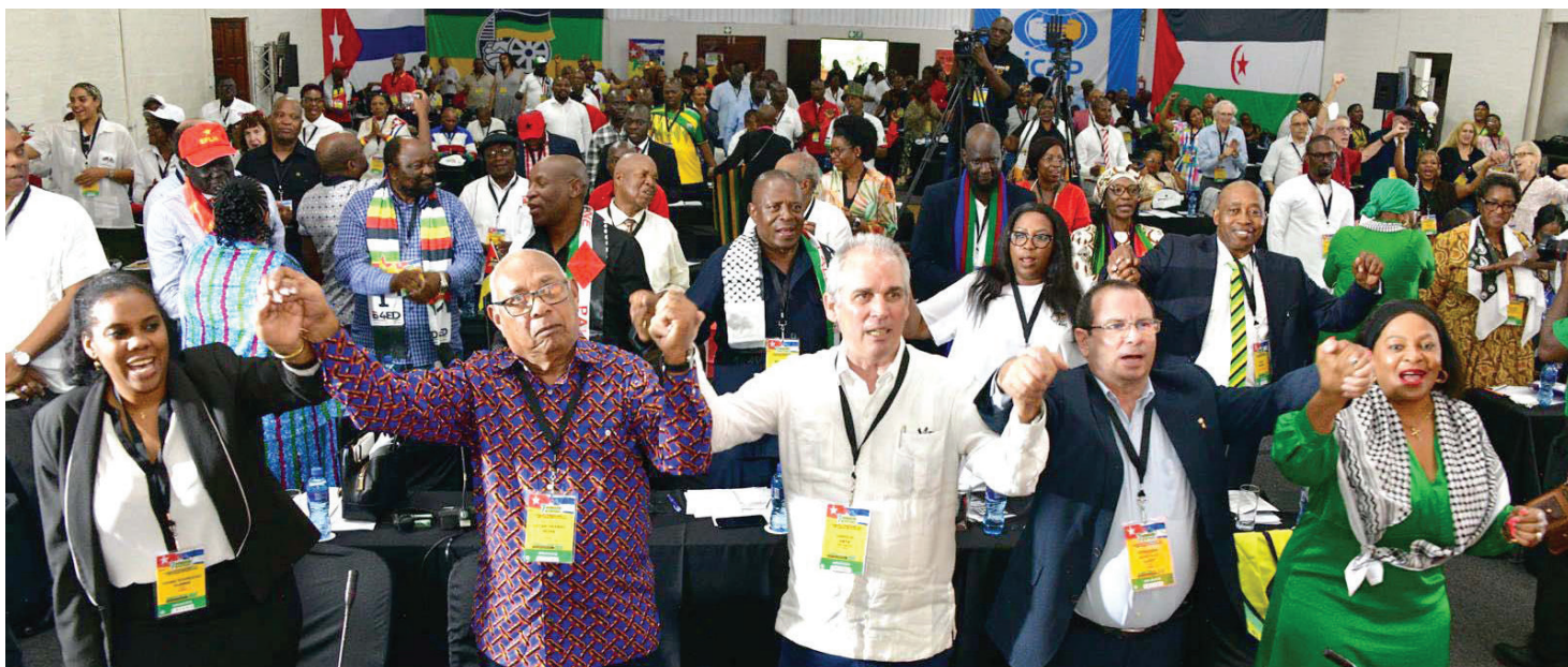
جانب من جلسات اللقاء

الخمسة من العودة إلى كوبا في عام 2014 بفضل حملة تضام عالمية.