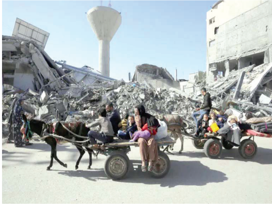
بسبب نفاذ الوقود ... العربات التي تجرها الحمير وسيلة نقل اساسية في غزة

وفي السياق، قال مكتب المدعي العام السويسري، أن «السلطات تلقت عددا من الشكاوى الجنائية ضد الرئيس الإسرائيلي إسحاق هرتسوغ خلال مشاركته بالمنتدى الاقتصادي العالمي في دافوس». وذكر المكتب