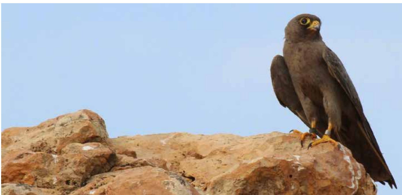
الصقر السنجاري.. احد طيورنا المهددة بالانقراض بسبب الصيد الجائر

وزاد البيان بالقول: إن هناك أنواعاً اختفت بشكل مؤكد من بيئة الأهوار والمناطق المتاخمة لها، مثل الأسد عديم البدة، الذي قال عنه فنصل روسيا في البصرة ألكسندر آدموف في كتابه (ولاية البصرة في