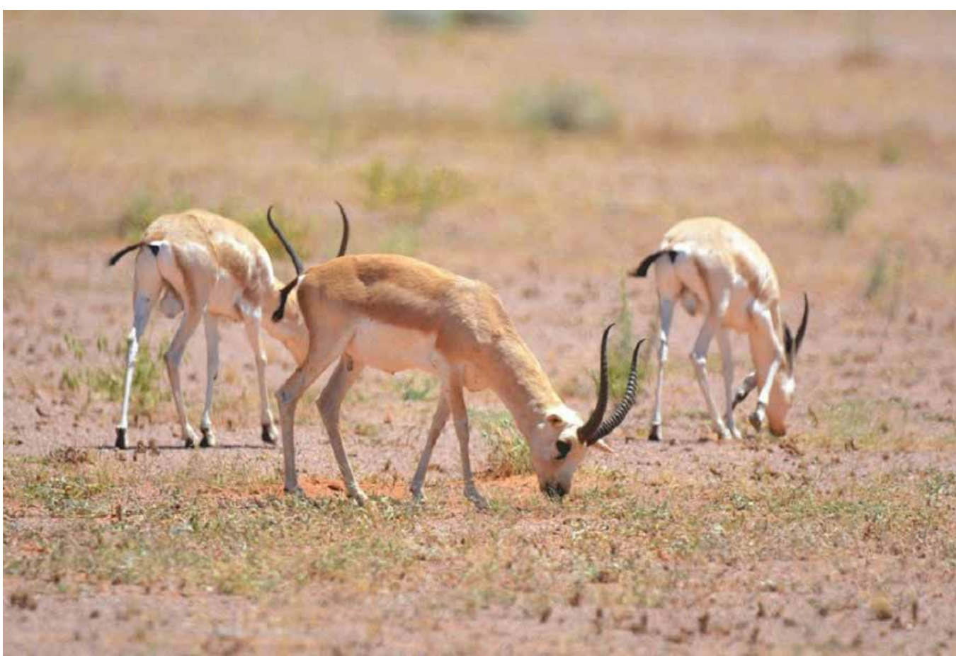
الصيد الجائر يهدد التنوع الاحيائي في العراق

الباحث والسياسي د.عصام فيلي يقول ان العراق لا يزال يفتقر الى تجربة برلمانية حقيقية، ويعد أن هذه التجربة لم تولد على اساس علمية قائمة على مفهوم المعارضة والسلطة، بل كل الطبقة السياسية سواء كانت معارضة للنظام او غير معارضة، تصعد مبرك كتملة الحكومة او تنزل منها. ويشير فيلي في حديث مع «طريق الشعب» الى عدم وجود مفهوم حقيقي للمعارضة «نتيجة الخلط في بنية النظام السياسي وطبيعة تشكيل الحكومة، وبالتالي فان القوى السياسية ترى انه لا يمكن التصويت لأي حكومة الا في حال كانت لهم فيها الجزء الاكبر او هم جزء منها، وحين يكون الفرد جزءا من الحكومة لا يمكن له ان يذهب باتجاه تشكيل قوة حقيقية تراقب الاداء». ويضيف بالقول ان «الحال ذاته بالنسبة للتشريعات، فهناك ما يقرب من 50 قانونا بحاجة الى تشريع، إذ نص عليها الدستور لكنها معطلة حتى الان. نحن امام حقيقة يجب الاعتراف بها: البرلمان يراة له ان يبقى مجرد شكل غير فعال، ولا يرتقي الى مستوى البرلمانات في العالم». ويستدرك بالقول: ان الصراعات السياسية «هي ما تتحكم بالمشهد وتترك تأثيراتها حتى على قوانين تلامس حياة الناس. بينما الكثير من التشريعات المطلوبة معطلة، مثل قانون النفط والغاز الذي وجد ليعالج الكثير من المشاكل. كذلك المادة 140 التي لم يتم حلها». ويؤكد انه في كل برلمانات العالم «تذهب المعارضة الى تشكيل حكومة ظل تراقب الاداء الحكومي. لكن القوى السياسية في البلاد لا تراقب ولا تدفع بهذا الاتجاه، بل انها كانت جزءا اساسيا ومعرفا للأداء الحكومي، والحال ينطبق ايضا على الرقابة والشفافية». ويخلص الى القول «اننا امام أزمة نخوية لا تفهم طبيعة المهام المناطة بها او التي تقع على عاتقها».