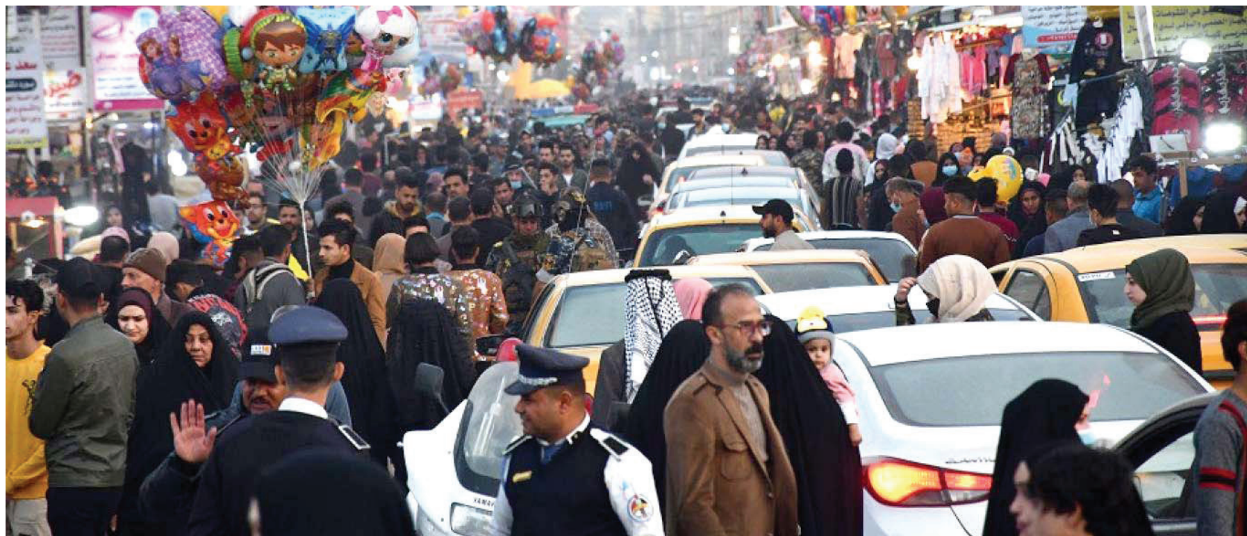
بغداد. طريق الشعب

يعد التعداد السكاني العام أداة أساسية لفهم تركيب المجتمع وتحديد احتياجاته، إذ إن هذا العمل الإحصائي يشكل حجر الزاوية للتخطيط الاقتصادي والاجتماعي، لما يوفره من بيانات دقيقة حول توزيع السكان، والتغيرات في هياكل العائلات، والنمط الديموغرافي.