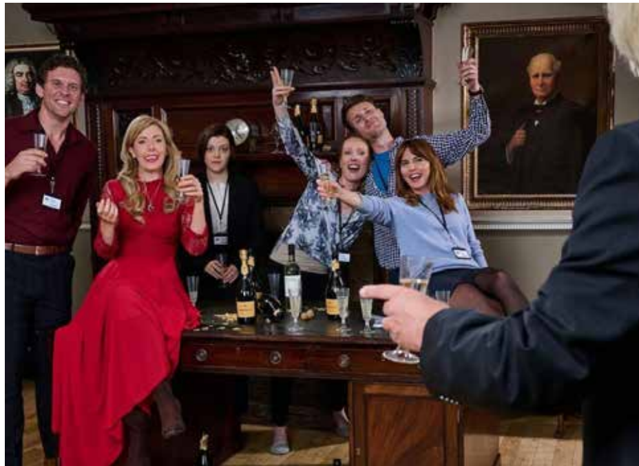
من فضيحة بارتي غيت

أشجع الفضائح هي التي يدفع الأبرياء حياتهم ثمناً لها، فكيف إذا تكاثفت الفضيحة البشعة مع أخرى تدور في فلكتها؟ قد ينجو «البطل» بجلده من السجن، إلا أنه يبقى في عين العاصفة، كما هي الحال مع رئيس الوزراء البريطاني الأسبق، بوريس جونسون، الذي لم يفشل في مكافحة كوفيد فقط، بل استخف بضحاياه!