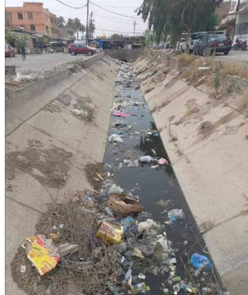
"نهر الشاخة" وسط مدينة المقدادية في محافظة ديالى.. من مصدر للماء العذب إلى مكب للقمامة والصرف الصحي! أهالي المقدادية يناشدون الجهات المعنية تنظيف النهر وانتشاله من واقعه المزري