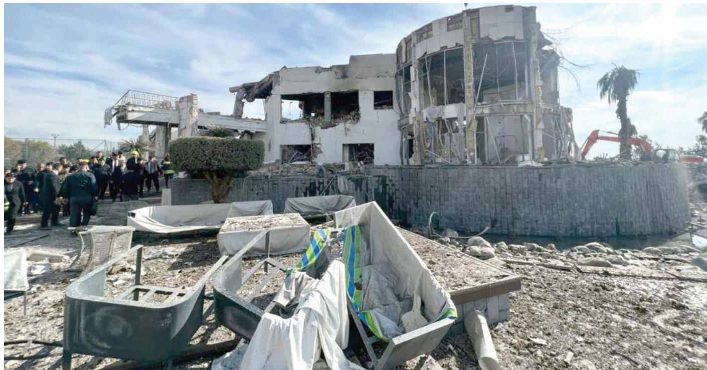
آثار القصف الإيراني في أربيل

وأضاف في تغريدة على منصة إكس، «اطلعنا ميدانياً وبرفقة أعضاء اللجنة التحقيقية، على منزل رجل الأعمال المستهدف في أربيل، وتبين أن الادعاءات التي تحدثت عن استهداف مقر للموساد لا أساس لها من الصحة»، مؤكداً مواصلة الاجتماعات مع الأجهزة الأمنية في الإقليم «وسرفع التقرير للقائد العام».