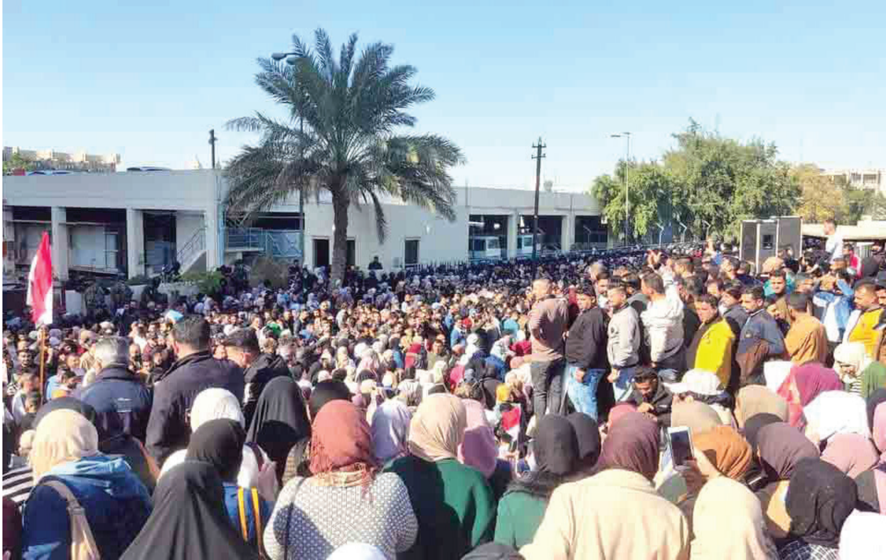
من احتجاجات المحاضرين امام وزارة التربية في بغداد

من كل ما تقدم فان الارتقاء بالصناعات الاستراتيجية والصناعات التحويلية سواء الحكومة او المشتركة والخاصة لا يمكن ان يكتب لها النجاح ما لم تقترن بمتابعة يومية جادة من قبل الحكومة المركزية وان تفعل القوانين الحمائية مع ادخال لتكنولوجية المتقدمة وتطوير مهارات العاملين في الداخل والخارج وتحفيز المبادرات وتطوير الخبرات وتشريع القوانين الضامنة لحقوق العمال.