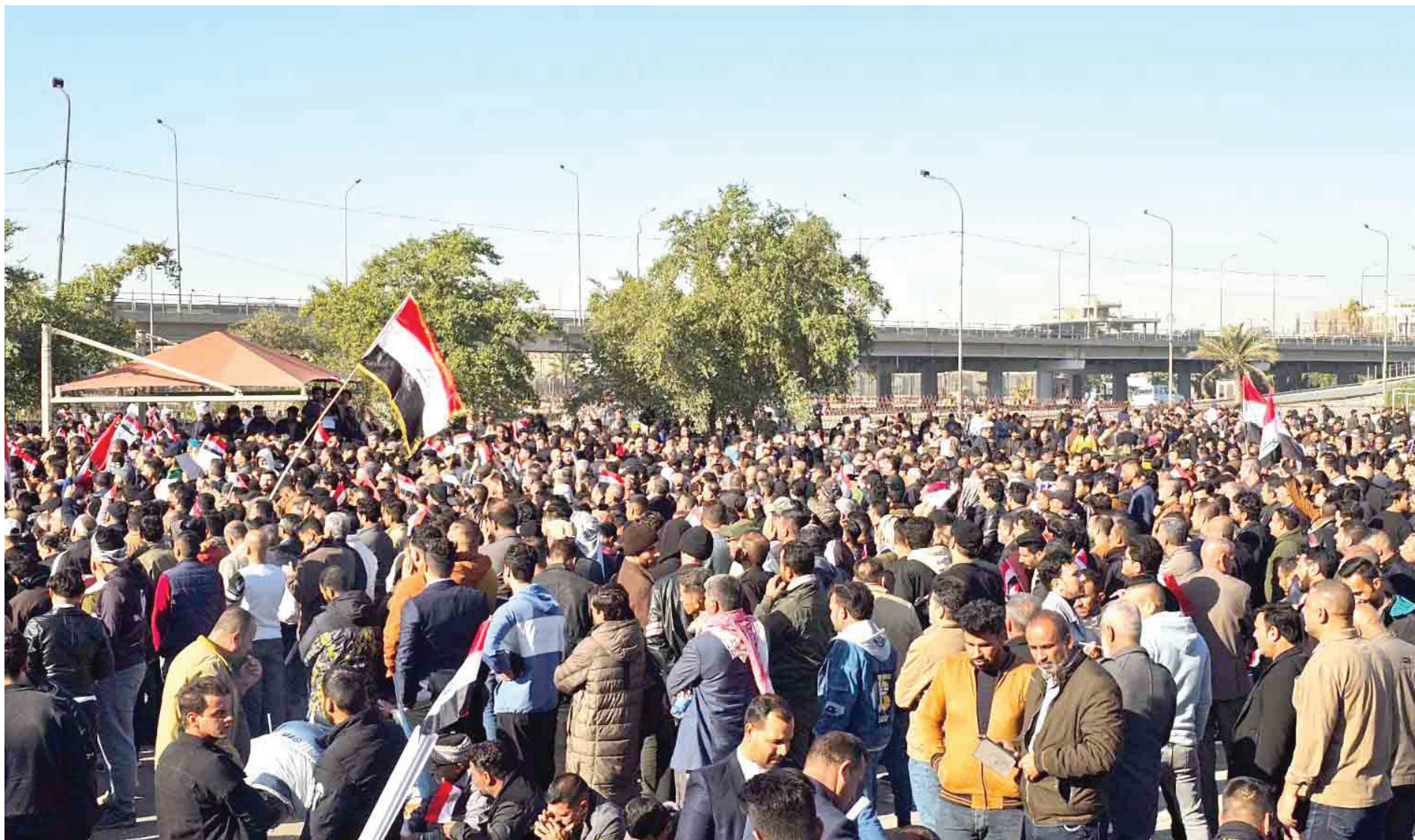
من تظاهرات الموظفين المطالبين بتعديل سلم الرواتب أمام مبنى وزارة المالية أمس الاول في بغداد