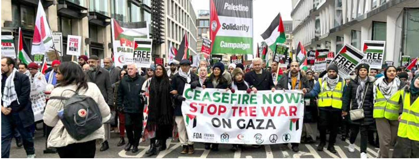
تظاهرة مليونية في لندن، يوم أمس، من أجل السلام في غزة

وبدأت فعاليات المسيرة العالمية لنصرة فلسطين في لندن، بوصفها عاصمة محورية ضمن إطار يوم التضامن العالمي من أجل غزة في جميع أنحاء العالم. وتأتي هذه الفعالية الكبرى بتنظيم من حملة التضامن مع فلسطين، والمنتدى الفلسطيني في بريطانيا، وتحالف أوقفوا الحرب، وحملة نزع السلاح النووي، وأصدقاء الأقصى، والرابطة الإسلامية في بريطانيا. وقد اتحدت هذه المنظمات تحت راية موحدة لدعم القضية الفلسطينية. وحمل المتظاهرون في لندن دمية عملاقة لطفلة سورية لاجئة تدعى أمل الصغيرة سارت مع المتظاهرين المطالبين بوقف فوري لإطلاق النار في غزة. وتم تصميم الدمية التي يبلغ ارتفاعها 3,5 متر لتسلط الضوء على محنة الأطفال اللاجئين، وسرافقتها مجموعة من الأطفال الفلسطينيين خلال المسيرة الوطنية السابعة من أجل فلسطين. ونقلت صحيفة "الغارديان" البريطانية عن شرطة العاصمة لندن تأكيدها بوجود شرطي كبير مع حوالي 1700 ضابط في الخدمة لمراقبة المسيرة، بما في ذلك العديد من القوات خارج لندن. وطالبت شرطة لندن المتظاهرين باحترام عدة شروط، وأنها: يجب على أي شخص مشارك في الموكب ألا