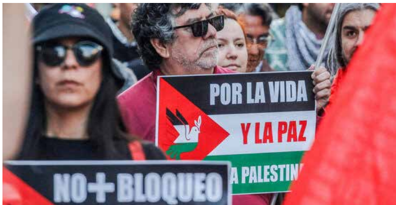
تظاهرة تضامن مع الشعب الفلسطيني في تشيلي

الدعوى القضائية التي رفعتها جنوب إفريقيا ضد إسرائيل. وأعلنت وزارة الخارجية في العاصمة الكولومبية بوغوتا أن تصرفات الحكومة الإسرائيلية تشكل "أعمال إبادة جماعية". وقال بيان للوزارة، إن "إسرائيل كدولة ملزمة بتجنب هذه الجرائم بأي شكل، وبالتالي فهي مسؤولة أمام العالم أجمع عن عدم الامتثال