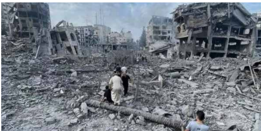
تدمير منهجي للحياة في قطاع غزة

ورحبت وزارة الخارجية الفلسطينية بالخطوة التي اتخذتها جنوب أفريقيا، ودعت محكمة العدل الدولية إلى اتخاذ إجراءات فورية "لمنع المزيد من المعاناة للشعب الفلسطيني".