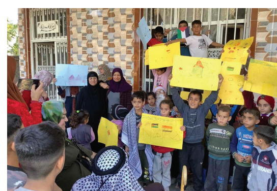
الحلة - طريق الشعب

في مناسبة حلول العام الجديد، أقامت رابطة المرأة العراقية في بابل حفلاً للأطفال، وذلك في «قرية أبو فارس» التابعة للمحافظة. تضمنت الحفل فقرات فنية وترفيهية عدة، منها رسم حر شاركت فيه مجموعة من أطفال القرية، وأنجزت رسوماً عبرت فيها عن التضامن مع أطفال غزة وهم يواجهون قصفاً وحشياً مرعباً من جانب جيش الكيان الصهيوني. وفي الختام، وزعت الرابطة هدايا على الأطفال المشاركين في الحفل.