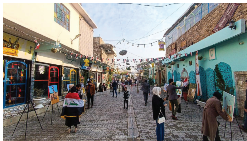
جانب من معرض تشكيلي أقامته «مؤسسة بيتنا» وسط الموصل

ثقافية في قلب المدينة المنكوبة»، مشيراً إلى أن «المؤسسة اتخذت من بيت شرقي قديم في حي الفاروق مقراً، وهو يقع تحديداً مقابل جامع النوري ومارتة الحدياء». ويذكر آل زكريا أنه في بداية التأسيس، كانت معه مجموعة من الشباب. فيما لفت إلى أن «المؤسسة تهدف إلى صون هوية الموصل التي تعرضت للاستهداف شأن بقية معالم المدينة. لكن المهمة صعبة جداً، لأننا بدأنا العمل من مكان مدمر. ورغم التحديات، استطعنا تحقيق نجاحات كثيرة». ويؤكد أنه «بعد 2003، وبسبب الأوضاع الأمنية المتردية، غابت النشاطات الثقافية عن الموصل. وفي العام 2014 انتهى كل شيء تقريباً». وتنظم المؤسسة ورشاً وندوات ثقافية وأمسيات فنية ومهرجانات وحفلات توقيع كتب، وبسبب نشاطاتها النوعية حظيت بمكانة بين المؤسسات العربية المعنية بالثقافة والتراث. كذلك تهتم المؤسسة بالأطفال. وفي هذا الصدد