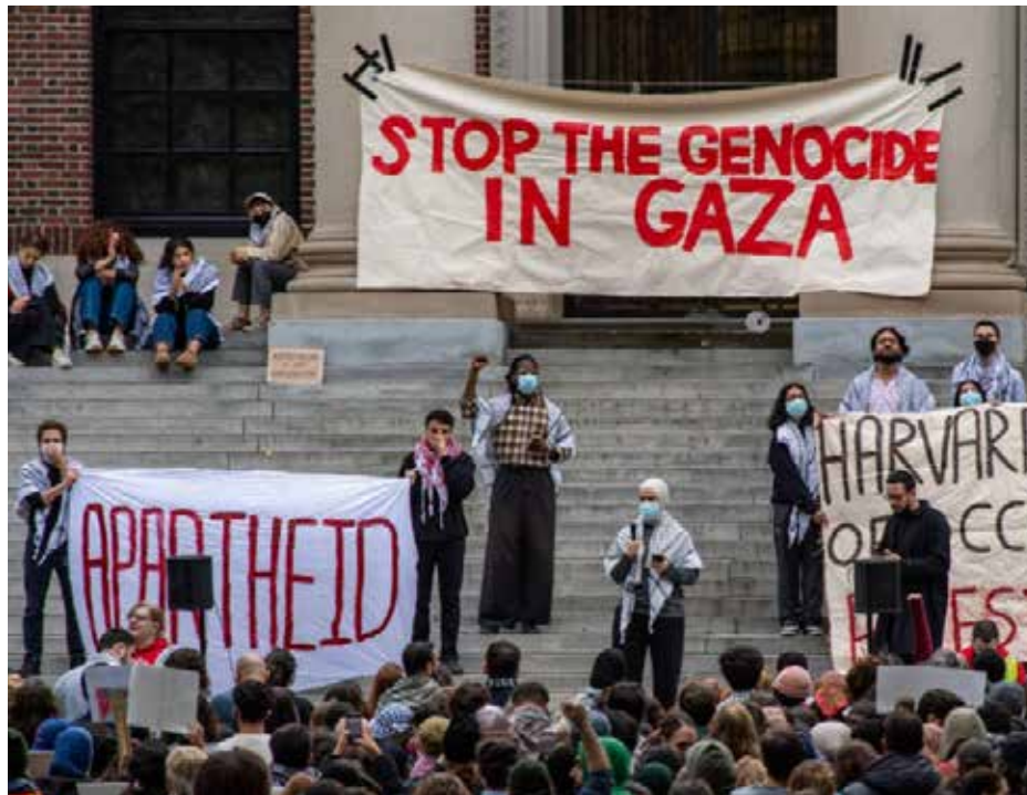
تظاهرة طلاب هارفارد تدعو الى وقف الإبادة في غزة

استطاعت العصا الإسرائيلية قمع الحريات على منصات التواصل الاجتماعي منذ بداية حرب الإبادة ضد شعب غزة. صحيح أن بعضها نجا لبعض الوقت، لكن يبدو أنها انصاعت أخيراً للمطالب الصهيونية. الجبهة الثانية التي أقلقَت كيان الاحتلال، كانت التظاهرات الشبابية في الغرب التي لم يستطع هضمها. كما لم يرق لها نزول مئات آلاف الشباب نصرته لفلسطين وتشكيلهم مجموعات في أبرز الجامعات، فما كان من العدو إلا أن سخر كل أدواته محاولاً تركيع القائمين على تلك الجامعات.