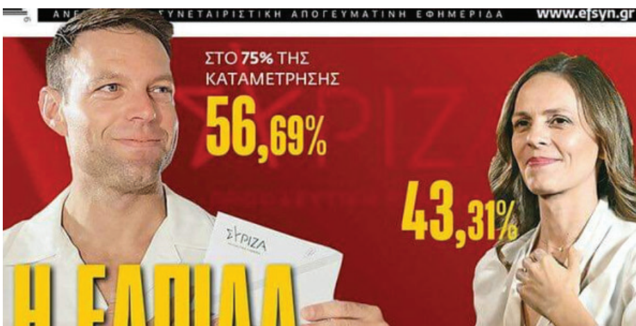
القادم الغريب لزعامة سيريزا

مثلت نتائج الانتخابات الحزبية صدمة في صفوف التيار اليساري في الحزب. ورغم دعوة العديد من أعضاء الحزب البارزين إلى الوحدة والعمل المشترك، لكن الأجواء متوترة. ويخشى العديد من اليساريين أن "الاستثناء" الأوروبي الكبير الذي مثله صعود سيريزا في تشكيل الحكومة اليونانية في السنوات الأخيرة، في ظل ظروف صعبة