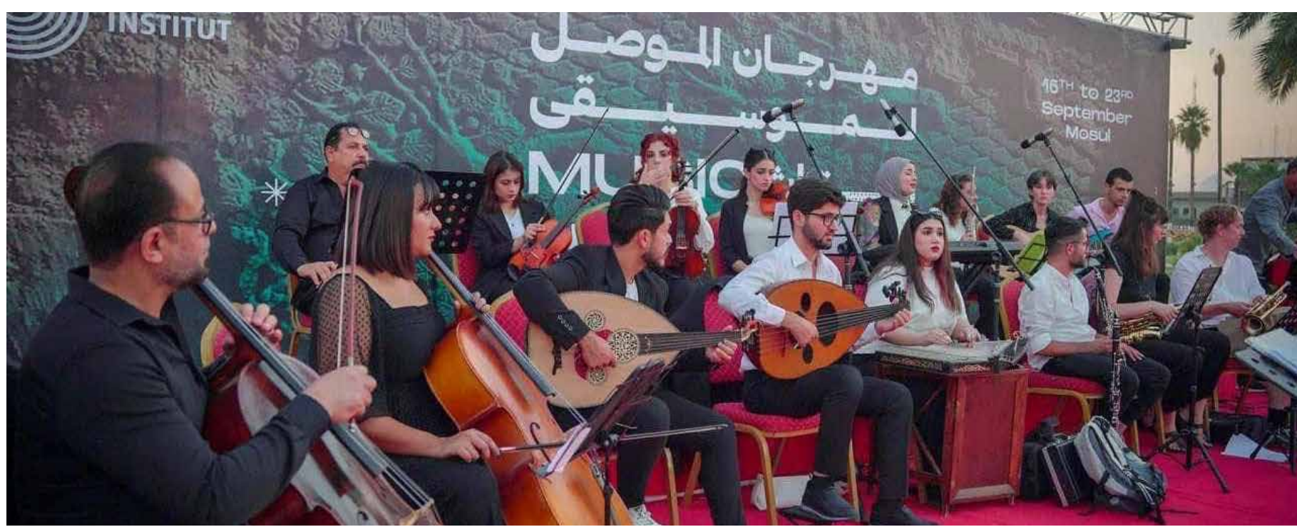
مهرجان الموصل لموسيقى التراث.. فرق موسيقية شبابية تطرب الحاضرين

وبه إلى أن استقلالية الهيئة "ليست مؤكدة بالدستور والقانون فحسب، وإنما المحكمة الاتحادية في تموز 2021 شددت على هذه الاستقلالية، وهذا التأكيد جاء بعد محاولة حكومة عادل عبد المهدي ضم المفوضية لمجلس الوزراء، ولكن المحكمة ردت هذه المحاولة". وتابع البياتي قائلاً إنه "رغم هذا كله اقدمت الحكومة من آب 2021 وحتى اليوم باتخاذ خطوات مخالفة للقانون الدولي وللدستور وقرار المحكمة الاتحادية، وعلى التدخل لتتصيب أشخاص في إدارة المفوضية بدون المرور بالأليات القانونية واحترام استقلالية المفوضية".