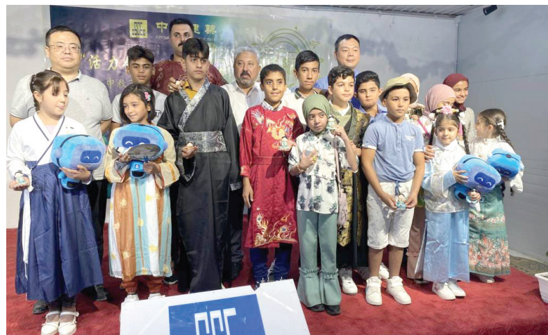
مجموعة الاطفال الناصريين بالملابس الصينية

القمر سوية ونحتفل بالمناسبة وتذكر الأقارب والأصدقاء. وأضاف ان «الصينيين يتناولون في هذا اليوم كعكة القمر ويرتدون الملابس الصينية، وفيه نجتمع مع بعضنا لنشاهد