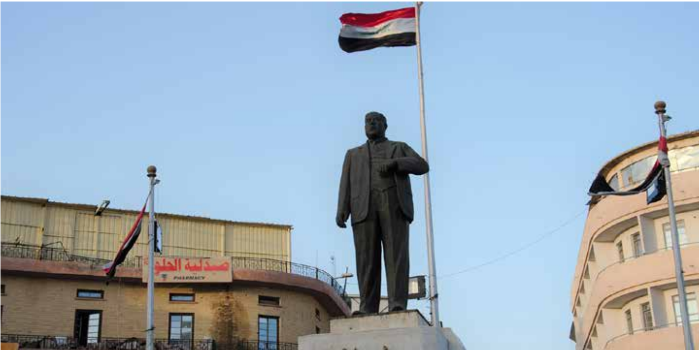
تمثال الشاعر معروف الرصافي وسط بغداد

كتوفير مبالغ وإعداد كشوفات فنية للشوارع وتعبيدها ووضع بعض الإنارة والنشرات بشكل مهرج لا علاقة لها بتاريخ البلد". ويضيف إن "المسؤول لا يزال يملك تفكيراً تقليدياً وغير مواكب لتطور وأحداث العالم، وما يزيد من سوء الوضع أن المسؤولين هم المحكمون في الأمور". ويشدد على ضرورة توفير كوادر متخصصة في مجال الصيانة لإعادة العمل النحوي إلى رونقه، لافتاً إلى أن العراق يفتقد لهذا التخصص وأن وجد فخرته لا تتماشى مع أساليب الصيانة الحديثة، مضيفاً أن "معظم عمليات الصيانة للأصاب والتماثيل «ارتجالية وغير علمية وغير مدروسة»".