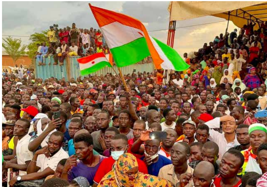
مئات الالاف في عاصمة مالي يطالبون بانسحاب القوات الفرنسية من بلادهم

في 30 آب 2023. تولى الجيش السلطة في الغابون، وجاء الانقلاب بعد إعلان نتائج الانتخابات المزورة التي استمر هوجبها حكم علي بونغو، نجل عمر بونغو، الذي حكم البلاد منذ الاستقلال بدعم من القوة الاستعمارية السابقة فرنسا. وفي النيجر، اعتقل الجنرال عبد الرحمن تياتي في