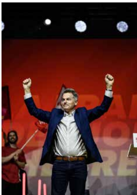
فايان روسيل متحدًا في مهرجان اللومانيته

الشخصية السياسية الأكثر شعبية بين في أوساط اليسار الفرنسي، متقدماً بفارق كبير على جان لوك ميلينشون. وبالمقابل، يتمتع روسيل بالاحترام حتى بين منافسي اليسار السياسيين. لقد تواجد في المهرجان رئيس الوزراء الفرنسي الأسبق، والمرشح اليميني المحتمل للانتخابات الرئاسية لعام 2027، إدوارد فيليب، لأجراء مناقشة مباشرة وعلنية مع السكرتير الوطني للحزب الشيوعي.