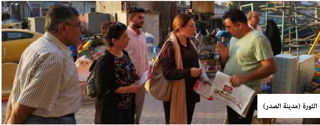
الثورة (مدينة النصر)