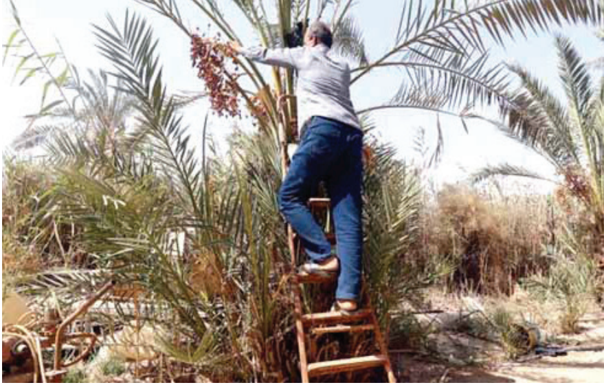
البصرة كانت تضم أكثر من 30 مليون نخلة

ويضيف قائلاً أن "مجموع المزارع الحالية في البصرة لا يتجاوز 3 آلاف مزرعة فقط، فيما خرجت بحدود 9 آلاف مزرعة عن الخدمة، بسبب الانساع الكبير في رقعة الجفاف والتصحر"، موضحاً أن "المحافظة تعتمد حالياً على استيراد المحاصيل الزراعية من إيران، بالرغم من إمكانية استثمار الأراضي الموجودة واستصلاح مساحات واسعة من أراضي غرب وجنوب البصرة، التي تحتوي على كميات كبيرة من المياه الجوفية".