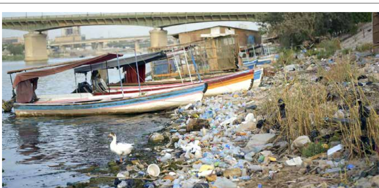
ضفاف نهر دجلة تتحول الى بركة أسنة جراء استمرار رمي الملوثات والنفايات