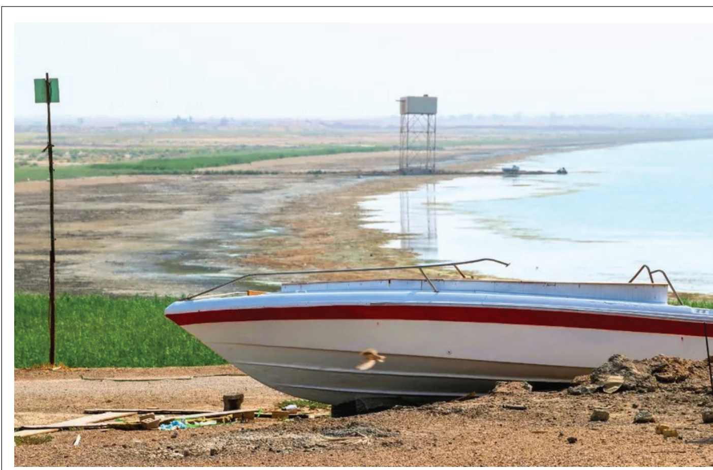
العراقيون يودعون الحباية بعدما غدت بركة راكدة 4 <<

ندرك أن الحاجة ماسة إلى اقتلاع المخدرات من جذورها، فلن نتفع كل المحاولات لملاحقة المروجين وصغار التجار، وعلى الجهات المعنية توجيه اهتمامها نحو المحرك الأساسي لهذه التجارة، والذي لا نعتقد أن الأجهزة الأمنية عاجزة عن رصد.