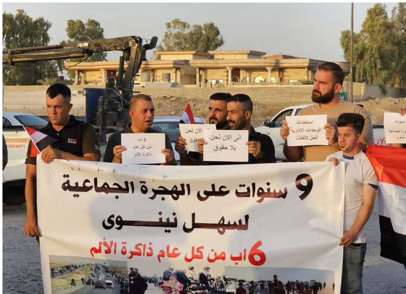
مواطنون من سهل نينوى، لم تتسلم منحة المهجرين حتى الآن