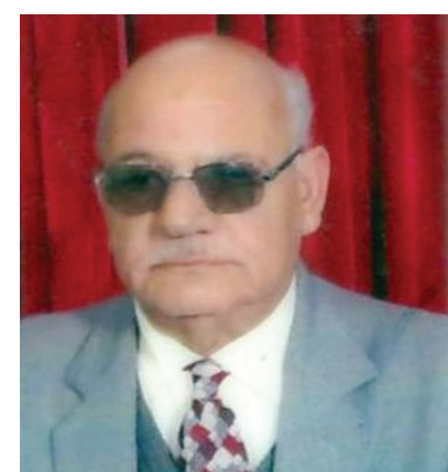
المتوسط، وبعد انقلاب 8 شباط 1963 اضطر للتخفي حتى هدأت الأوضاع، وأصبح في عام 1970 عضواً في لجنة الشبيبة الديمقراطية، ثم أعيد ترشيحه واكتسب

ولد الفقيدي سنة 1945 في ناحية المدحتبة وأكمل دراسته الابتدائية والمتوسطة فيها والإعدادية في الحلة لعدم وجود ثانوية في الناحية، ثم التحق بكلية الشريعة وأنسحب منها بسبب وضعه الاقتصادي، ودخل الدورة التربوية، وبعد إكمالها عين معلماً في المدارس الابتدائية وظل يعمل في المدارس الرفيعة حتى عام 1991 حيث نقل لمدرسة غزة الابتدائية في الحلة، وأحيل على التقاعد بسبب المضايقات التي تعرض لها، وبعد سقوط النظام أعيد لوظيفته وأحيل على التقاعد بعد بلوغه السن القانوني.