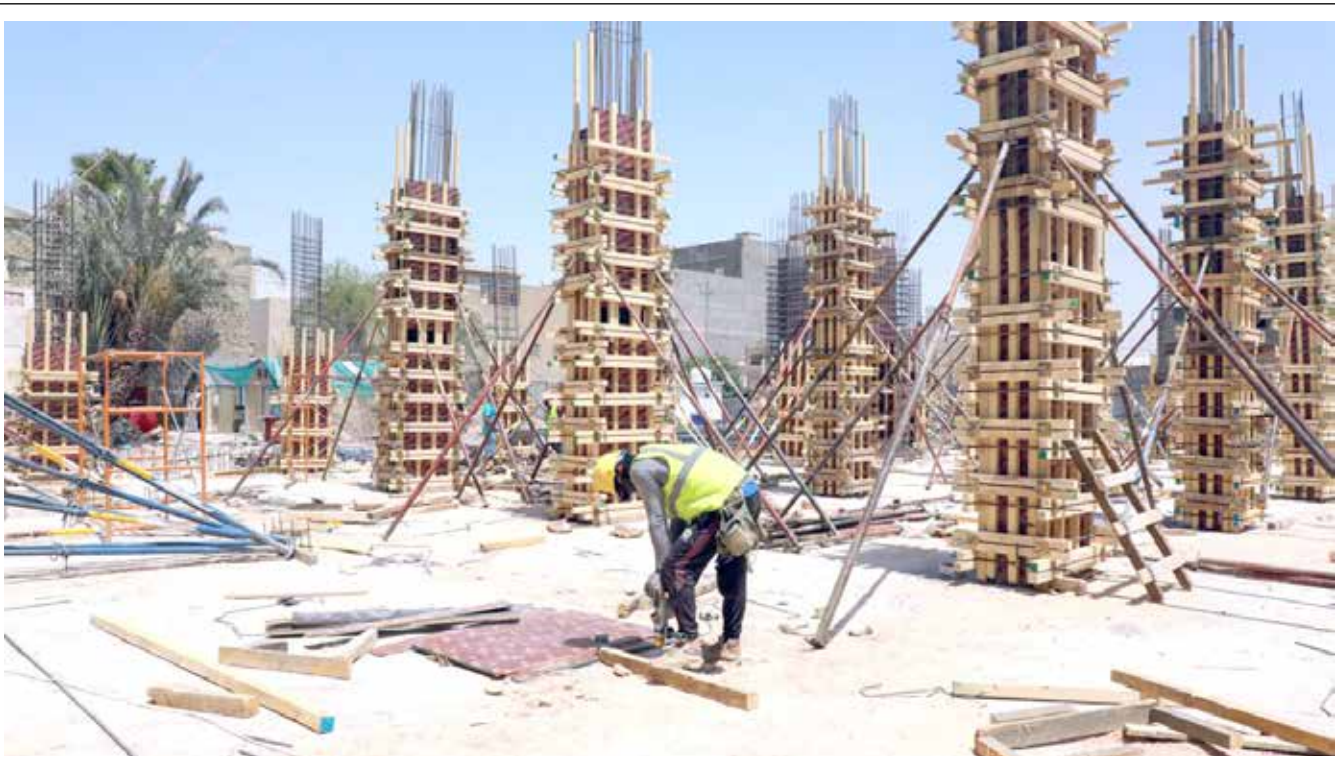
ويرتفع بنیان بیت الشیوعیین بیت العراییین.. والحزب یجدد أمله بالمزید من سخاء الداعمین والمبتدعین