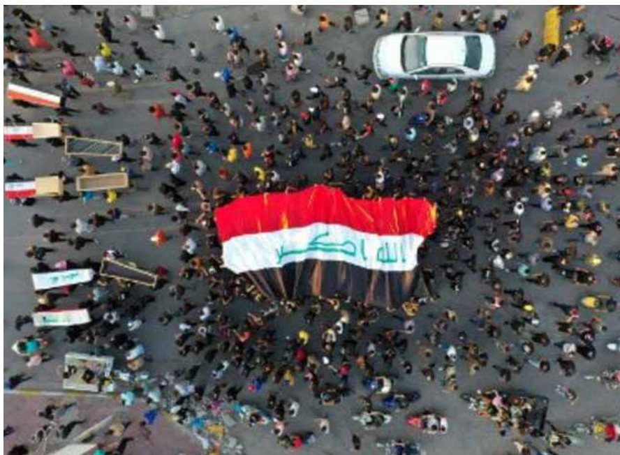
من احتجاجات ميسان ابان انتفاضة تشرين 2019

وخلص موجهاً دعوته الى مفوضية الانتخابات لان "تأخذ دورها بجديّة ومسؤولية عالية، لضمان نجاح الانتخابات بدون اخفاقات، وان تتحرر من ضغوط القوى المنتهزة في السلطة، وان تتعاطى مع جميع القوى المشاركة في الانتخابات بشكل متساو".