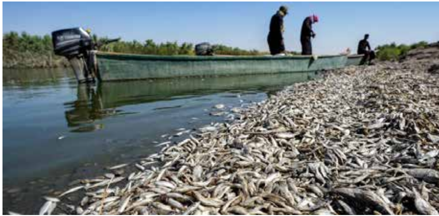
فوق ملايين الأسماك سنويا بفعل انخفاض مستويات المياه وارتفاع ملوحتها

ويلفت كردي إلى أن "بحيرات الأسماك ساهمت في امتصاص البطالة وإنعاش حركة المطاعم وتجارة الأعلاف. وحقت مردودات مالية كبيرة لصالح الاقتصاد المحلي".