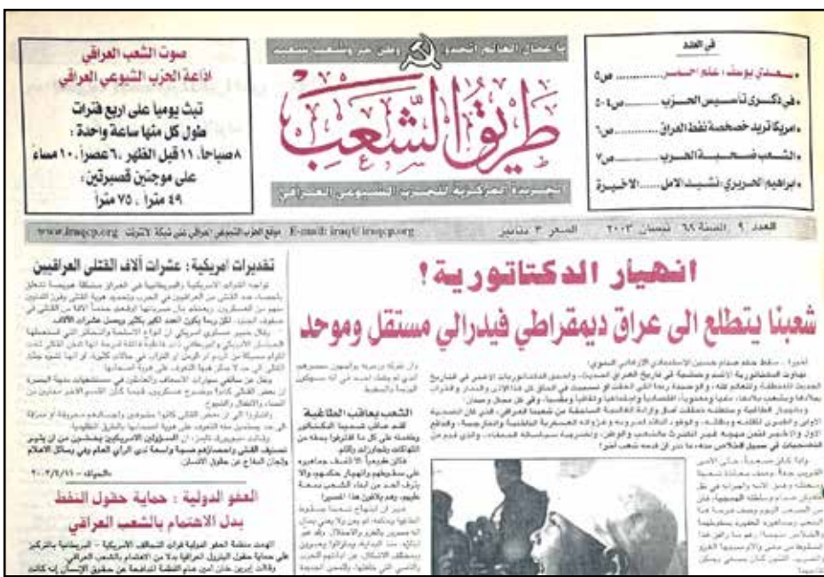
"طريق الشعب" أول مطبوع صحفي يوزع في بغداد بعد التغيير «6-7»