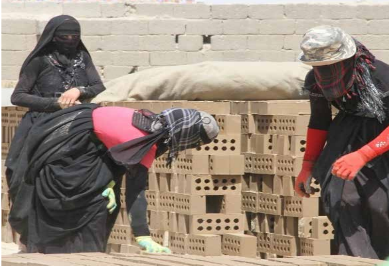
عاملات الطابوق.. شقاء ومخاطر بلا ضمانات!