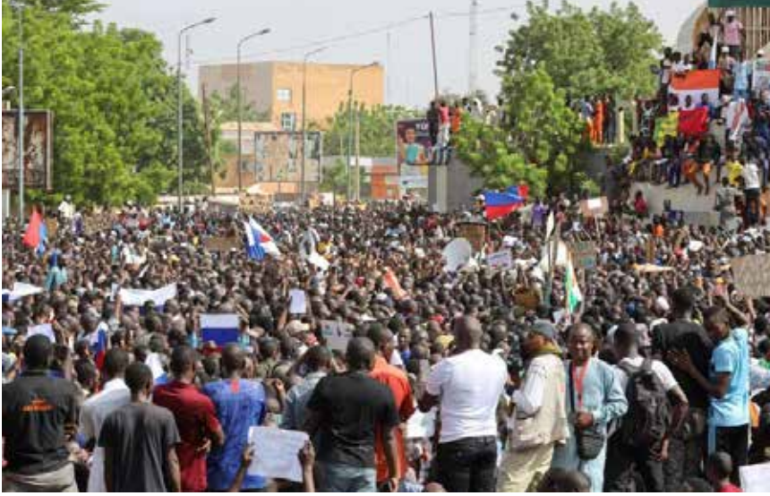
المتظاهرون المؤيدون للعسكر في النيجر هتفوا بسقوط فرنسا ورفعوا أعلام روسيا

ووفق المراقبين، فإن استقرار النيجر وموقعها الجغرافي، يساعدان الجيش الفرنسي على مراقبة الحدود مع ليبيا، ومكافحة الهجرة غير الشرعية. حماية قاعدة المسيرات الأمريكية وينبع قلق الولايات المتحدة من أنه في حال نجاح الانقلاب ستصبح النيجر الدولة الـ11 في سلسلة الدول الأفريقية، التي تشهد نفوذاً روسياً عبر مجموعة "فاغتر"، بعد استمالة بوركينا فاسو العام الماضي. وكذلك تخشى واشنطن على قاعدة الطائرات المسيرة التي أسستها في وسط الصحراء في مدينة أجاديز في شمالي النيجر عام 2014، في إطار عمليات مكافحة إرهاب الجماعات المسلحة في شمالي أفريقيا. وبحسب تقرير لـ"الغارديان البريطانية" فإن الولايات المتحدة أنفقت نحو 500 مليون دولار منذ عام 2012 لمساعدة النيجر على تعزيز أمنها. وليست مستعدة لخسارتها جراء الانقلاب العسكري الأخير وأعلنت فوراً أنها لا تعترف بقيادة الانقلاب.