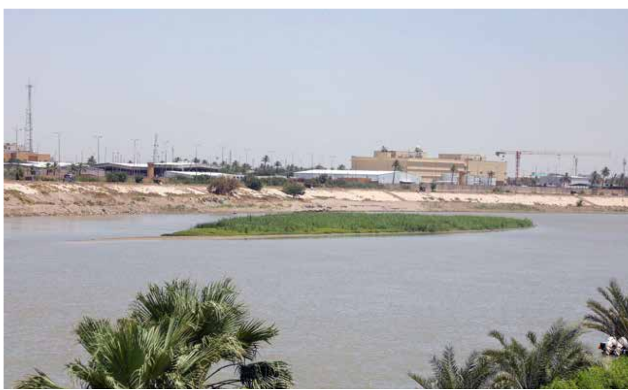
تعاطم خطر شح المياه بسبب السياسات المائية المحجفة لدول المنع تجاه العراق &lt;&lt; 3 زين يوسف

مراسل «طريق الشعب» في جانب الرصافة، أكد أن