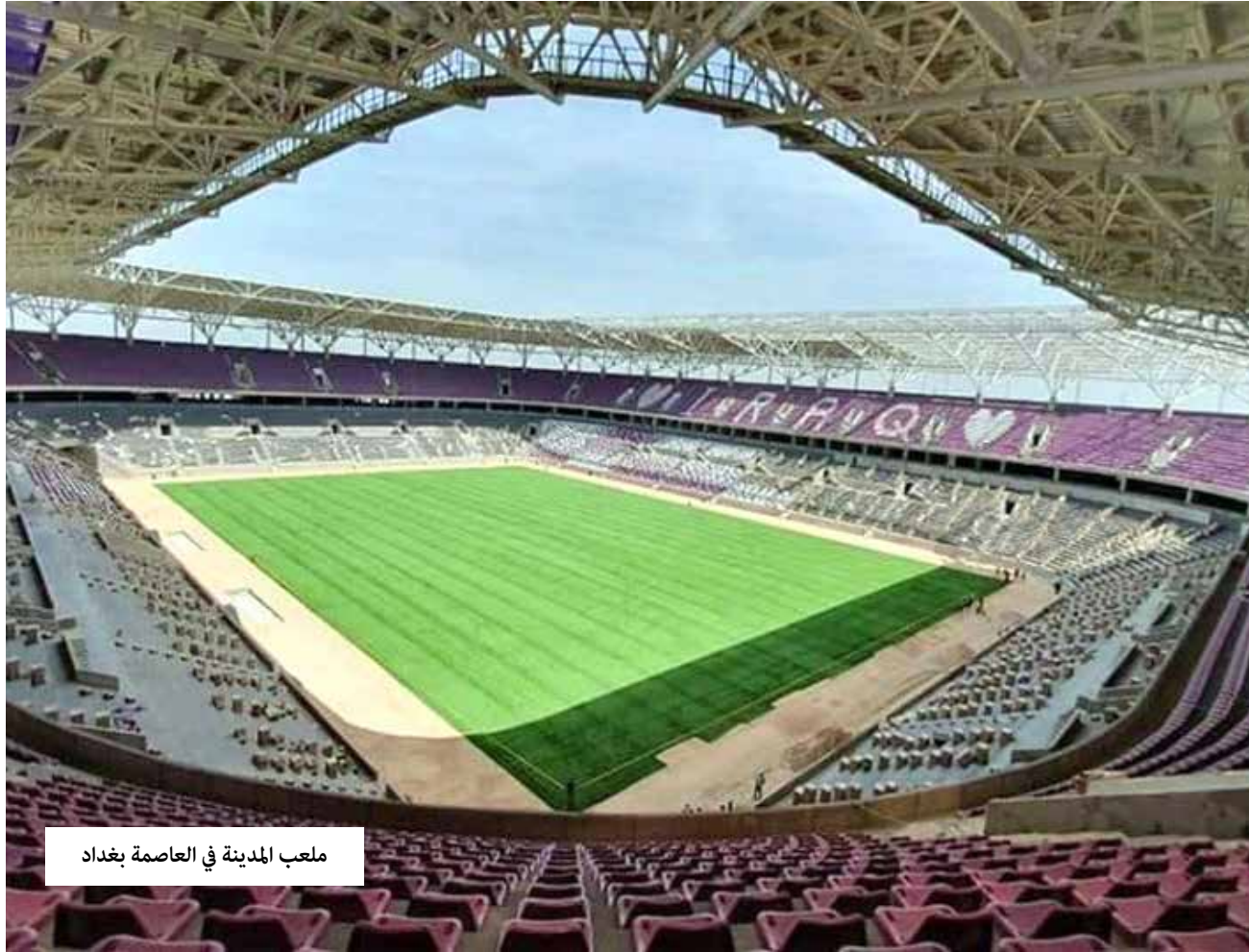
ملعب المدينة في العاصمة بغداد

يلتقي اليوم الثلاثاء، المنتخبان العراقي والبراني في مباراة ختام بطولة غرب آسيا للمنتخبات الاولمبية دون سن 23 عامًا التي جرت في بغداد وكربلاء، وستقام المباراة على ملعب المدينة في العاصمة بغداد.