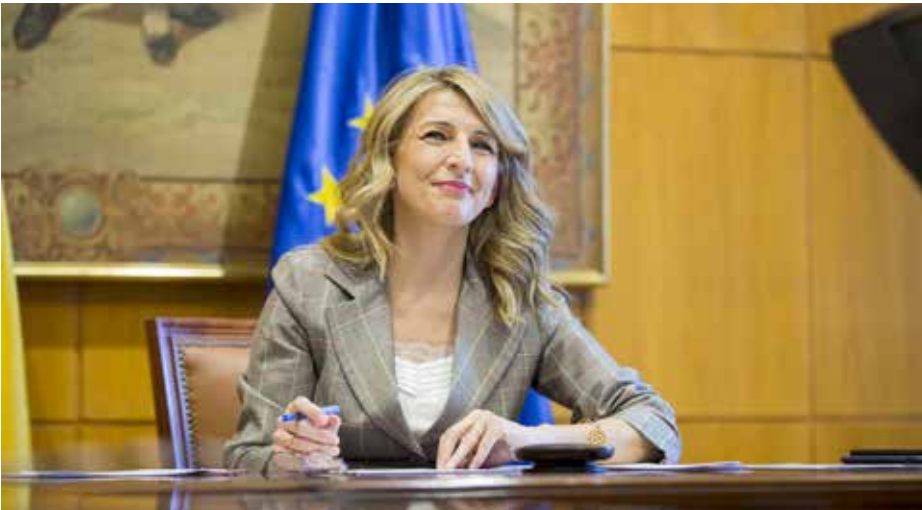
يولندا دياز زعيمة حالف اليسار الاسباني

كانت إحدى تفاصيل المفاوضات التوزيع الدقيق لتسلسل المرشحين في كل محافظة، وسيتم مراعاة المقاعد التي تم الفوز بها في عام 2019. ستتصدر يولندا دياز قائمة مدريد، في حين تحتل السكرتيرة العامة لحزب بودوموس الموقع الخامس في قائمة العاصمة. وسيكون لبودوموس 15 مقعدا، تمتلك منها 9 فرصة الوصول للبرلمان. وسيكون للييسار المتحد 17 مقعدا. ومنحت القوائم المحلية، المواقع الأولى في