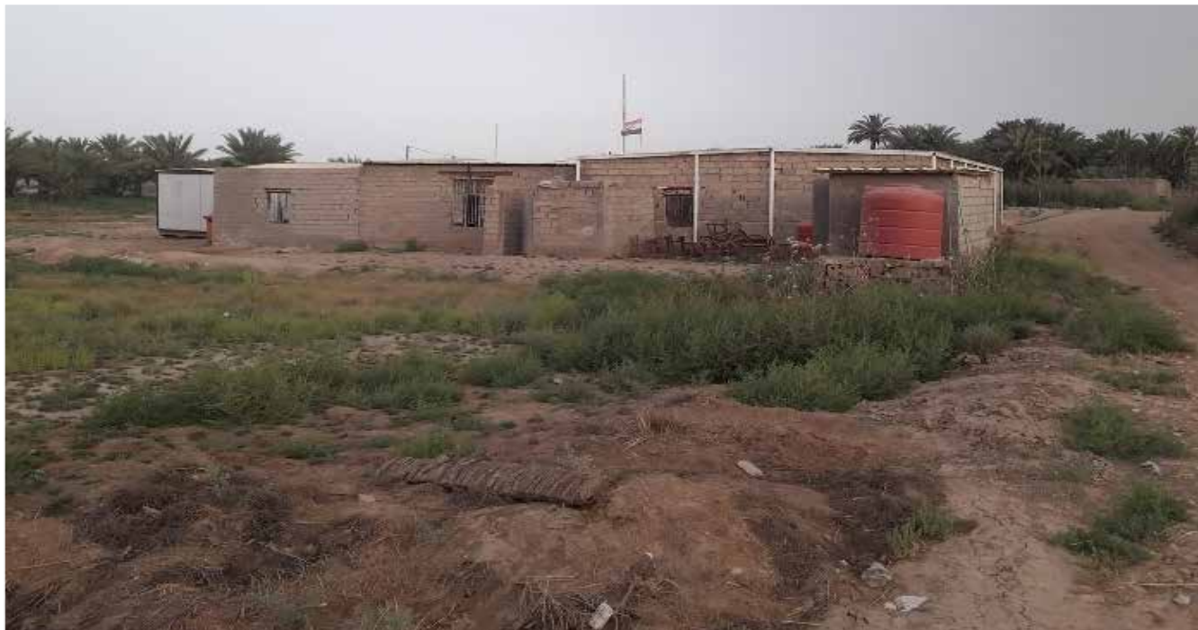
من يصدق إن هذا المبنى البائس هو «مدرسة اقرأ» الابتدائية في عفك!

بشراء مياه الشرب بسعر 11 ألف دينار للسيارة الحوضية الواحدة. مصانع مغلقة وتوجد في عفك ثلاثة مصانع؛ واحد للإسفلت وآخر للطابوق وثالث للنسيج. وحسب الغالبية فإن هذه المصانع مغلقة، الأمر الذي زاد من نسب البطالة بين الشباب والخريجين، حتى اضطر الكثيرون منهم إلى الهجرة لمحافظة أخرى بحثاً عن فرص عمل. الشكوى ممنوعة وفيما يلفت الغالبية إلى أن «القضاء ليس فيه شارع نموذجي واحد، ويخلو من مدينة ألعاب، ومتنزهاته التابعة إلى البلدية مهدمة ومتهاككة»، ينه إلى أن «الأهالي يتجنبون الحديث عن معاناتهم والمطالبة بحقوقهم، خوفاً من رفع دعاوى ضدهم، إذ إن عفك ليس محروماً من الخدمات فقط، إنما حتى من الشكوى. ووصل الحال بالمواطنين إلى درجة الخوف من كتابة منشورات على مواقع التواصل، ينتقدون فيها الواقع الخدمي، بسبب تكميم الأقوال»!