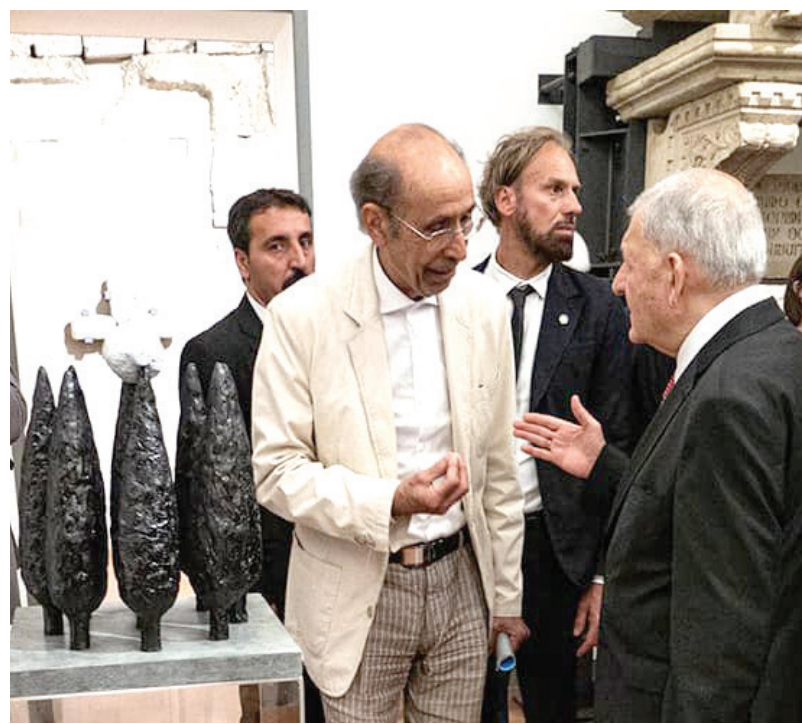
رئيس الجمهورية يتحدث الى الفنان رسمي الخفاجي

وكان المعرض المشترك «ضفتان» قد أقيم أول مرة قبل سنتين في مدينة أمستردام الهولندية، ثم نقل إلى أكثر من مدينة أوروبية أخرى حتى افتتح أخيراً في بولونيا الإيطالية. ويتطلع الفنانون الثلاثة إلى الانتقال به بعد ذلك إلى مدينتي أربيل والسليمانية، وليختتموا المشروع في بغداد، وذلك بالتعاون مع وزارة الثقافة وجمعية الفنانين التشكيليين العراقيين، ومع وزارة الثقافة والجهات الفنية الأخرى في إقليم كردستان.