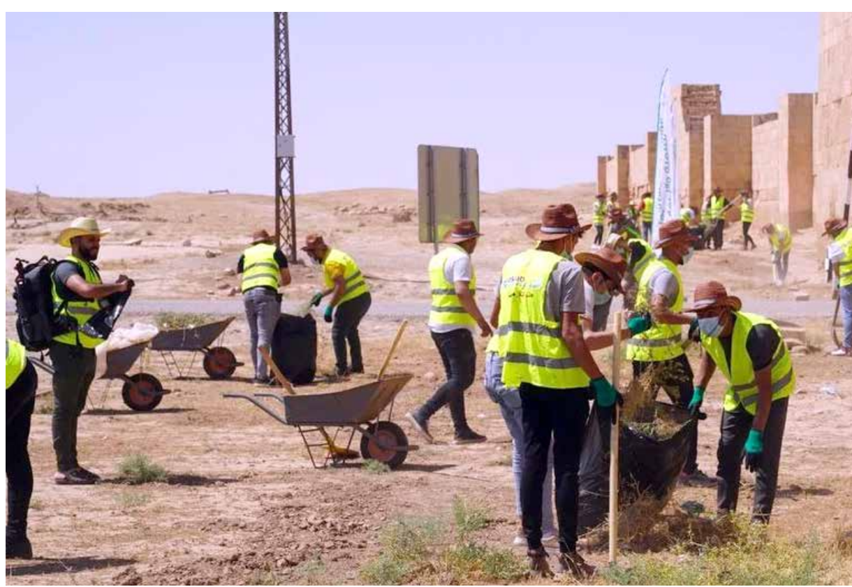
حملة شبابية في الموصل لتنظيف مملكة الحضرة التاريخية