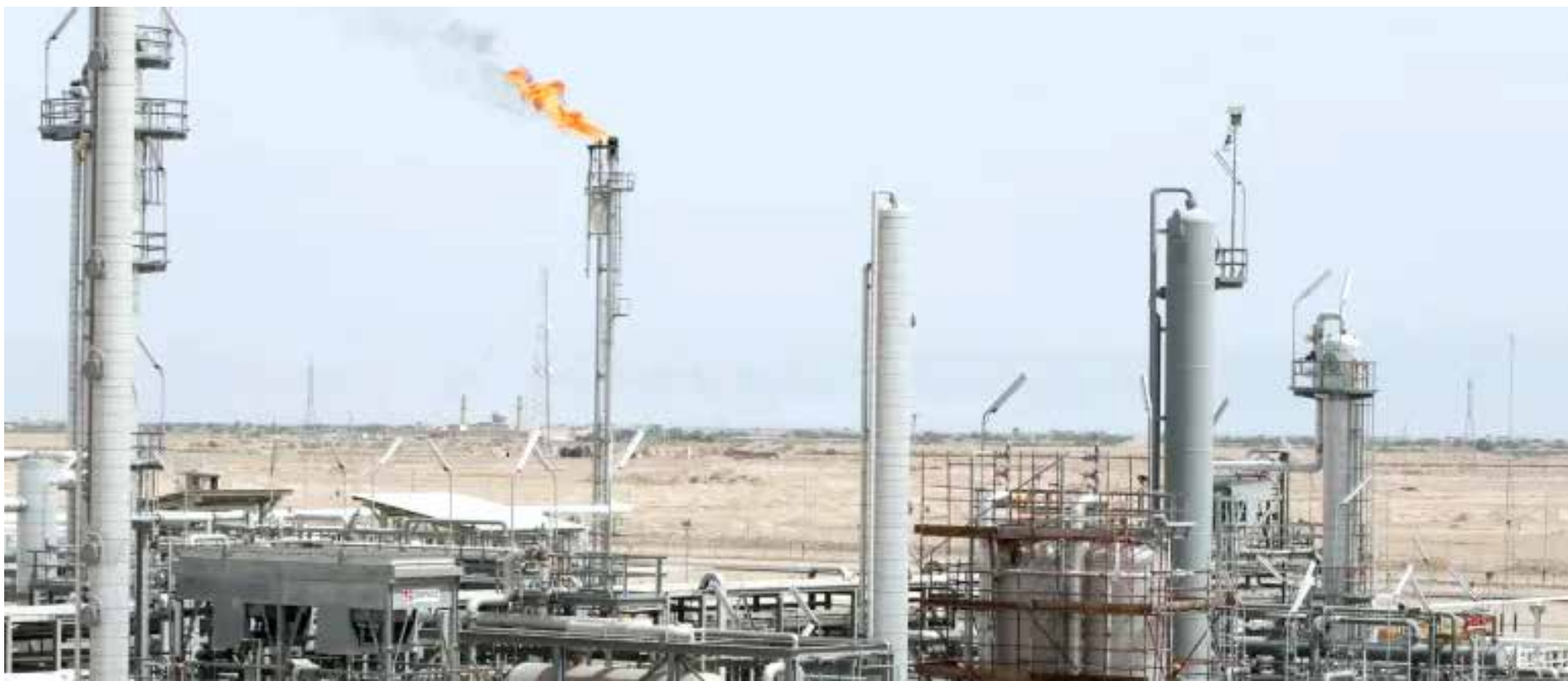
شركة غاز الجنوب