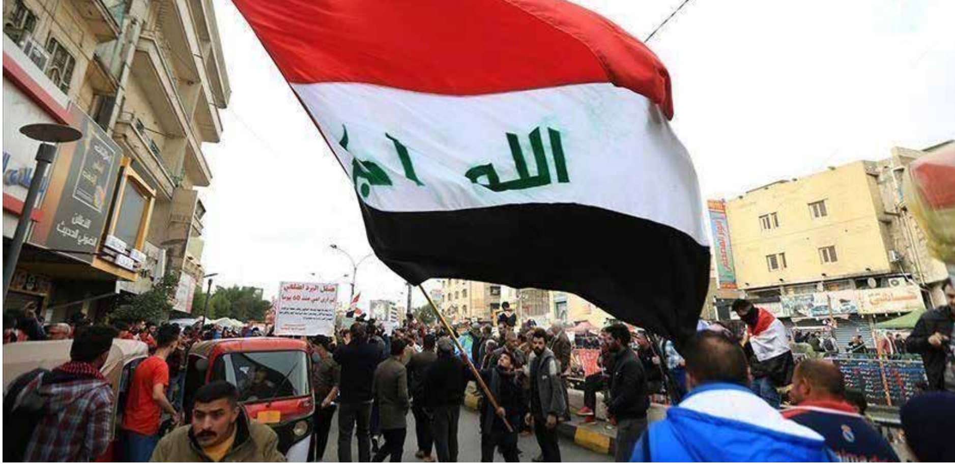
من تظاهرة سابقة في المحافظة احتجاجاً على تردي الخدمات