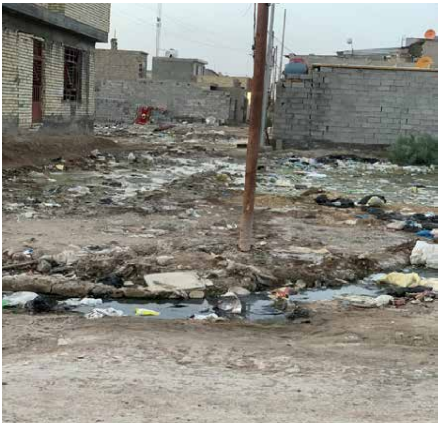
هذه البيئة الغاصة بالتلوث في منطقة بوب الشام شمالي بغداد لا شبكة مجار، لا خدمات نظافة ولا تبليط!