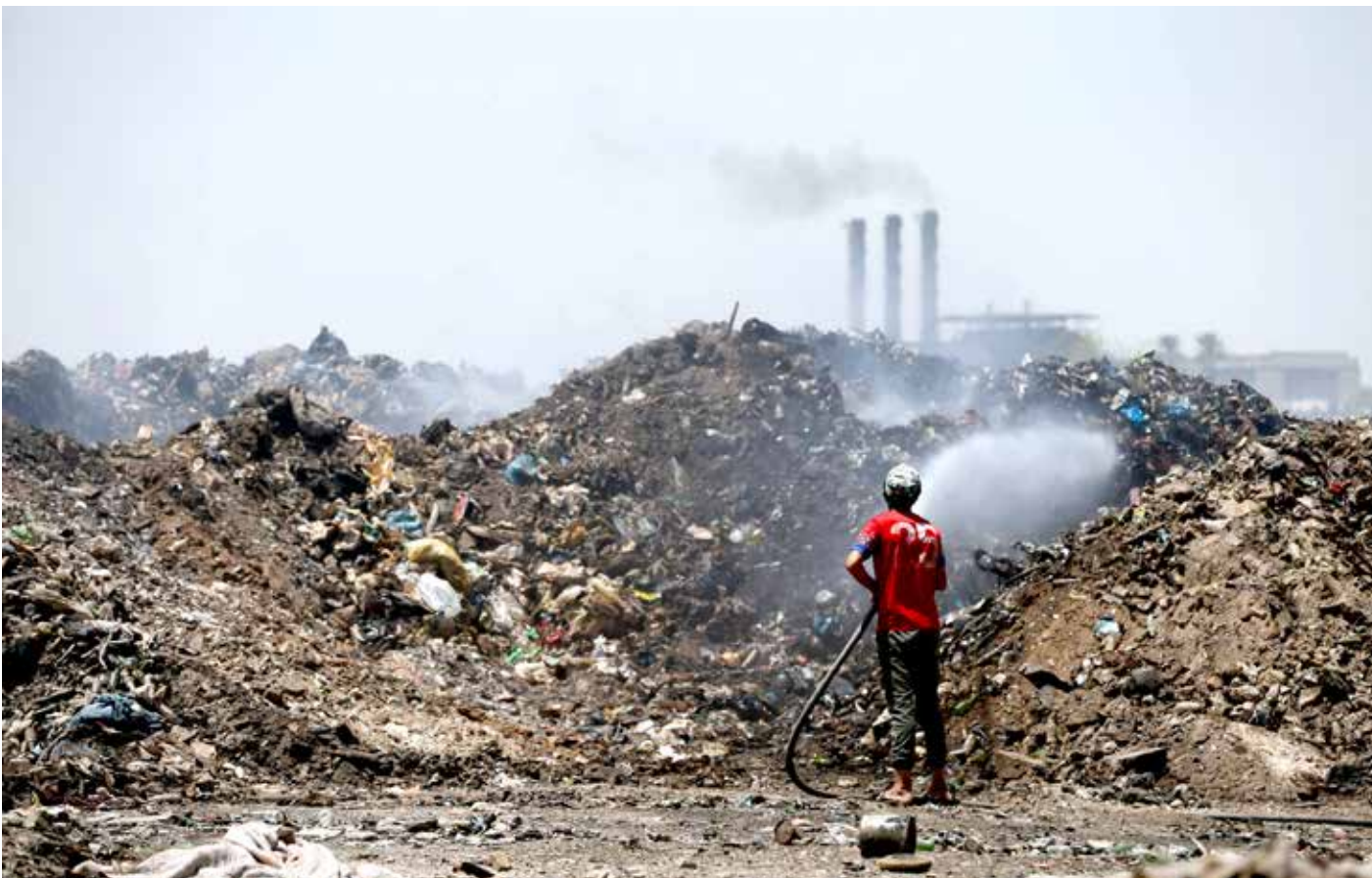
مصانع تدوير النفايات