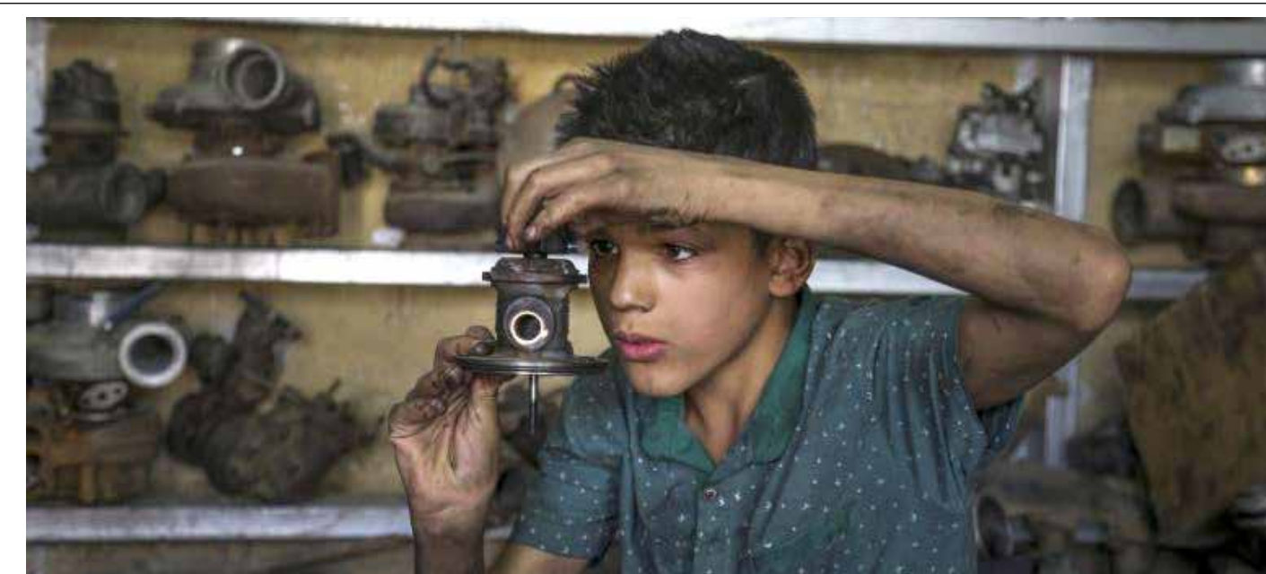
اطفال العراق خارج المدارس لإعالة عوائلهم!

منسق التيار الديمقراطي: نسعى لمشاركة وطنية فاعلة في الانتخابات المقبلة << 3