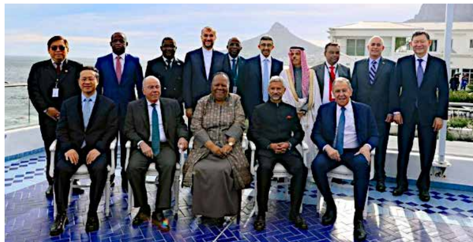
وزراء خارجية بريكس والضيوف

عكس اجتماع وزراء الخارجية من جديد ان روسيا غير معزولة في بلدان جنوب العالم. على هامش اجتماع وزراء خارجية المجموعة، عقد وزير الخارجية الروسي لافروف اجتماعا ثنائيا مع نظيره البرازيلي، تركز على الجهود التي تبذلها البرازيل للتوصل لحل سلمي للحرب في أوكرانيا. وكان الرئيس البرازيلي قد دعا في مناسبات عدة إلى إنهاء العداء بين روسيا وأوكرانيا. واقترح تشكيل مجموعة دولية