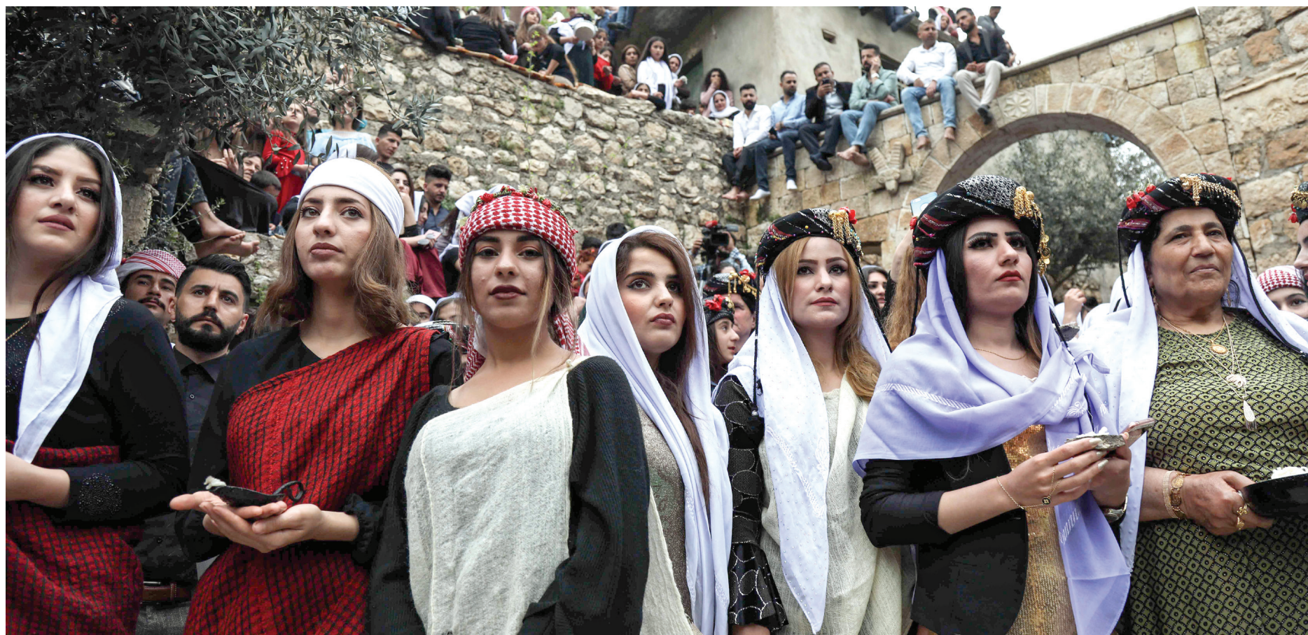
من احتفالات الإيزيديين في معبد لالش في نينوى