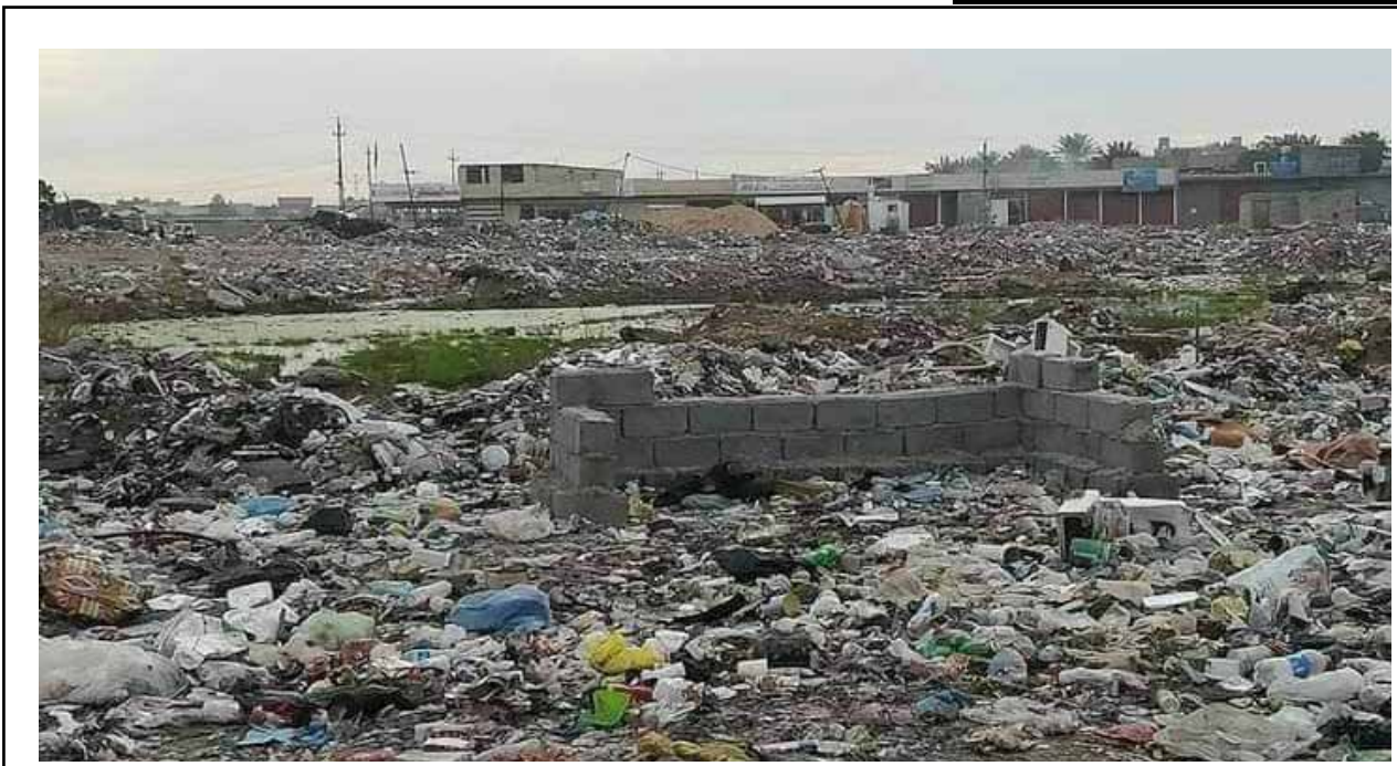
قريباً من مقبرة النفايات هذه، منازل سكنية ومحال تجارية.. انها المحلة 444 (منطقة الرواد) في مدينة الشعلة ببغداد!