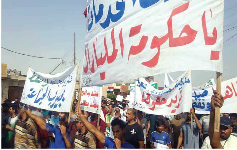
تظاهرة سابقة في ابو الخصب مطالبة بالخدمات

واطلعت «طريق الشعب» على بعض المشاريع التي رصدت فيها تلكؤات وفساداً منذ مطلع العام الجاري، حيث رصدت هيئة النزاهة الاتحادية تلكؤاً في مشروع، ومخالفات في تأجير عقار دون قيمته الحقيقية في محافظة البصرة، كلفته (16,000,000,000) دينار، اضافة الى ضبط عقد مشروع حواجز إعلانية تجارية لمطلوبات بطولة خليجي (20) بعد توقف العمل في المشروع، الذي بلغت نسبة إنجازه حتى الآن 49 في المائة والذي انتفت الحاجة إليه بعد انتهاء البطولة، وكلفته (8,170,000,000) دينار في ديوان محافظة البصرة - قسم الحسابات. وتم ضبط أوليات عقار يقع في المركز التجاري في منطقة العشار لوجود مخالفات إدارية ومالية رافقت تأجيرها، وإنشاء مشيدات واستغلالها كمحلات تجارية. كما رصد تلكؤ في مشروع إنشاء صالات عمليات في مستشفى الفحاء العام الذي حُصص له مبلغ قدره (3,773,082,000) دينار، إضافة الى رصد مخالفات في عقد أبرمته جامعة البصرة لإنشاء مطعم ومسبح وقاعة مناسبات على أرض تبلغ مساحتها (250,000) متراً مربعاً تابعة للجامعة، حيث أبرم العقد من قبل رئيس الجامعة وليس من قبل وزير التعليم العالي والبحث العلمي.