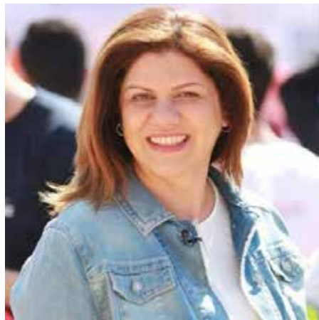
طبيعة ودموية هذا الاحتلال، فيما أكدت هبة جنازتها على رسالة أخرى، وهي أن القدس فلسطينية وستبقى كذلك إلى الأبد.

يسمّي باموق البداية أو يعتبرها (الورقة الأولى) وهذه لا تكون بالضرورة في الاستهلال.