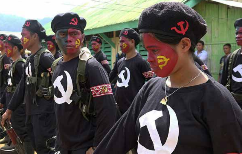
مقاتلون شيوعيون (ماتاناو، 19 نيسان 2017)

ما عكسته حركة لاهوت التحرير في أمريكا اللاتينية. لقد شهدت الفلبين نسخة أصلية مزدهرة حقًا من لاهوت التحرير في سبعينات وثمانينات القرن العشرين، حتى قام الفاتيكان بقضيمها في مهدها، وعلى الرغم من أن البابا الحالي فرنسيس قد أحياها بطريقته الفريدة كما يبدو. لكن الأشكال المحافظة والرجعية للطائفة التي أسسها الإنجيليون الأمريكيون بمباركة من وكالة المخابرات المركزية والبنطاغون خلال عهد كوري أكيونوس (-1986) في أعقاب إرهاب الجبهة الديمقراطية الوطنية يمكن أن تشكل مشكلة للمسيحيين الناشطين في حركة التحرير الوطني.