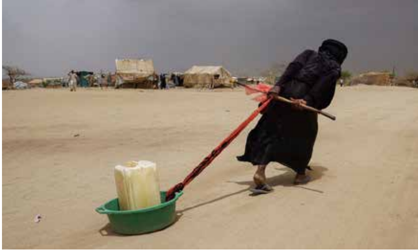
شح المياه من أبرز مظاهر التغير المناخي

وفقاً لتقرير صادر عن معهد بروكينغز، يمكن أن تتطلب الطرق التقليدية لإنتاج الكهرباء من الطاقة الشمسية، مساحة أكبر بـ 10 مرات على الأقل لكل وحدة طاقة منتجة من المحطات التي تعمل بالفحم أو بالغاز الطبيعي. وهذا يترك مساحة أقل للزراعة، وقد تجعل المزارعين يترددون في تركيبها في حقولهم.