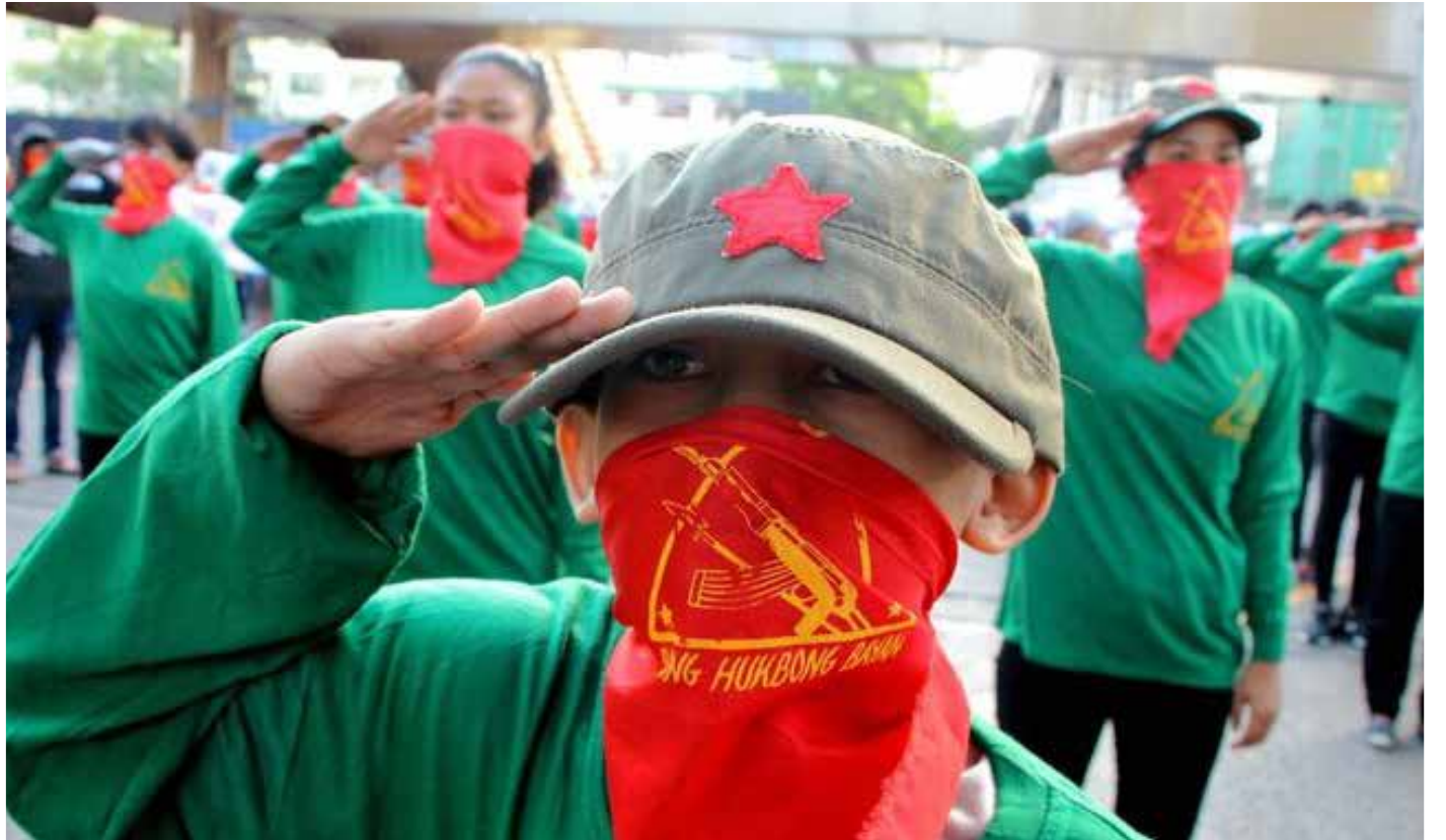
الاحتفال بالعيد 48 لتأسيس الحزب الشيوعي الفلبيني (كوزون، 27 نيسان 2017)

باستثناء فيتنام ولاوس وكمبوديا، اخفت الأحزاب الشيوعية التي كانت قوية في جنوب شرق اسيا، كإندونيسيا وماليزيا وتايلاند، أو تم تحجيمها. لا تزال