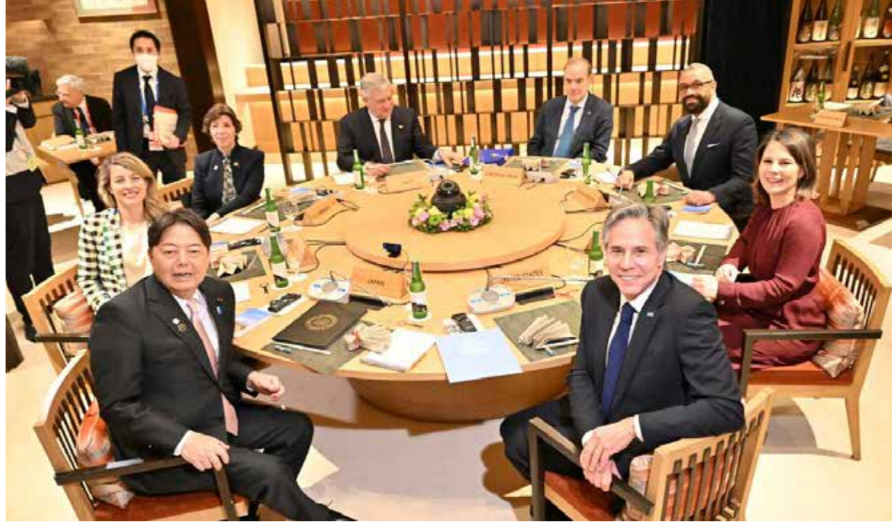
في طوكيو عقد اجتماع وزراء خارجية دول مجموعة السبع

لقد غير القصف الذري لهيروشيما وناغازاكي التوازنات الجيوستراتيجية بشكل لا مثيل له، وجعل الولايات المتحدة في وضع فريد. وطن مخطوط الحرب النووية الأمريكية ان باستطاعتهم تدمير الاتحاد السوفيتي وازالته من خريطة العالم السياسية مرة واحدة والى الابد، وهو ما لم يتحقق لهم. وليس هناك من يصدق ان الولايات المتحدة قادرة اليوم على تحقيق هيمنتها المطلقة على العالم بوسائلها القديمة. ولا تأتي جديد إذا قلنا ان الصين وليس روسيا هي الهدف من توظيف الحرب في أوكرانيا، والإصرار على تصديدها. وفي هذا السياق جاء اختيار مكان انعقاد القمة. وقد مارست حكومة بايدن ضغوطاً هائلة على جيران الصين، لتكوين تحالف إقليمي مضاد لها. والظاهر أن المهمة نجحت، على الأقل في حالة اليابان وكوريا الجنوبية، ولكن أيضاً في حالة الدول التابعة الأكثر استعداداً مثل أستراليا، التي يراد تطويرها لتصبح مستقبلا قوة نووية. ويبدو أن رئيس الوزراء الياباني كيشيدا ونظيره الكوري الجنوبي يون سوك يول قد قبلا بمغامرة القيام بمهمة انتحارية. وفي وقت سابق لعقد القمة، أعلنت إدارة بايدن عن خطط لنشر غواصات نووية وحاملات طائرة بي 52 في كوريا