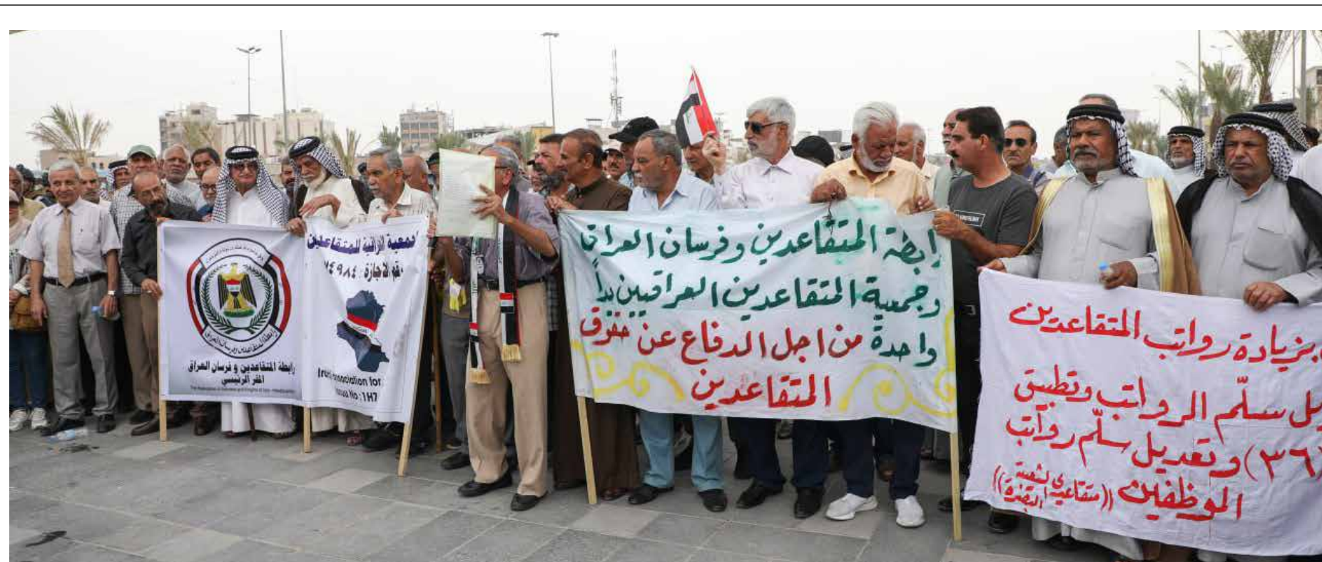
المتقاعدون من ساحة التحرير: زيادة رواتبنا حق مشروع وليس منة من الحكومة