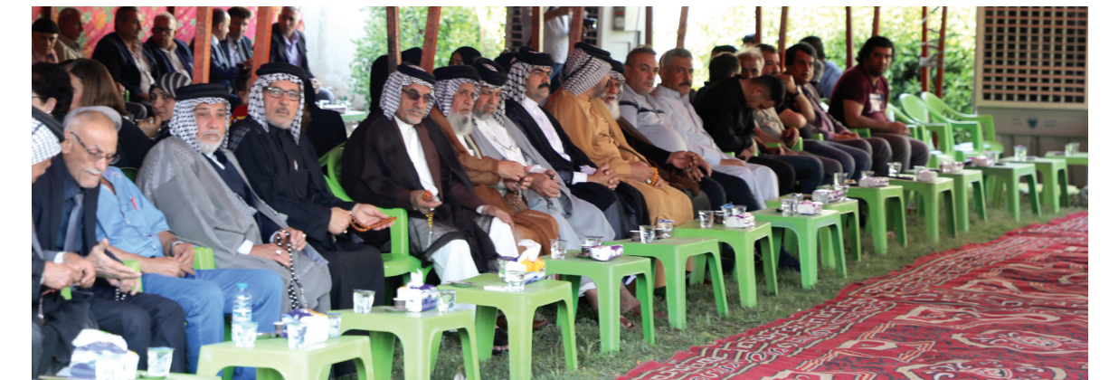
جانب من مجلس العزاء في بغداد