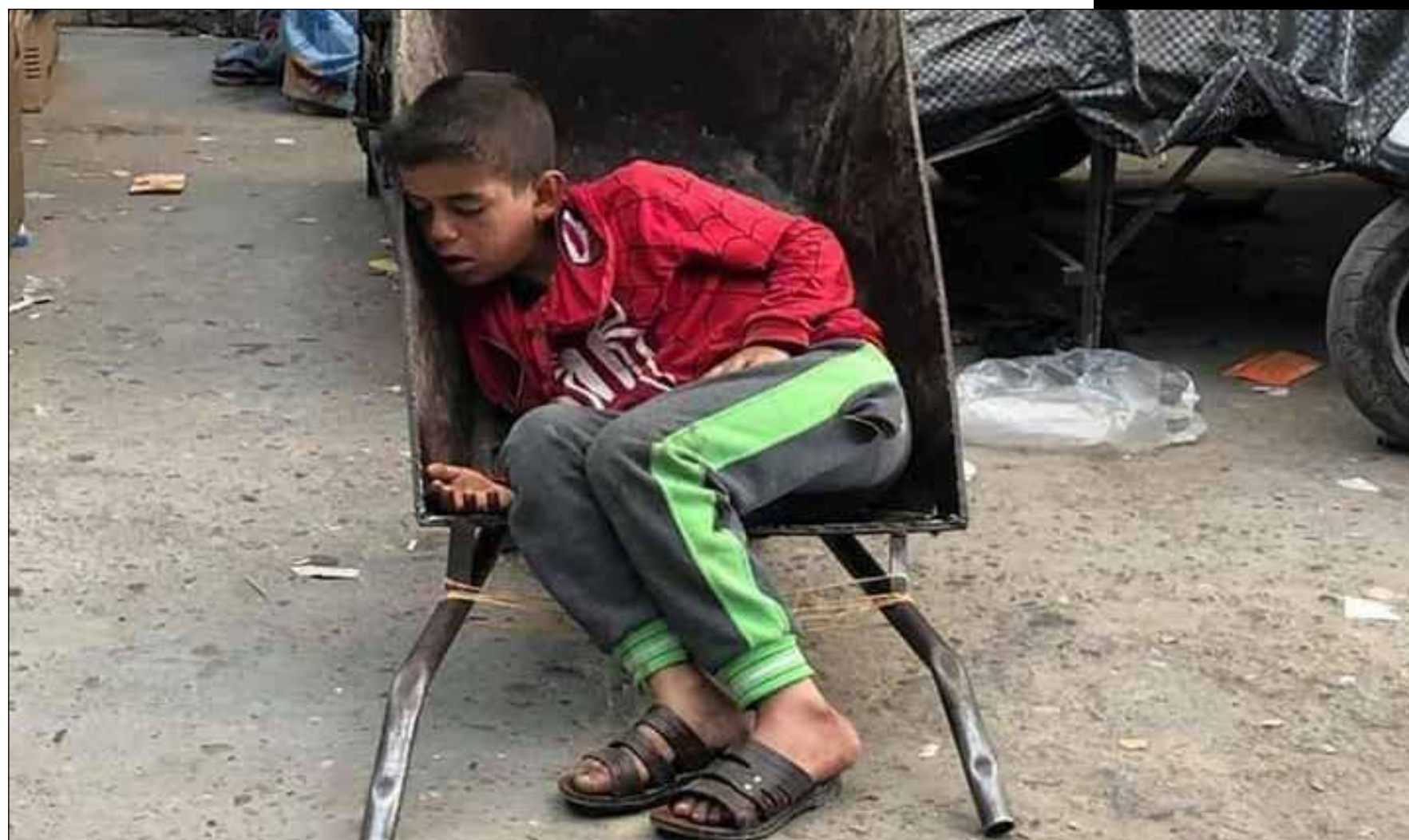
سوق العمل يقتل الطفولة في وضح النهار!

محكمة الأحوال الشخصية في الطوز العدد 252/ش/2023 التاريخ 11/5/2023