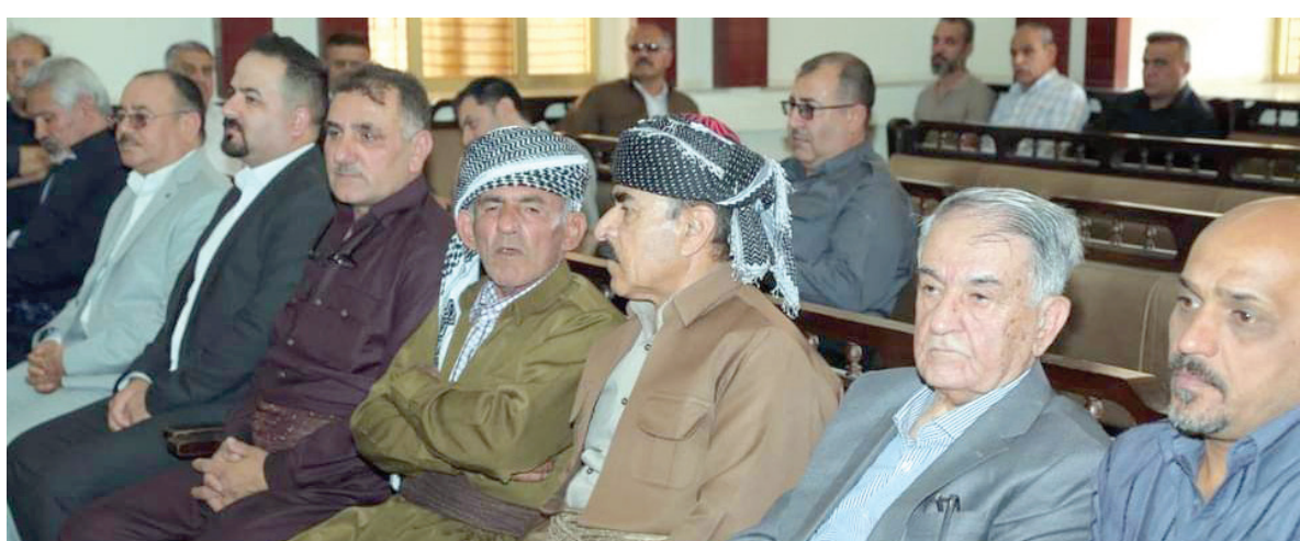
جانب من مجلس العزاء في اربيل