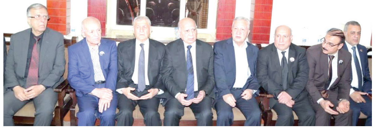
عبد اللطيف رشيد رئيس الجمهورية وفؤاد حسين وزير الخارجية يشاركان في مجلس العزاء باربييل