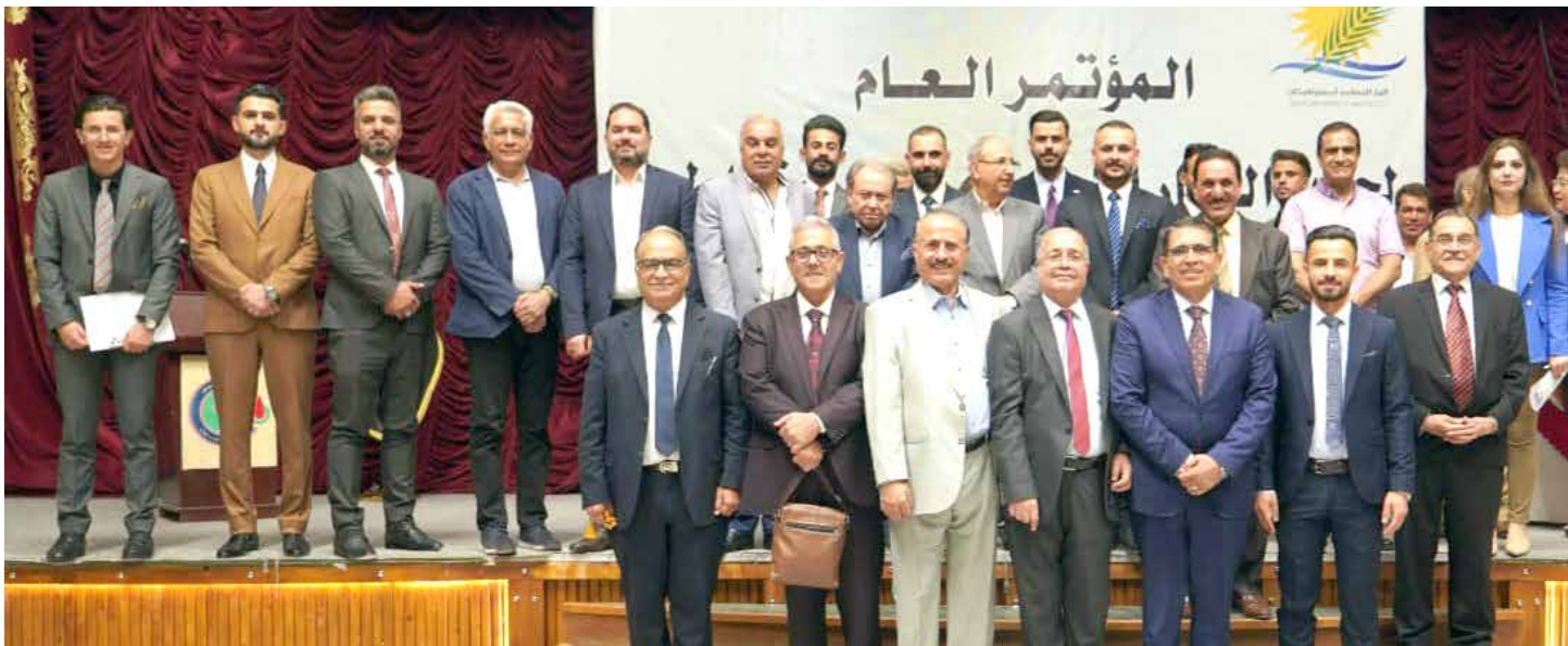
الامانة العامة للحزب الاجتماعي الديمقراطي