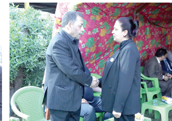
الشاعر حمزة الحلفي