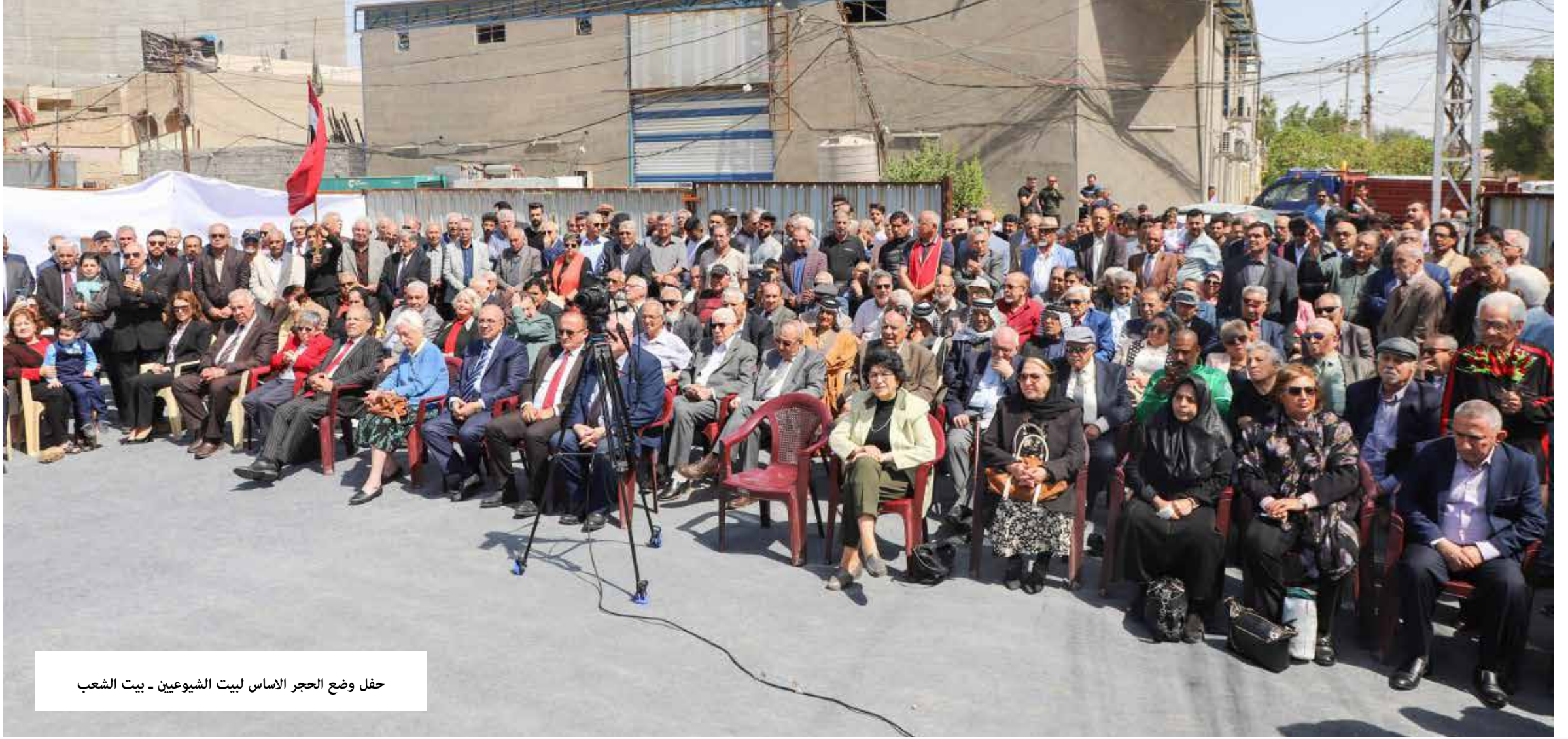
حفلة وضع الحجر الاساس لبيت الشيوعيين - بيت الشعب

فما السر إذن في هذه المعجزة التي ينبغي التوقف عندها طويلاً والتفكير في محتواها الوطني الأصيل؟ لم يكن مسعى الحزب في بناء بيت للشيوعيين والعراقيين كافة مجرد مواد بناء وأيد عاملة تشيد مقراً مستحقاً لبيت المناضلين الحقيقيين الذين بذلوا الغالي والنفيس وقدموا خيرة مريدتهم وقادتهم قراين تلو القراين من أجل المبادئ النبيلة، إنما كان الفداء والإصرار عليه أبعد من ذلك بكثير، فعاصرنا ونحن صبية صغار وشباب