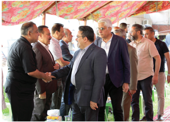
وفد كبير من الابداء والمثقفين