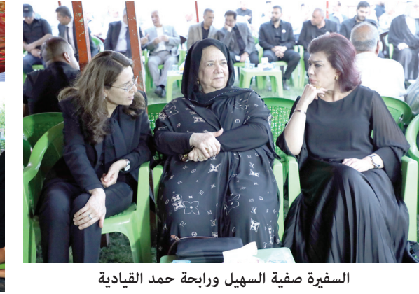
السفيرة صفية السهيل ورايحة حمد القيادة في الاتحاد الوطني الكردستاني