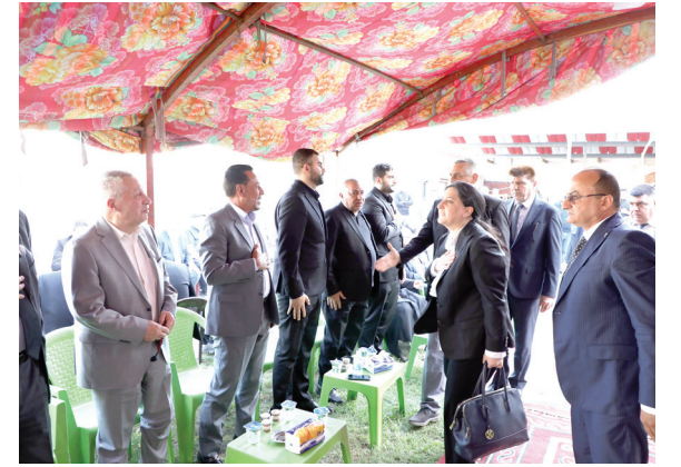
وفد الحزب الديمقراطي الكردستاني