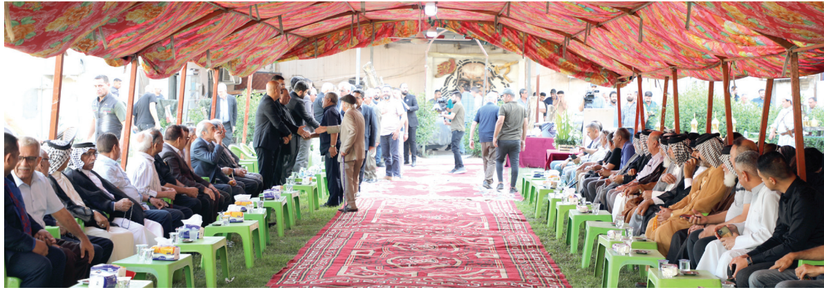
شيوخ عشائر ومثقفون وشخصيات اكااديمية في سرداق العزاء