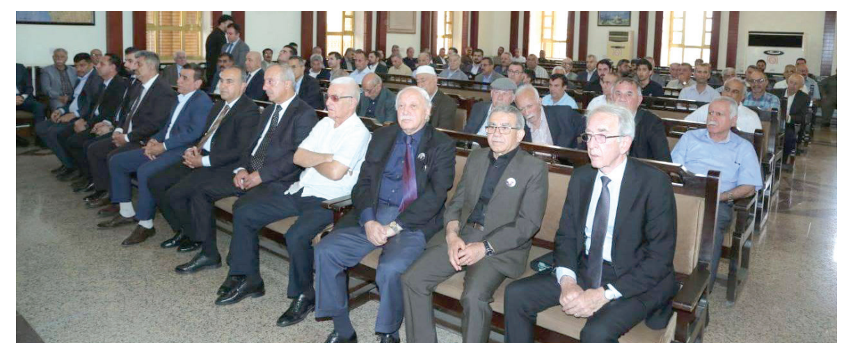
جانب من مجلس العزاء في اربيل