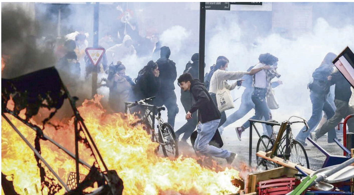
رسالة واضحة إلى قصر الإليزيه

الأزمة السياسية باتت الآن واضحة. أعيد انتخاب إيمانويل ماكرون، لأن غالبية الفرنسيين أرادوا عدم انتخاب زعيمة اليمين المتطرف مارين لوبان. ولم يستطع ماكرون الحصول على أغلبية في الجمعية الوطنية في الانتخابات البرلمانية الأخيرة. كان يعتقد أن بإمكانه الاعتماد على اليمين التقليدي (الجمهوريون) لتحقيق أغلبية. لكن خيط الدعم أصبح رقيقاً جداً. والوضع الآن غير مستقر بشكل دائم. تحاول مارين لوبان التأثير من الأبواب الخلفية. لذلك تقع على عاتق اليسار مسؤولية كبيرة في تقديم بديل حكومي والنزوح بأغلبية تشريعية في حال حل البرلمان. والحزب الشيوعي يعمل بنشاط لتحقيق ذلك. ويطلق حملة لتنظيم استفتاء عام على القانون قيد الصراع.