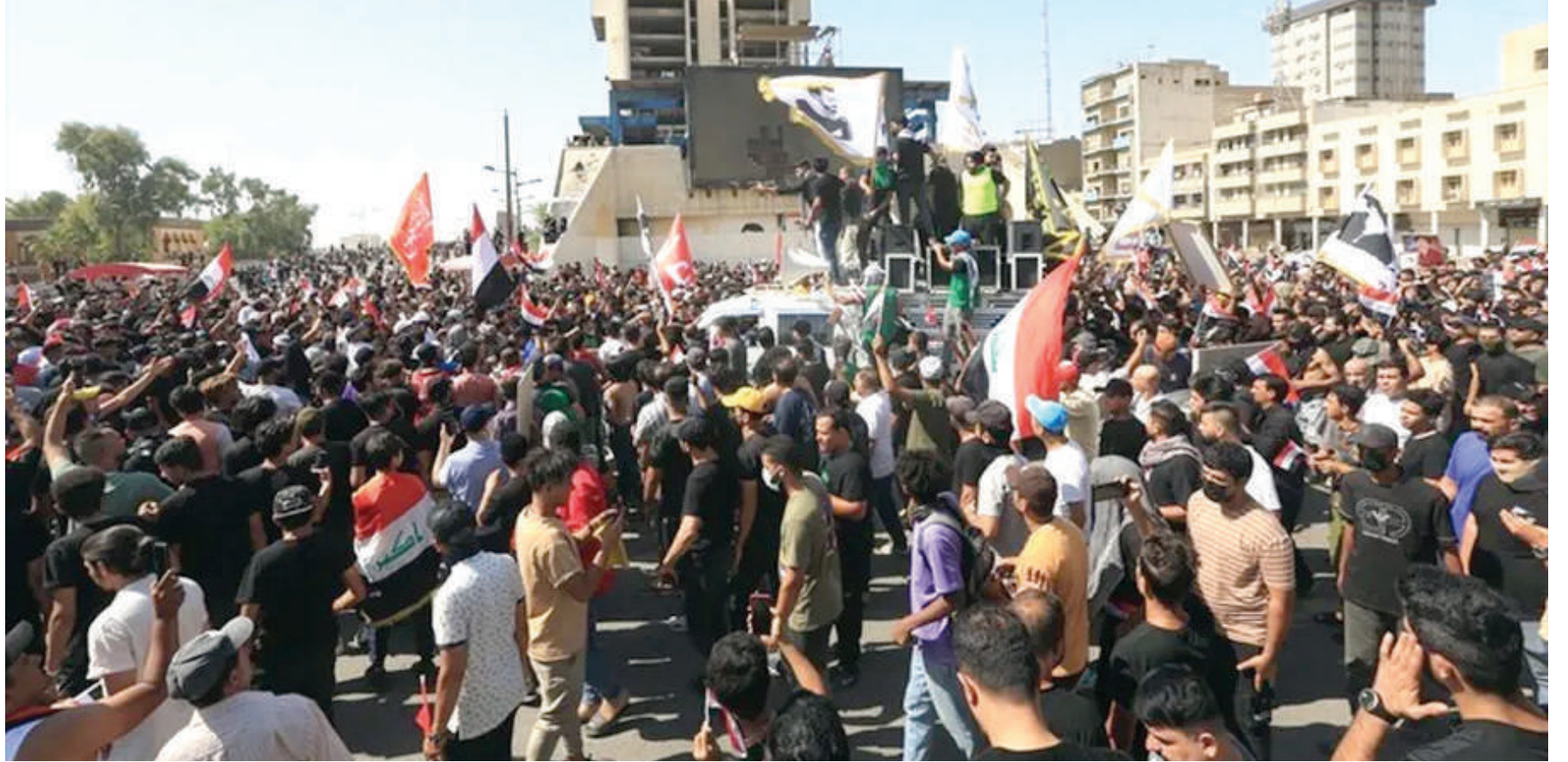
بغداد. طريق الشعب

صادف يوم الجمعة الماضي، اليوم الدولي للحق في معرفة الحقيقة، فيما يتعلق بالانتهاكات الجسيمة لحقوق الإنسان.