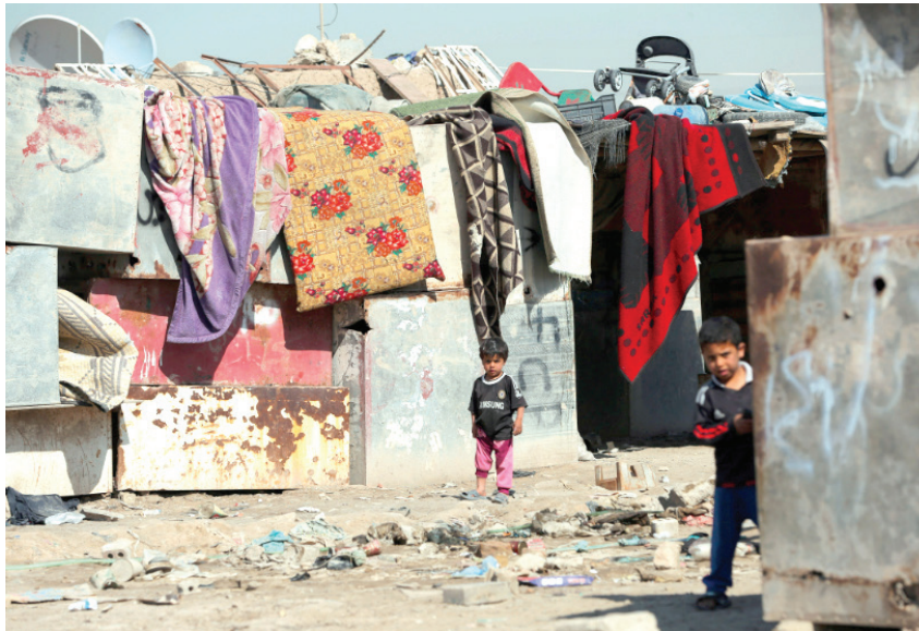
"بيوت التنك" مأوى الفقراء والمعديين

وفي منتصف كانون الثاني الماضي، أطلق رئيس الوزراء محمد شياع السوداني حملة وصفت بـ"الكبرى" للبحث الاجتماعي الميداني، بمشاركة ألفي باحث من هيئة الحماية الاجتماعية في وزارة العمل، تستهدف مليوناً و746 ألفاً و86 عائلة تقدّمت بطلبات إلكترونية لشمولها بمخصصات الإعانة الاجتماعية.