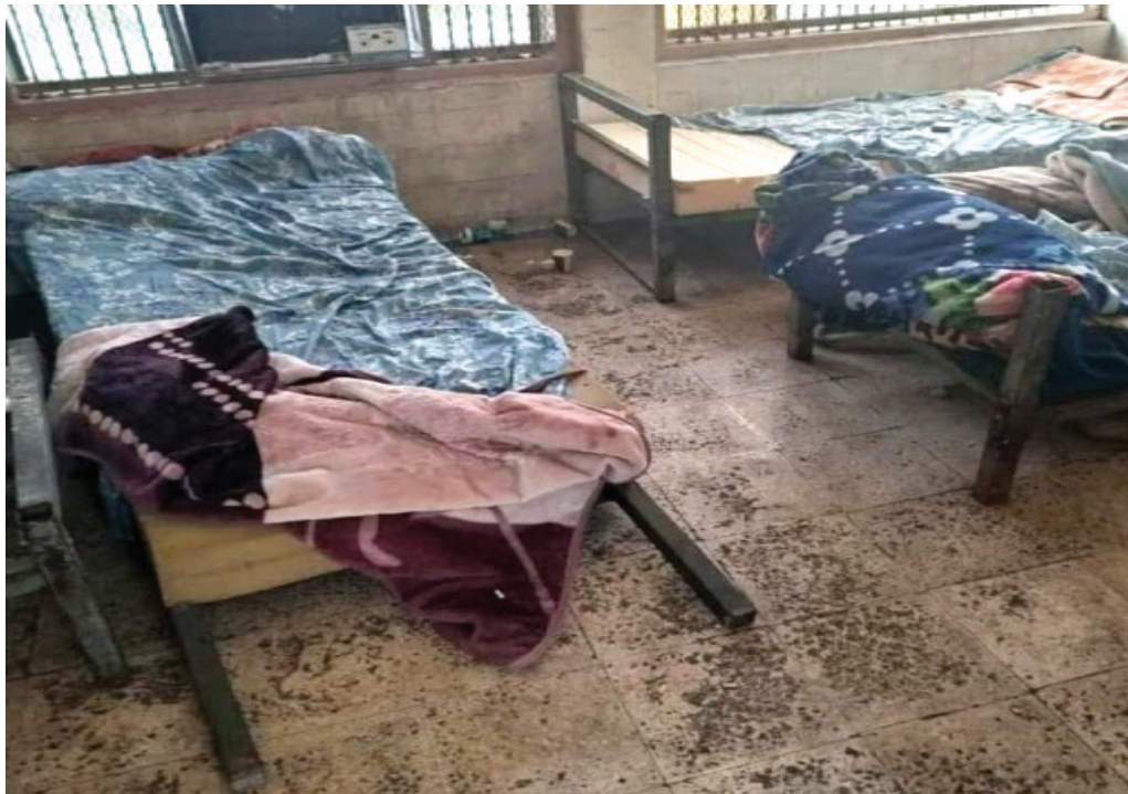
في مثل هذه الغرف يعيش «نزلاء» مستشفى الرشاد

وأكد في حديث صحفي، أن "مديرية المرور توجه بشكل يومي، عبر النداء المركزي، بالتعامل مع الحالات الإنسانية والاستثنائية بشكل خالص"، لافتاً إلى أن "غالبية الغرامات تصب في صالح مستخدمي الطريق".