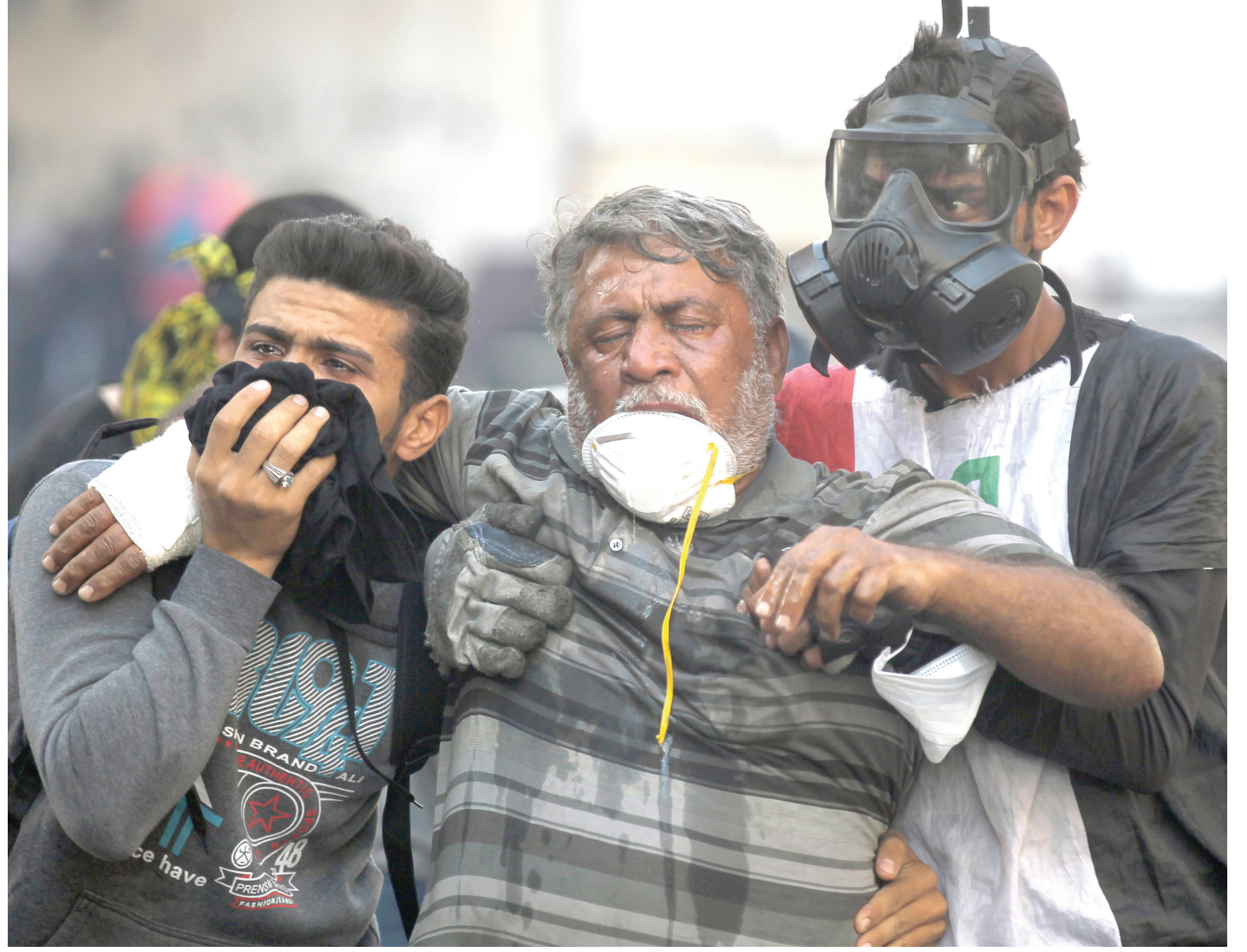
بغداد. طريق الشعب

وأشارت المنظمة إلى أنه ورغم إعلان رئيس الوزراء في مناسبتين على الأقل، إلتزام حكومته بحماية الحريات العامة وحقوق الإنسان، وضعت وزارة الداخلية آليات جديدة لمراقبة ما أسمته المحتوى الهابط، على وسائل التواصل الاجتماعي، وأصدرت أحكاماً بالسجن على ستة أشخاص على أساس هذه الآليات. وحثت المنظمة الحكومة على ضمان إحراز تقدم ملموس في التحقيق المتعلق بالكشف عن ارتكوب جرائم خطيرة مثل الاختطاف والتعذيب والقتل في سياق احتجاجات تشرين الأول 2019 وتقديمهم للعدالة، وإعطاء الأولوية للقضايا التي طال أمدها مثل مشاكل النازحين وإنهاء العنف الجندي وصدور أحكام إعدام في محاكمات مشكوك في دقتها، حسب ما ورد في الرسالة. وأكدت المنظمة على أن المعيار الحقيقي للالتزام الحكومة بحقوق الإنسان ليس فيما تقطعه من وعود، بل في الإجراءات التي تتخذها، لأن شعب العراق يستحق أكثر من مجرد خطاب فارغة وحلقات مكررة من الانتهاكات.