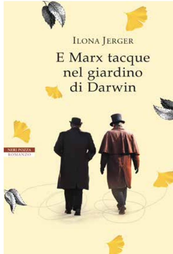
غلاف رواية ايلونا يرغر

والجلد. وكلاهما يؤمنان بالتطور كقانون يحكم الظواهر في عالمنا سواء عالمنا الطبيعي والحيوي أو عالمنا الفكري والاجتماعي. ووجدت يرغر أخيراً ضالتها لخلق نقطة الاتصال عبر تقاطع الحالة الصحية، فاخترت شخصية طبيب الأسرة د. بيكيت، الذي يمتلك حق الوصول إلى المنازل ويعرف ويناقش التفاصيل الخاصة. ووضعت بيكيت في الوقت نفسه كعالم وباحث مهمم بأراء داروين وماركس. تقول يرغر: "توفرت ليبيكيت فرصة لطرح الأسئلة التي كنت أود أن أطرحها على نفسي". فيمكن للطبيب أن ينظر إلى داروين وماركس على طاولة السرير وفي نفس الوقت يناقش معهما ما إذا كان البحث العلمي يمكن أن يكون مناسباً اجتماعياً أو سياسياً أو أيديولوجياً.