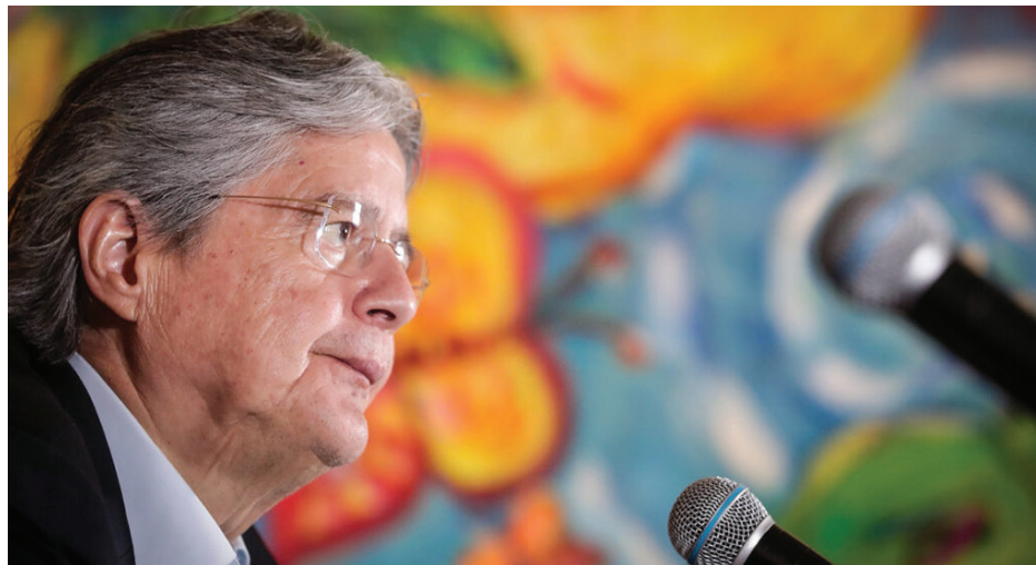
هل ستطيح ملفات الفساد بالرئيس لاسو؟

ورد الرئيس لاسو في البداية في خطابٍ متلفز، بث على جميع القنوات، ناعياً هذه المزاعم، في إشارة