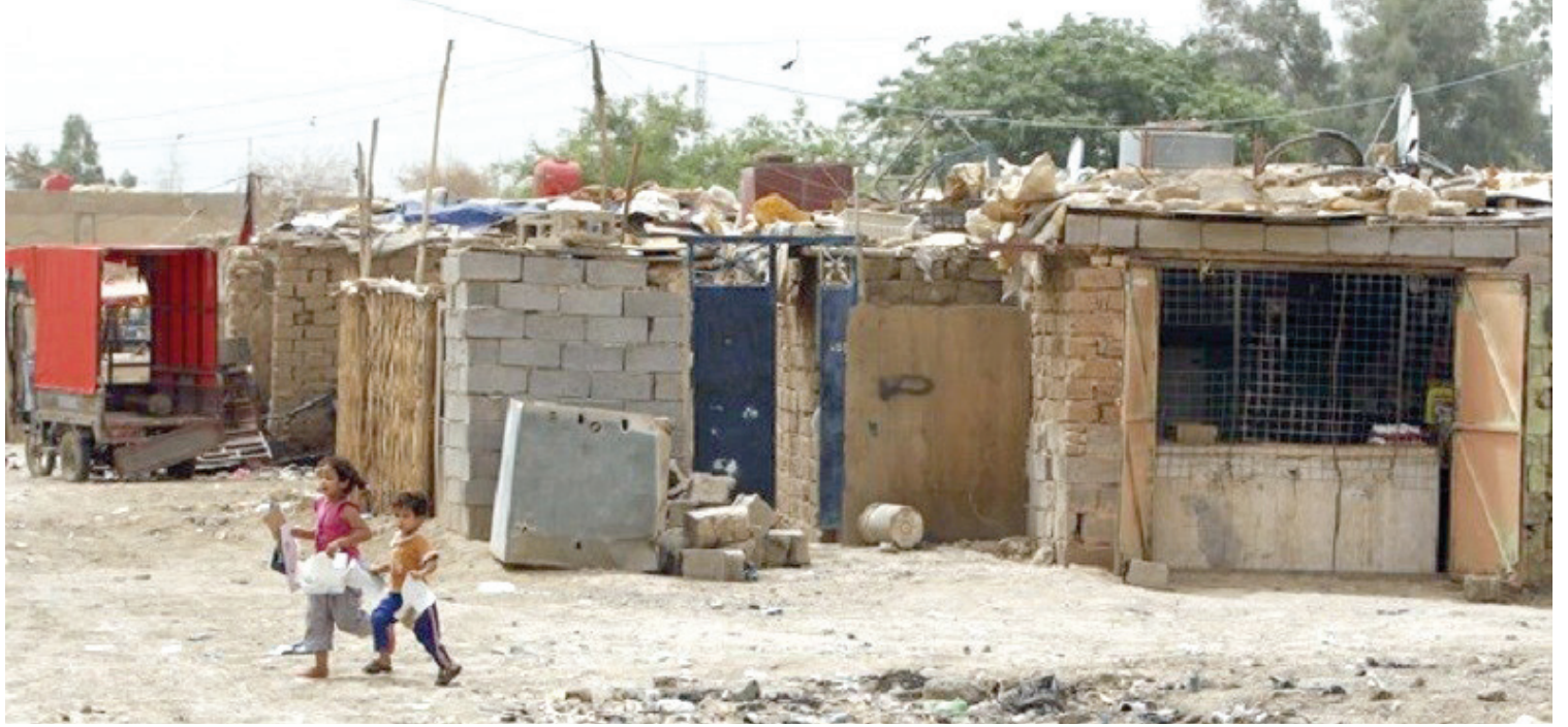
بغداد. طريق الشعب

الأراضي العشوائية هم من أصحاب الدخل المحدود، إذ اشتروها بأسعار بخسة في وقتها، وبنوها دون تنظيم أو تخطيط، وهذا ما سيجعلها أراضي عشوائية حتى بعد التمليك».