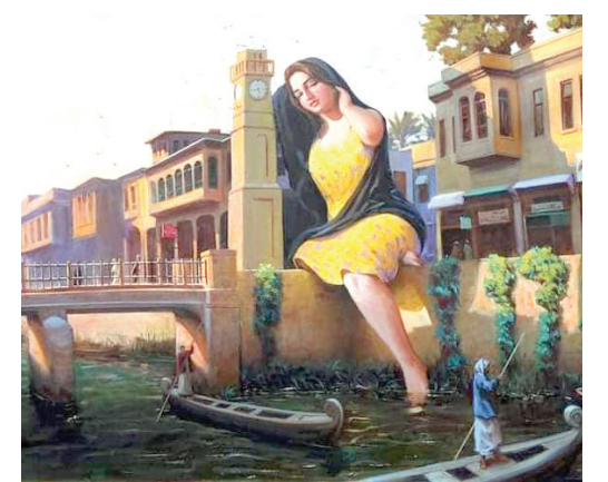
من لوحات المعرض