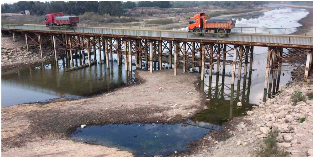
نهر ابو لحية الذي يغذي ٦٠ الف نسمة في قضاء الاصلاح بمحافظة ذي قار على حافة الجفاف