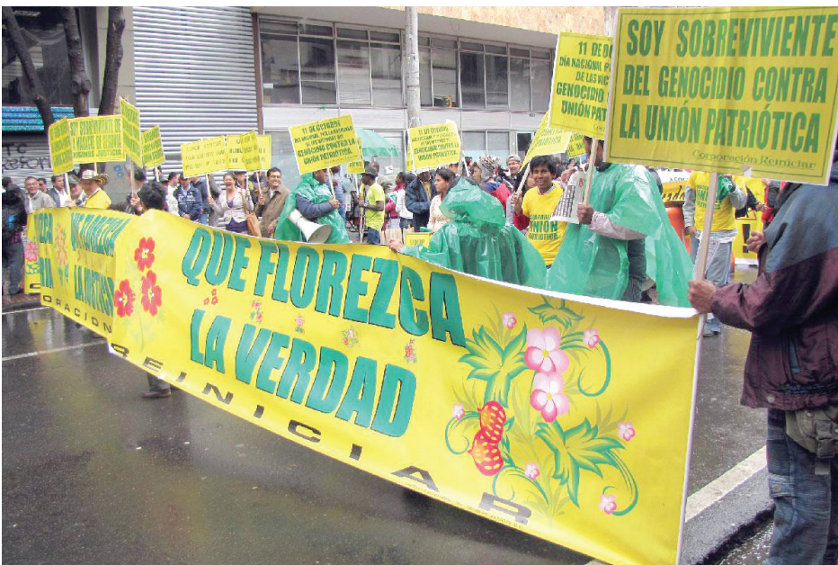
احتجاجات ضد التعامل غير المنصف مع الجرائم بحق اليسار

هذا وإن ما سبق، يعيد للذاكرة العراقية الجرائم التي ارتكبتها انقلابيو ٨ شباط بحق الشيوعيين والوطنيين العراقيين، وضرورة المطالبة بإعادة الاعتبار للضحايا، وعلى هذا الطريق تأتي حملة التواقيع المطالبة بانصاف ضحايا انقلاب شباط الأسود.