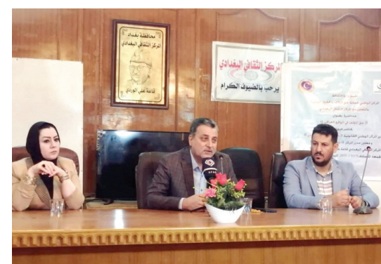
متابعة - طريق الشعب

عقد المركز الوطني لحماية حق المؤلف والحقوق المجاورة، أول أمس الجمعة على «قاعة علي الوردي» في المركز الثقافي البغدادي، ندوة بعنوان «حق المؤلف في الواقع العراقي»، حضرها جمع من المثقفين والأدباء والمهتمين في الشأن الثقافي.