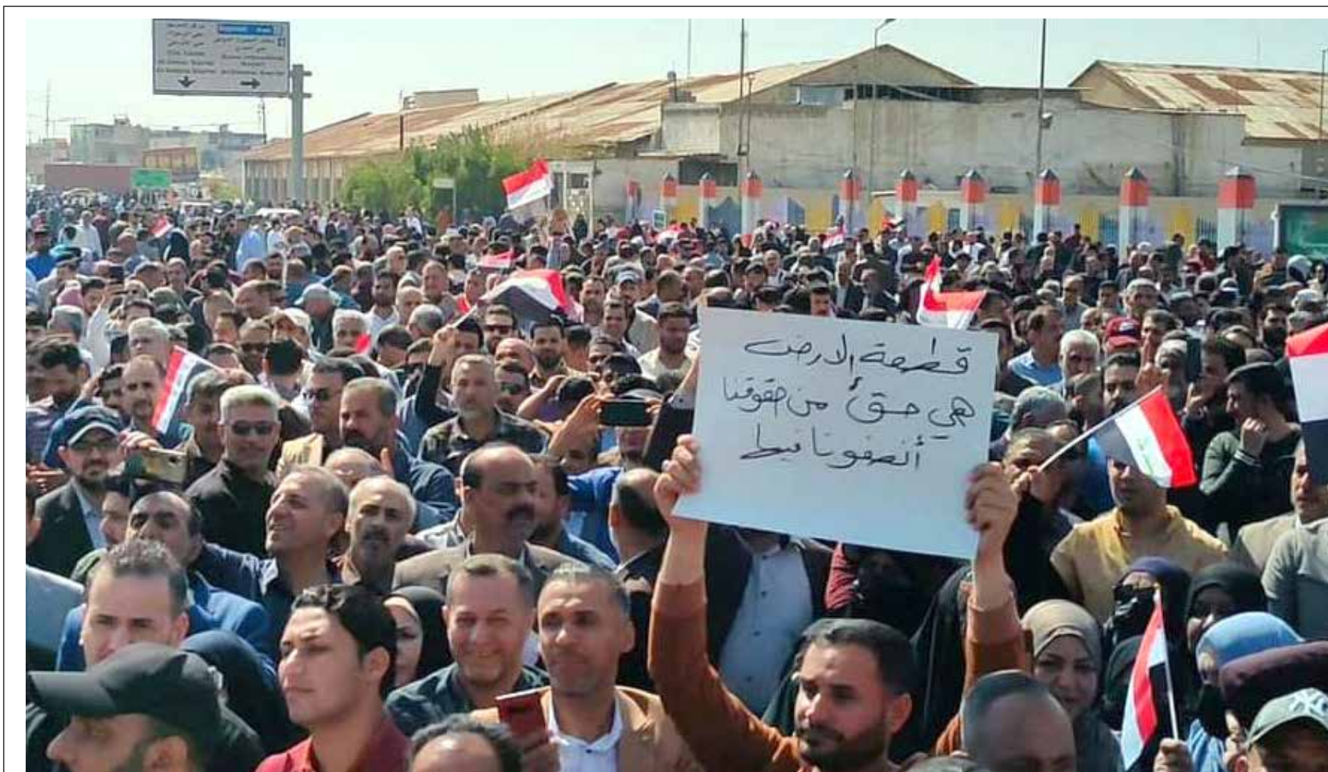
معلمو البصرة يحتجون في يوم عيدهم

محمد شياع السوداني على أولويات حكومته من "توفير فرص العمل" و"مكافحة الفقر ومكافحة الفساد". ومن المؤمل ان يزور غوتيريش اليوم الخميس مخيماً للنازحين في شمال العراق، قبل أن يتوجه إلى أربيل حيث سيلتقي ممثلين عن حكومة إقليم كردستان.