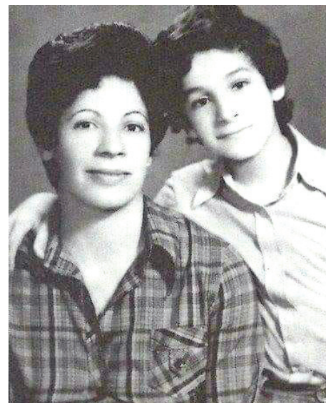
الشهيدة عايدة ياسين وابنها علي

عام 1976 انتخبت عايدة ياسين لعضوية اللجنة المركزية للحزب الشيوعي العراقي في المؤتمر الثالث، لتكون ثالث امرأة تنتخب لهذا الموقع، حيث كانت (امينة الرحال) المرأة الاولى ضمن اللجنة المركزية للأعوام (1941 - 1943)، ثم الدكتورة (نزيهة الدليمي) والتي كانت الوزيرة الاولى في تاريخ حكومات العراق وعلى مستوى منطقة