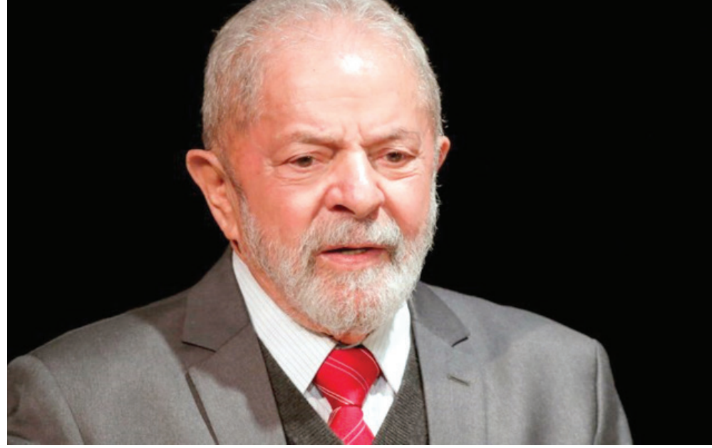
الرئيس البرازيلي يطرح مبادرة للسلام

وفي الذكرى السنوية الأولى للغزو الروسي، جدد الرئيس البرازيلي، عبر تويتر مبادرته: "في وقت تحتاج فيه البشرية إلى السلام في مواجهة العديد من التحديات، تستمر، منذ عام، الحرب بين روسيا وأوكرانيا. ومن الملح أن تتحمل مجموعة من البلدان غير المتورطة في النزاع مسؤولية بدء مفاوضات استعادة السلام". وفي مقابلة مع وكالة الأنباء الروسية تاس، قال نائب وزير الخارجية الروسي غالوزين: إن روسيا "أحييت علماً بتصريحات الرئيس البرازيلي بشأن مسألة الوساطة الممكنة من أجل إيجاد وسائل سياسية لتجنب التصعيد في أوكرانيا وتصحيح الحسابات الخاطئة في مجال الأمن الدولي على أساس التعددية ومراعاة مصالح جميع الجهات الفاعلة". وأضاف، "أود أن أؤكد أن روسيا تقدر الموقف المتوازن للبرازيل في الوضع الدولي الحالي. لقد رفضت البرازيل الإجراءات القسرية الأحادية التي اتخذتها الولايات المتحدة وأقمارها الصناعية ضد بلدنا ورفضت