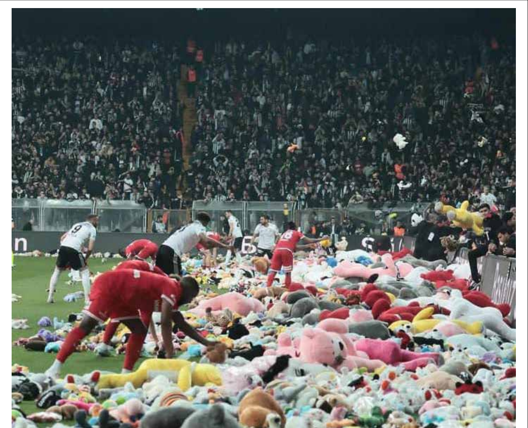
الآلاف من دمي الدبية وغيرها من الألعاب المحشوة ألقيت في أرض الملعب خلال مباراة في اسطنبول بين فريقين بشكتاش وأنطاليا سبور كتبرع للأطفال الناجين من الزلزال في تركيا

أعلنت لجنة الاستئناف في الاتحاد العراقي لكرة القدم، أمس الأربعاء، إلغاء جميع مقررات لجنة الانضباط السابقة بشأن مباراة نادي الشرطة والقاسم في الدوري الممتاز، فيما كشفت عن عقوبات جديدة بحق إداريين ولعابين من نادي الشرطة ومدرب نادي القاسم وأحد لاعبي النادي. وقال الاتحاد في بيان إن "لجنة الاستئناف في الاتحاد العراقي لكرة القدم اجتمعت، وناقشت طلب الاستئناف المقدم من قبل نادي الشرطة الرياضي، وقررت قبوله شكلاً من الناحية القانونية"، وأضاف البيان "بعد الاطلاع على الأوليات وقرار لجنة الانضباط بالعدد 18 في 15/2/2023 قررت اللجنة، إلغاء قرار لجنة الانضباط بالعدد 18 في 15