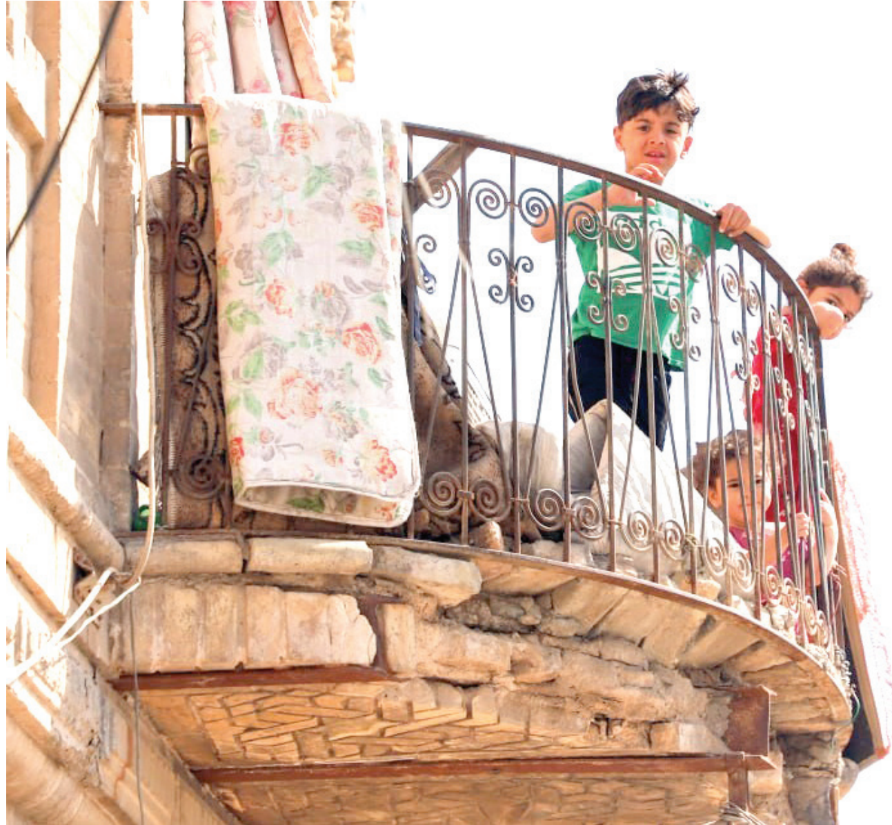
العراقيون يعيشون في منازل متهاكّة.. ولا تفعل الحكومات سوى اطلاق العود الزائفة