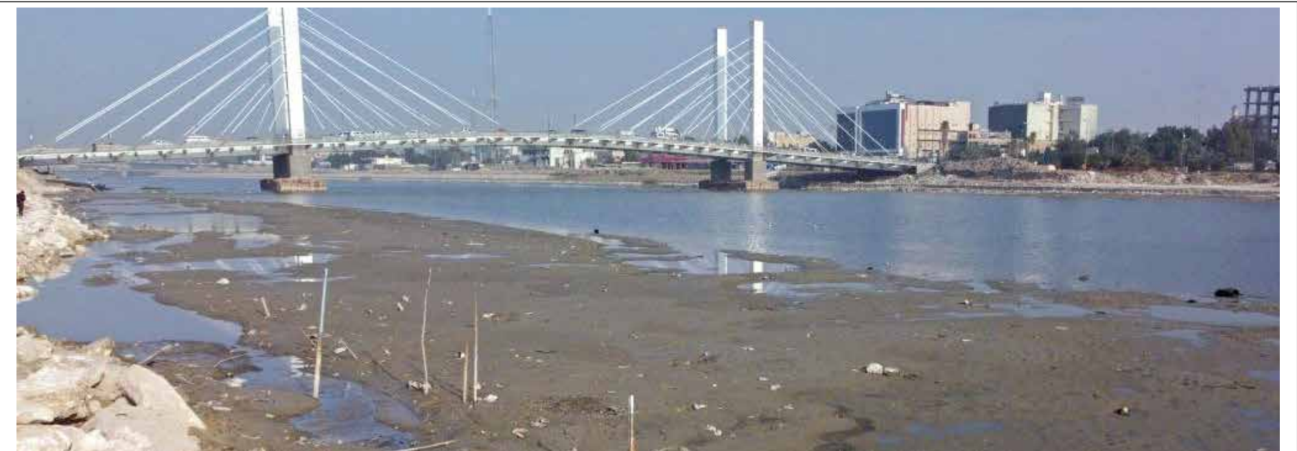
انخفاض مخيف في مناسيب نهر الفرات