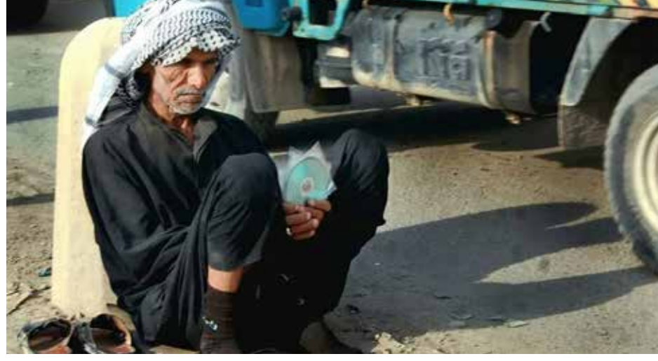
مواطن مسن ينتظر دوره قرب احد مكاتب الانترنت من اجل التقديم على رواتب الرعاية الاجتماعية

وأضاف الهنداوي في حديث خص به "طريق الشعب"، أن هذين المعيارين "هما الحاكمان في عملية تحقيق العدالة الاجتماعية في الجانب التنموي والاقتصادي.