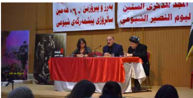
ندوة عن الحركة الانصارية