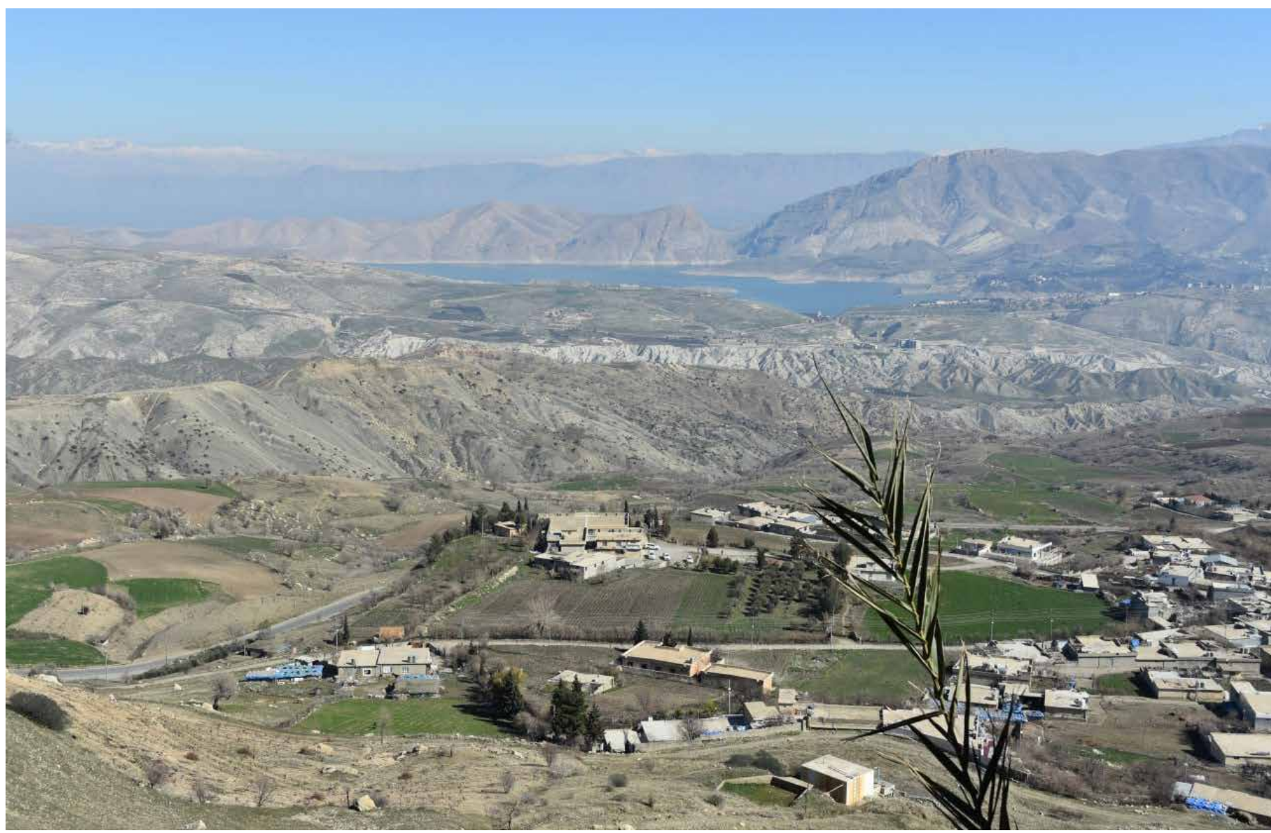
هنا في قرية كه لكه سماقة الكردستانية انشأ الحزب الشيوعي العراقي اول قاعدة انصارية لمقاومة انقلابي 8 شباط الاسود <<7 شاعر عبد جبار

من جانب اخر، اعتبرت حركة امتداد في بيان ورد لـ"طريق الشعب" نسخة منه، أن إنهاء القراءة الأولى لمشروع قانون البيانات المالية لسنة 2014، فيه حياكة قانونية مفادها تبرئة الحكومة آنذاك من ضياعها، وان مناقشتها بعد مضي تسع سنوات ما هي الا باب من ابواب المشاركة في سرقة قوت الشعب". وطالبت الحركة وكتلتها النيابية ضمن البيان بالتوجه لإجراء "تحقيق شامل من قبل مؤسسات عالمية متخصصة، ومشاركة ديوان الرقابة المالية وهيئة النزاهة ومنظمات المجتمع المدني، وخبراء ماليين قبل شرعة بياناتها المالية من قبل مجلس النواب الحالي". ونبه البيان الى أن "مجلس النواب الحالي يهيم عليه