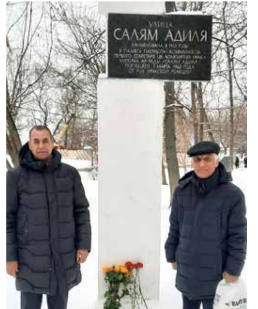
موسكو - طريق الشعب

في مناسبة يوم الشهيد الشيوعي العراقي 14 شباط، زار وفد من منظمة الحزب في روسيا الاتحادية، النصب التذكاري للشهيد خالد سلام عادل في العاصمة موسكو. وعند النصب، استذكر الرفاق المواضع البطولية المشهوددة للشهيد سلام عادل، وصلابته وشجاعته في مواجهة انقلاب شباط الأسود 1963.