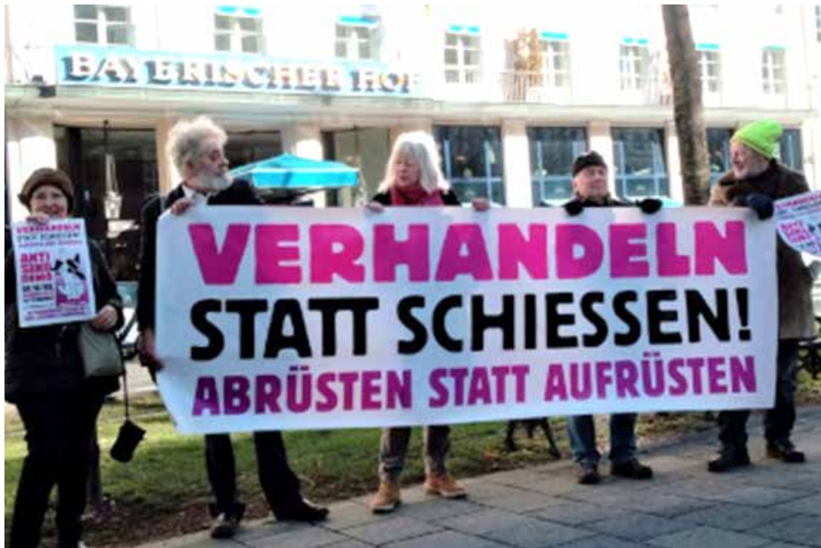
التفاوض بدلا من الحرب، خفض التسلح بدلا من تصعيده

العديد من المساهمات، قدمت قراءة معكوسة للمخاطر: من الخطأ أن يخشى الغرب التصعيد، وعلى بوتين أن يخشى التصعيد الذي يديره الغرب، من هنا تأتي أهمية تزويد أوكرانيا بأسلحة هجومية. في كلمته، أوضح السكرتير العام لحلف الناتو ينس ستولتنبرغ، ان الأمر لا ينحصر بأوكرانيا فقط، بل أن الحرب تشكل حافزاً في الصراع من أجل نظام عالمي