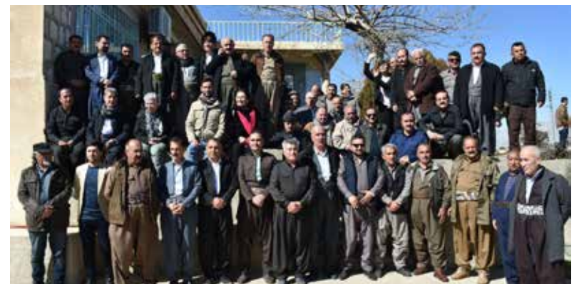
المشاركون في المهرجان زارو قرية كه لكه سماق