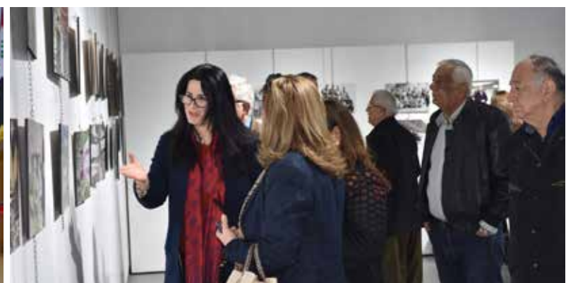
معرض صور فوتوغرافية عن الحركة الانصارية