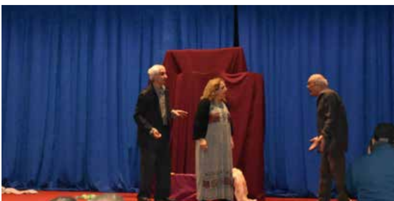
مسرحية «سوادين عراقية» لفرقة بنايبي المسرحية