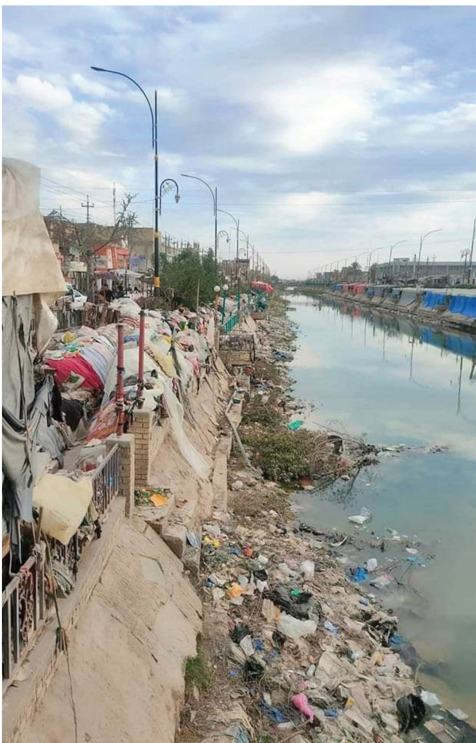
نهر الغراف وسط مدينة الشطرة، ماؤه ملوث وشفافه غاصة بالنفايات، فيما التجاوزات أخفت معالمه!