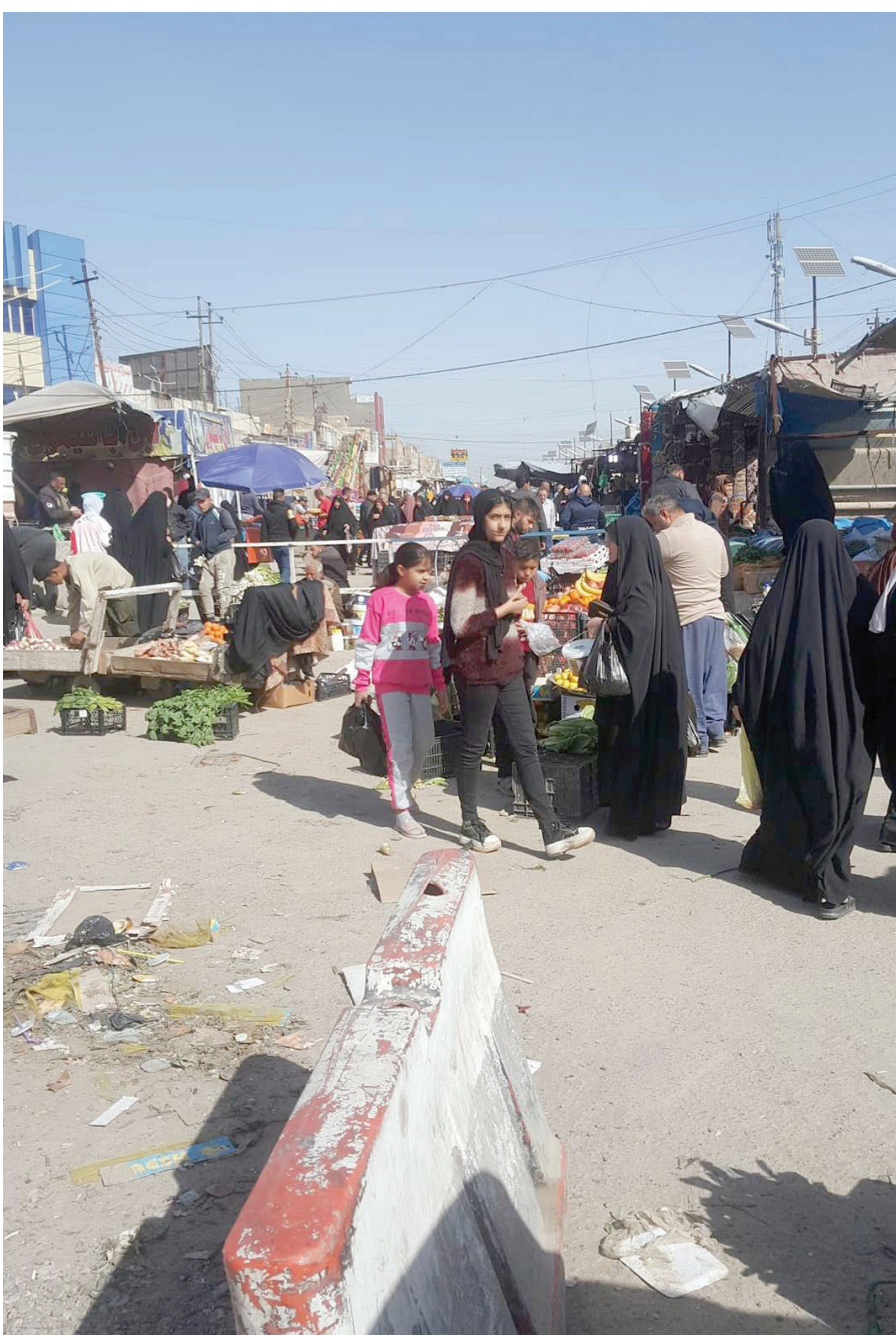
شوارع تغلق وتلغى وتحول إلى أسواق شعبية.. شارع منطقة «الشرطة الرابعة» في بغداد أهوذجاً! هل بات عصيا على الجهات المعنية إنشاء أسواق نظامية تؤوي الباعة الجوالين!؟