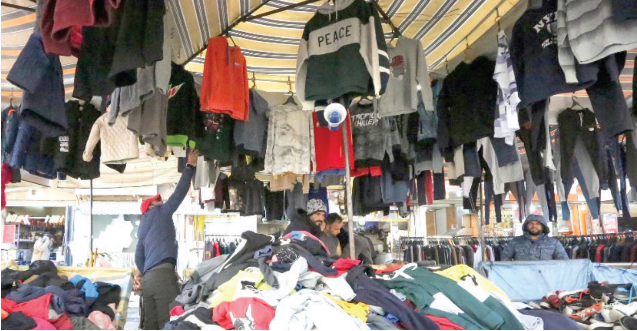
متابعة - طريق الشعب

أدى انخفاض قيمة الدينار العراقي مقابل الدولار الأمريكي، إلى تدهور أحوال الأسواق التجارية بشكل عام. إذ أثرت هذه الأزمة على معظم القطاعات التجارية والاقتصادية، ومنها سوق الملابس الجديدة الذي شهد ركودا غير مسبوق في عموم البلاد. في حين ازداد توجه المواطنين، خاصة الفقراء وذوو الدخل المحدود، نحو الملابس المستعملة (البالة)، التي تبدو أسعارها مناسبة لهذه الشرائح.