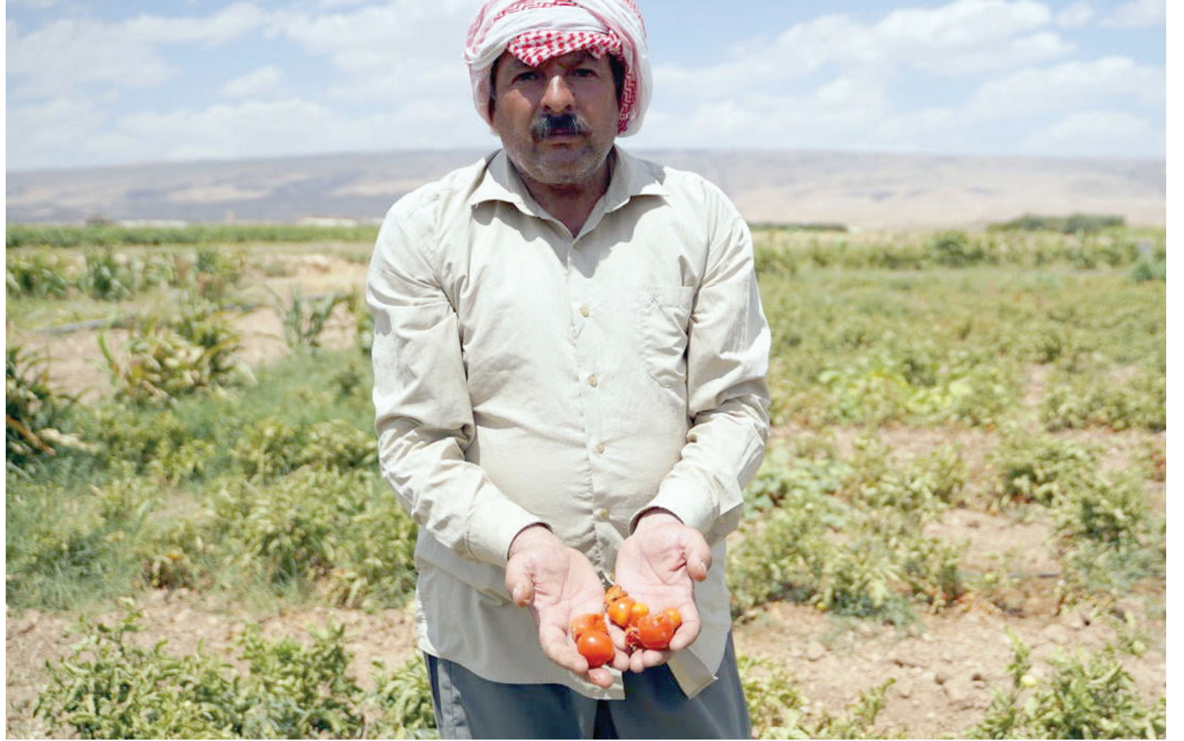
مزارع من سنجار يوضح كيف أتلّف الجفاف الخضروات في مزرعته

ويوضح، أن شح المياه لا يرتبط بالتغيرات المناخية بشكل أساسي، إنما بالإدارة السيئة لملف المياه في البلد، إضافة إلى قطع المياه عن العراق من قبل دولتي تركيا وإيران. يقول جعفر التلعفري (باحث وكاتب)، من سكان منطقة تلعفر، إن الأهالي يعتمدون على الزراعة بشكل كبير منذ عقود، كونها منطقة خصبة وصالحة للزراعة، موضحاً أن «سقي المزارع يعتمد على الأمطار بالدرجة الأولى (الزراعة الدائمة)».