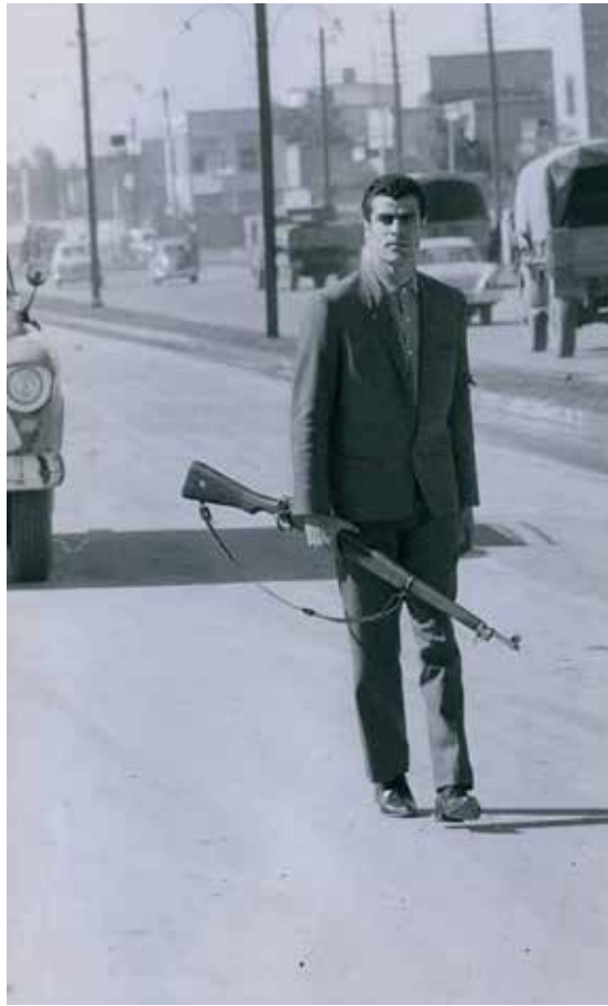
افراد الحرس القومي ينتشرون في الشوارع بالزي المدني حاملين اسلحتهم

وليبقى الثامن من شباط يوماً أسود في ذاكرة العراقيين..