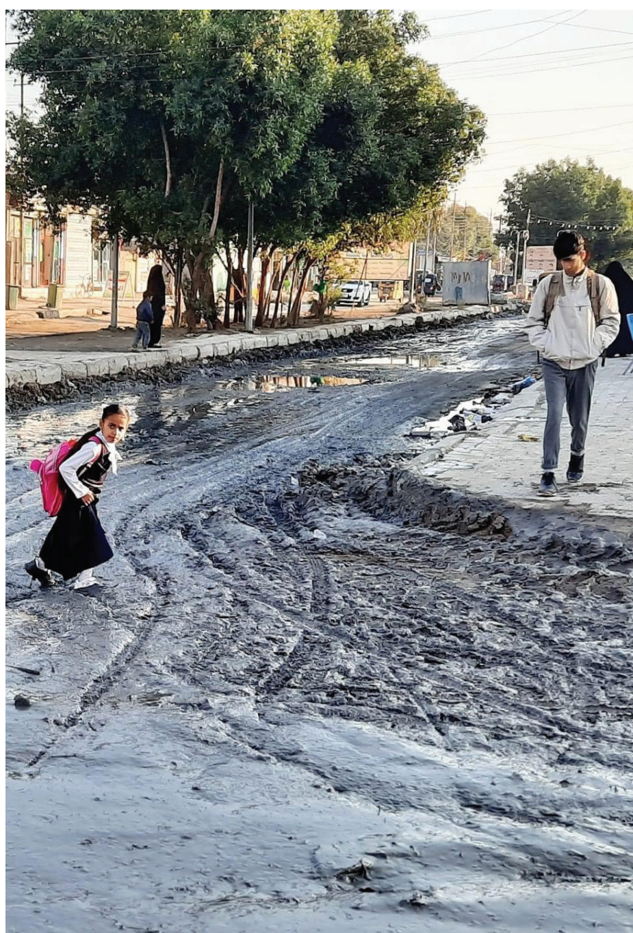
انها ناحية النهروان شرقي بغداد.. هكذا تبدو وهي خارج نطاق الخدمات!