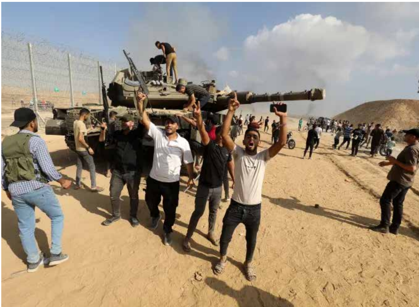
بين «طوفان الأقصى» و «القبة الحديدية».. اللحظات الاولى لاقتحام الجدار العازل في غزة

• توقف الامدادات إلى إسرائيل عن طريق البحر الاحمر نتيجة تضامن الشعب اليميني مع الشعب الفلسطيني. • الخسائر التي تحملتها أمريكا والغرب والتي تقدر بعشرات المليارات نتيجة جلب أساطيلها لمنطقة الشرق الأوسط. • وصول صواريخ المقاومة لكافة المدن الاسرائيلية بما فيها تل ابيب والقدس الغربية. • تدمير أكثر من (١٠٠٠) دبابة والية مدرعة وجرافة. • مقتل أكثر من (١٥٠٠) مستوطن صهيوني. • مقتل أكثر من (٥٠٠) جندي إسرائيلي علماً أن العدو الصهيوني لا يعلن عن الارقام الصحيحة. • جرح أكثر من (٢٥٠٠) جندي صهيوني. • أسر أكثر من (٢٠٠) جندي ومستوطن من بينهم قادة برتب عالية. • استمرار التظاهرات في إسرائيل للمطالبة بإعادة الأسرى ووقف الحرب وأصبح وضع حكومة الاحتلال الصهيوني مهزوزا. • إعادة الروح المعنوية وبتواتر سريعة لأبناء شعبنا الفلسطيني في غزة والضفة الغربية والقدس والشات وكذا لأبناء الشعوب العربية وإعادة التعريف بالحق الفلسطيني وإظهاره بوجه ناصح وردع كل المشككين بإمكانية عودة الحق الفلسطيني • دفع المقاومة الفلسطينية للعمل الجاد من أجل توحيد صفوفها والعمل المشترك لإنهاء الاختلاف والاحتلال. • لتعش المقاومة الفلسطينية حرة ابيه