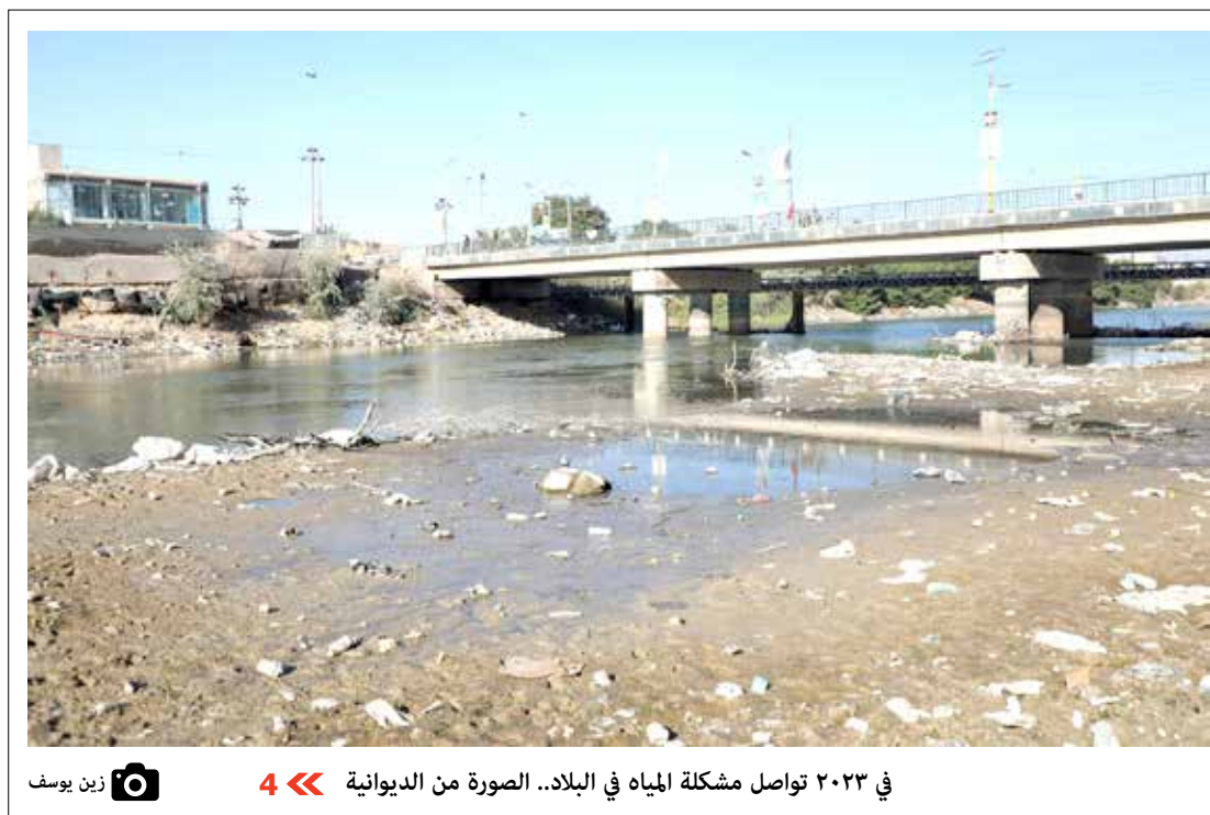
في ٢٠٢٣ تواصل مشكلة المياه في البلاد.. الصورة من الديوانية &lt;&lt; 4 زين يوسف

عملية تطبيق السياسة الضريبية في العراق، فضلاً عن كثرة الإعفاءات الضريبية وتبويب منافذ الأموال وعدم كفاءة الهيئة العامة للضرائب، إضافة إلى ضعف إدارتها للعمل الضريبي وانتشار الفساد فيها». ورهن عيد النهوض بالواقع الضريبي العراقي بـ«العمل على إجراء إصلاحات إدارية شاملة للهيئة العامة للضرائب التي تُدار اليوم حزبياً، بعيداً عن المهنية والكفاءة، والعمل على تطوير قدرات الكوادر الضريبية، بالإضافة إلى إعادة صياغة قانون النظام الضريبي وتفعيل الأساليب الحديثة في الجباية، من خلال تفعيل الرقم الضريبي للمكلف، وتفعيل نظام الرقابة والحوكمة على أداء عمل الهيئة ومراقبة كوادرها».