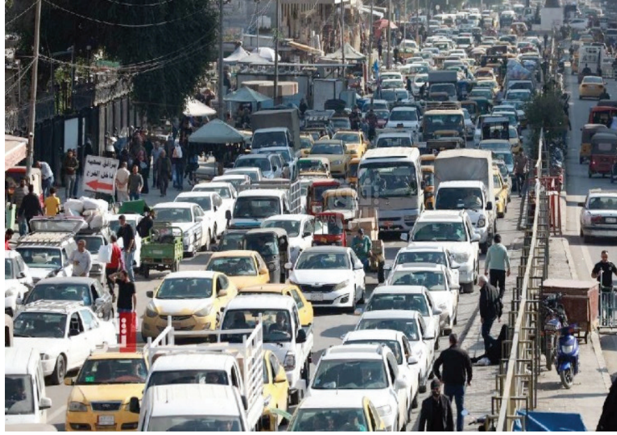
قراة 3.7 ملايين سيارة في بغداد مقابل شوارع لا تستوعب أكثر من 400 ألف!

ولم يكن هذا الحادث الأول، ولن يكون الأخير في ظل تهالك الشوارع الرئيسية وعدم وجود أماكن مخصصة لعبور المارة. فقد سبقه تسجيل حادث دهس خلف كسوراً طالب آخر في الكلية ذاتها، التي لم تُنشئ