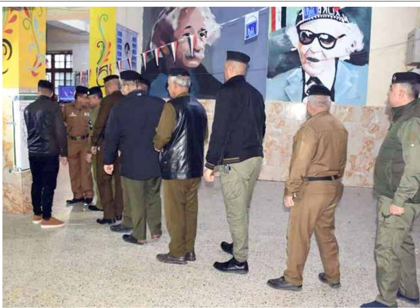
مصوتون في احد مراكز الاقتراع الخاص

وتتمت الدورة الانتخابية لمجالس المحافظات العراقية 4 سنوات تبدأ مع أول جلسة لها، وفقاً لقانون المحافظات غير المنتظمة في إقليم، الصادر عام 2008. يذكر ان نحو 500 شخص من جنسيات مختلفة، يقومون بمراقبة عملية انتخابات مجالس المحافظات في العراق.