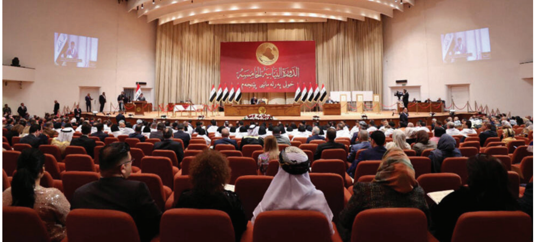
مجلس النواب في انتظار ارسال جداول موازنة العام المقبل من الحكومة