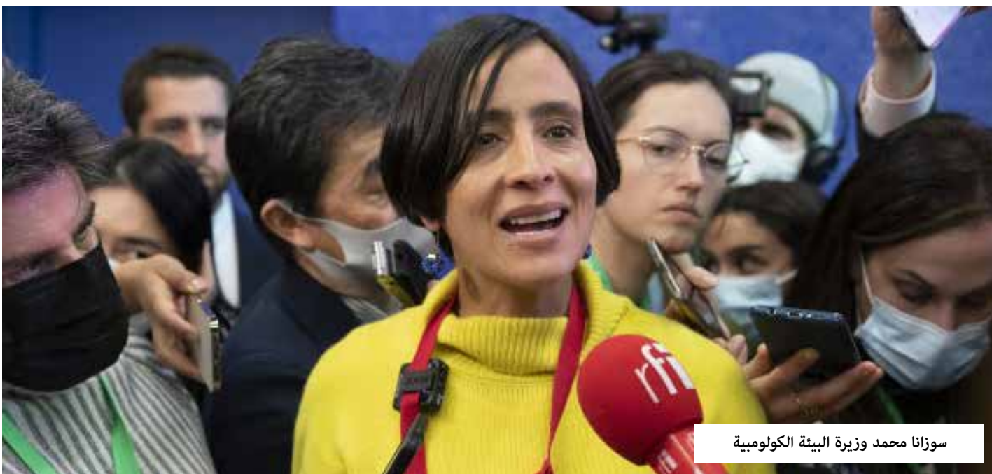
سوزانا محمد وزيرة البيئة الكولومبية

قبل المؤتمر قدمت كولومبيا التي ترأسها حكومة يسارية لأول مرة في تاريخها، خطة جديدة لمكافحة إزالة الغابات وأعلنت وقف جميع تراخيص استخراج النفط والغاز الجديدة. لم يكن هذا قرارا سهلا بالنسبة لدولة لا يزال النفط فيها على رأس قائمة أهم الأصول في عام 2020. وفي المؤتمر، انضمت كولومبيا إلى معاهدة عدم انتشار الوقود الأحفوري، وهي معاهدة دولية مقترحة على غرار الاتفاقيات الرامية إلى إنهاء سباق التسلح النووي. وهي أول دولة منتجة للمواد الهيدروكربونية تفعل ذلك.