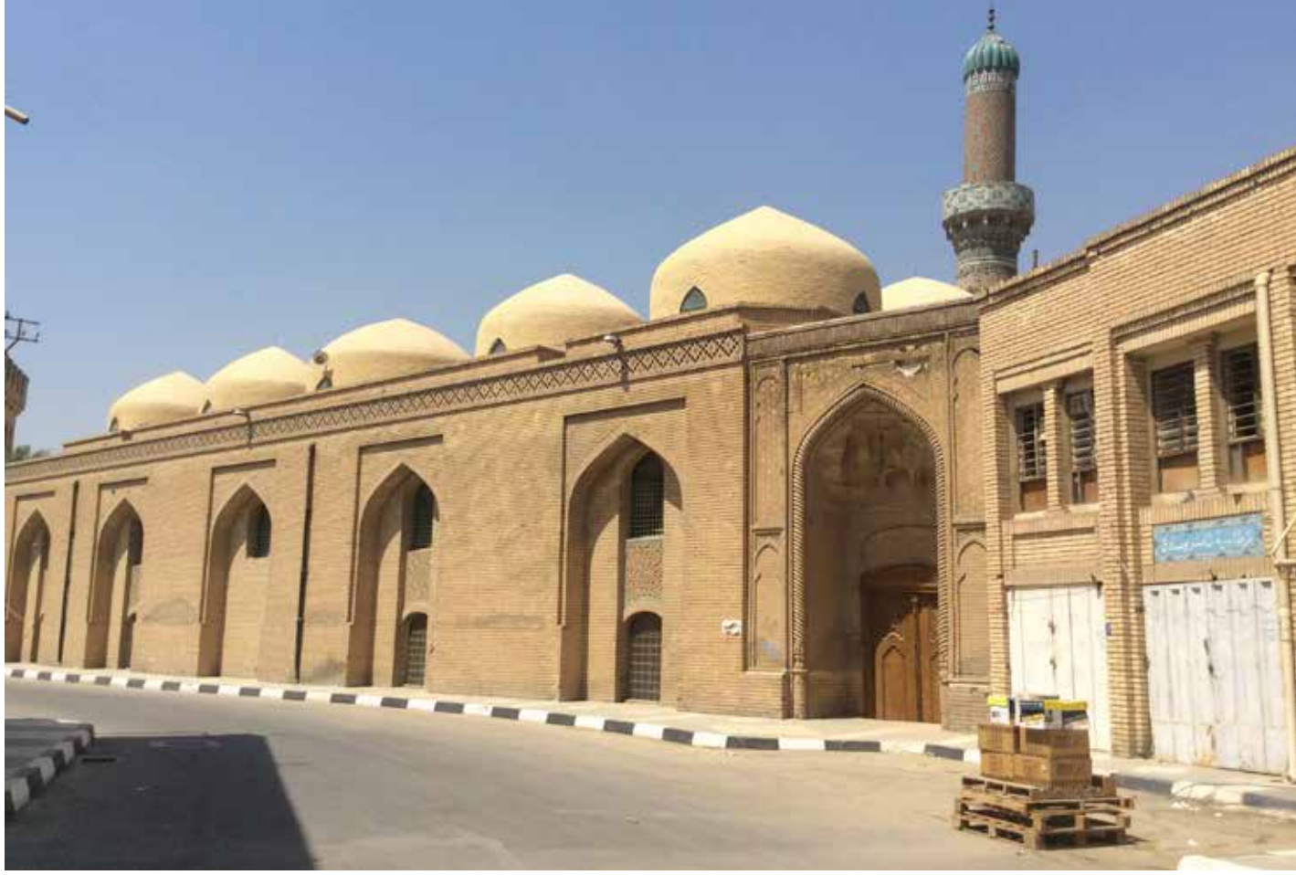
جامع السراي يعد من مساجد بغداد التاريخية الشهيرة في بغداد، وقد شيد عام 589 هـ/1193م